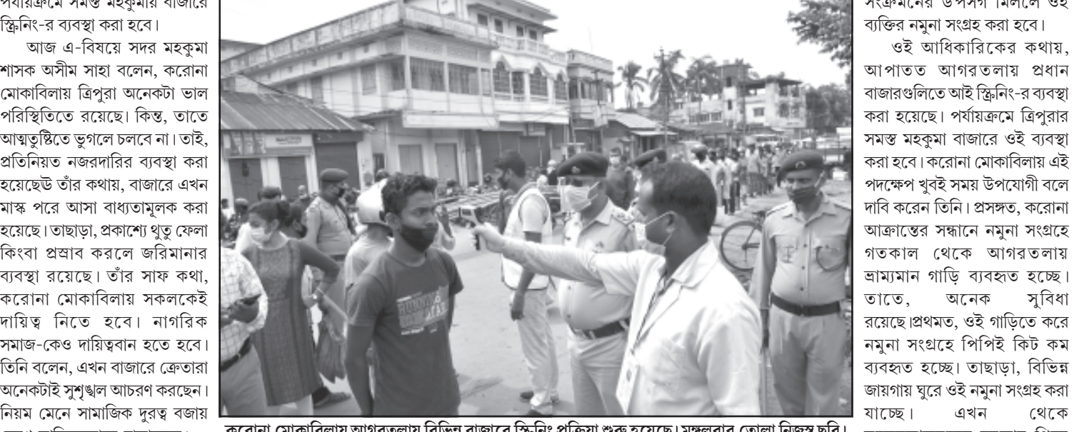
করোনা মোকাবিলায় আগরতলায় বিভিন্ন বাজারে স্ক্রিনিং প্রক্রিয়া শুরু হয়েছে। মঙ্গলবার তোলা নিজস্ব ছবি।

নিজস্ব প্রতিনিধি, আগরতলা, ২৮ এপ্রিল। করোনা মোকাবিলায় নজরদারি আরও কঠোর করা হয়েছে। মঙ্গলবার থেকে আগরতলার সমস্ত বাজারে স্ক্রিনিং করার ব্যবস্থা করা হয়েছে। তার অন্য কোন উপসর্গ যেমন সর্দি কিংবা কাশি থাকলে সেই তথ্য সংগ্রহ করা হবে। করোনা সংক্রমণের উপসর্গ মিললে ওই ব্যক্তির নমুনা সংগ্রহ করা হবে।