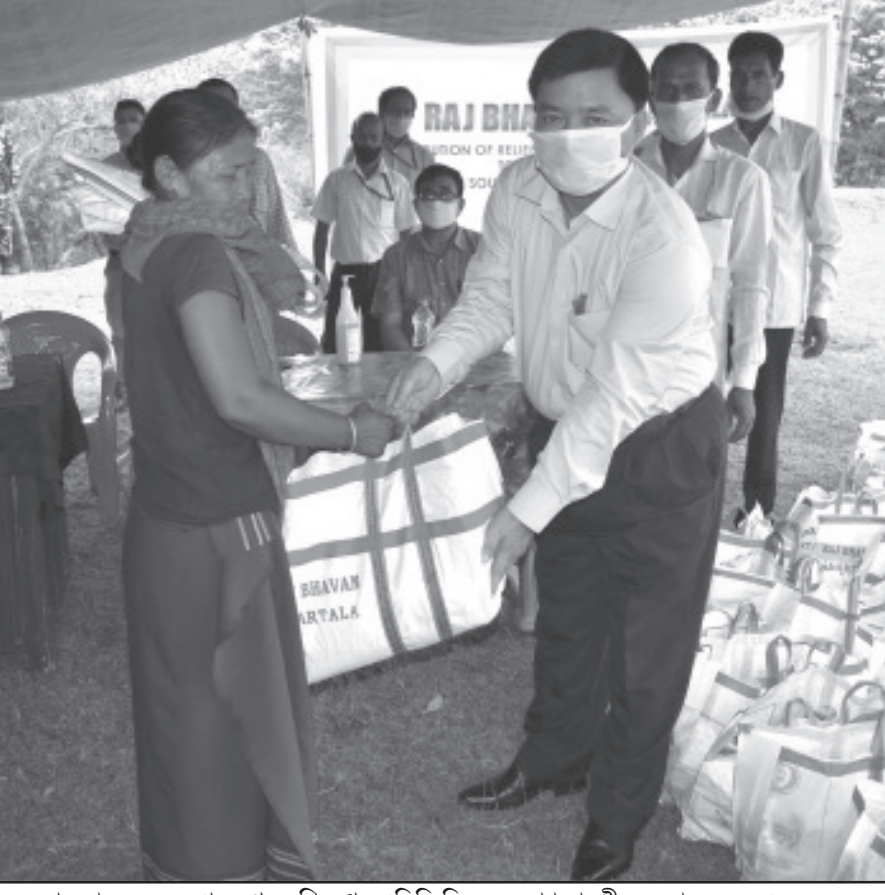
মঙ্গলবার রাজ ভবনের পক্ষ থেকে শিবনগর এডিসি ভিলেজে ত্রাণ সামগ্রী সরবরাহ হয়েছে।

চণ্ডীগড়, ২৮ এপ্রিল (হি.স.): করোনা আবহে সংক্রমণ এড়িয়ে লকডাউন ভঙ্গকারীদের ধরতে অভিনব উদ্যোগ চণ্ডীগড় পুলিশের। প্রশাসন এক নতুন ধরনের ডিভাইস তৈরি করেছে যার সাহায্যে সামাজিক দূরত্ব বজায় রেখেই পুলিশ আইন অমান্য কারীদের ধরে ফেলাতে পারবেন। করোনা মোকাবিলায় দেশ জুড়ে চলছে লক ডাউন। কিন্তু তার মধ্যেও বেশ কয়েকজন মানুষ এই নিয়ম না মেনে রাস্তাতে বেরিয়ে পরছেন। সেই সকল মানুষকে ধরার জন্য এবং রাজ্য জুড়ে শান্তি বজায় রাখার জন্য এক নতুন ধরনের ডিভাইস ব্যবহার করছে চণ্ডীগড় পুলিশ। প্রশাসনের তরফ থেকে রড দিয়ে এক নতুন ধরনের ডিভাইস তৈরি করা হয়েছে। এই রডের মুখে লাগান অংশ যারা লক ডাউন অমান্য করবেন তাদের কোমরে আটকে যাবে। ওই ডিভাইসের অপর প্রান্ত থাকবে পুলিশের হাতে। অর্থাৎ না ধরেও পুলিশ আইন অমান্য কারীদের ধরে ফেলাতে পারবেন। চণ্ডীগড় পুলিশ প্রধান এই ডিভাইসের ছবি সোশ্যাল মিডিয়ায় শেয়ার করেছেন। আর এও জানিয়েছেন কিভাবে আইন ভাঙলে এই ডিভাইস দৌষীদের ধরবে। ক্যাপশনে লিখেছেন সন্দেহভাজন ব্যক্তি এবং আইন ভঙ্গকারীদের ধরার জন্য ভালো উপায়। এই ডিভাইস বানিয়েছেন চারজন পুলিশ আধিকারিক।