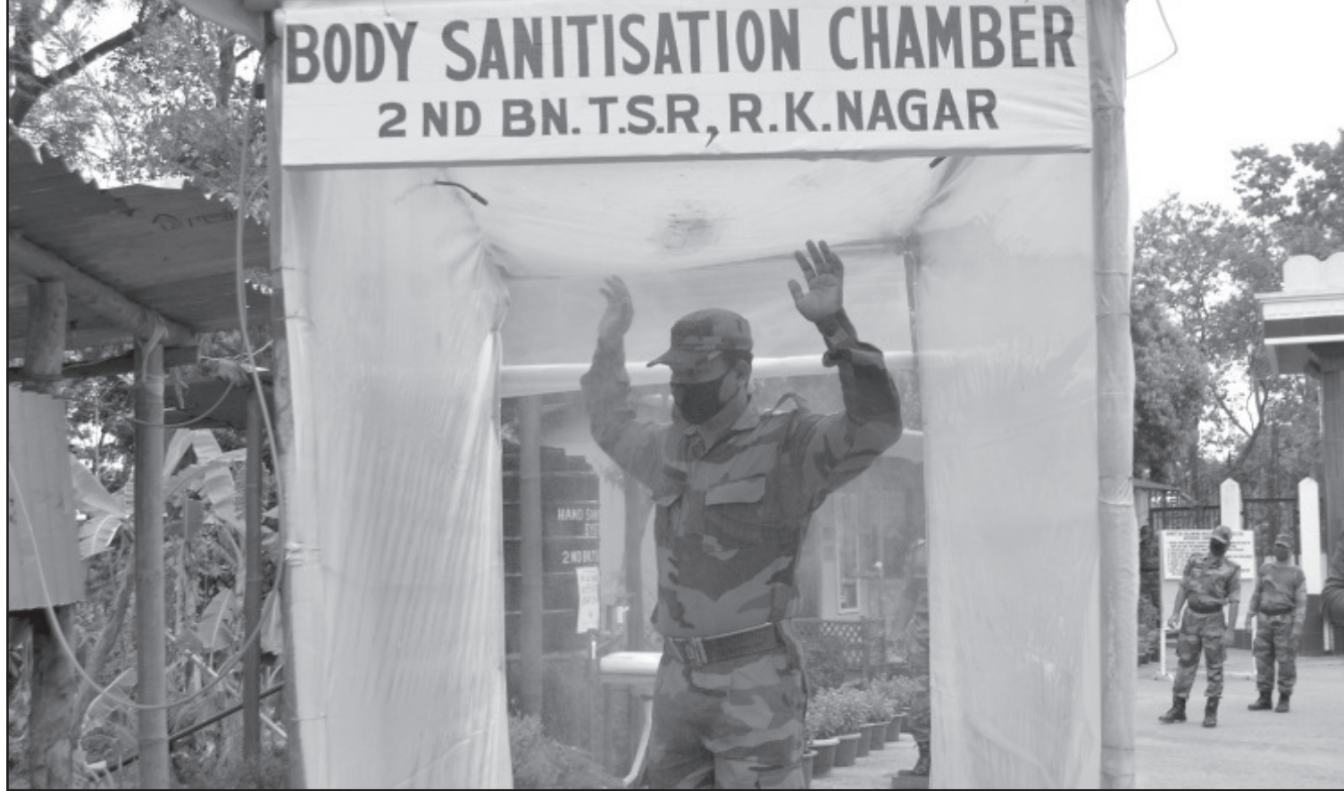
করোনা মোকাবিলায় সারা শরীর স্যানিটাইজ করার জন্য টিএসআর ২ নং ব্যাটেলিয়ানের যন্ত্র বসানো হয়েছে।