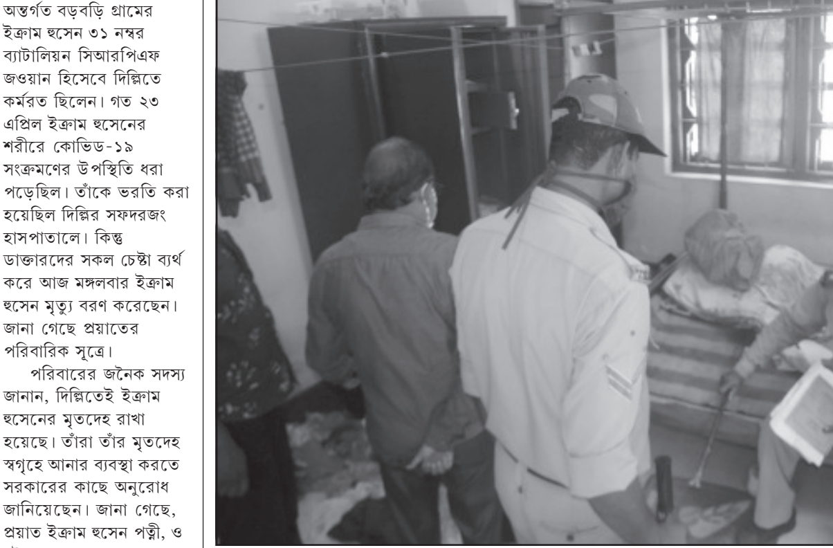
মঙ্গলবার রামনগরে চুরির ঘটনায় পুলিশ তদন্ত করছে।