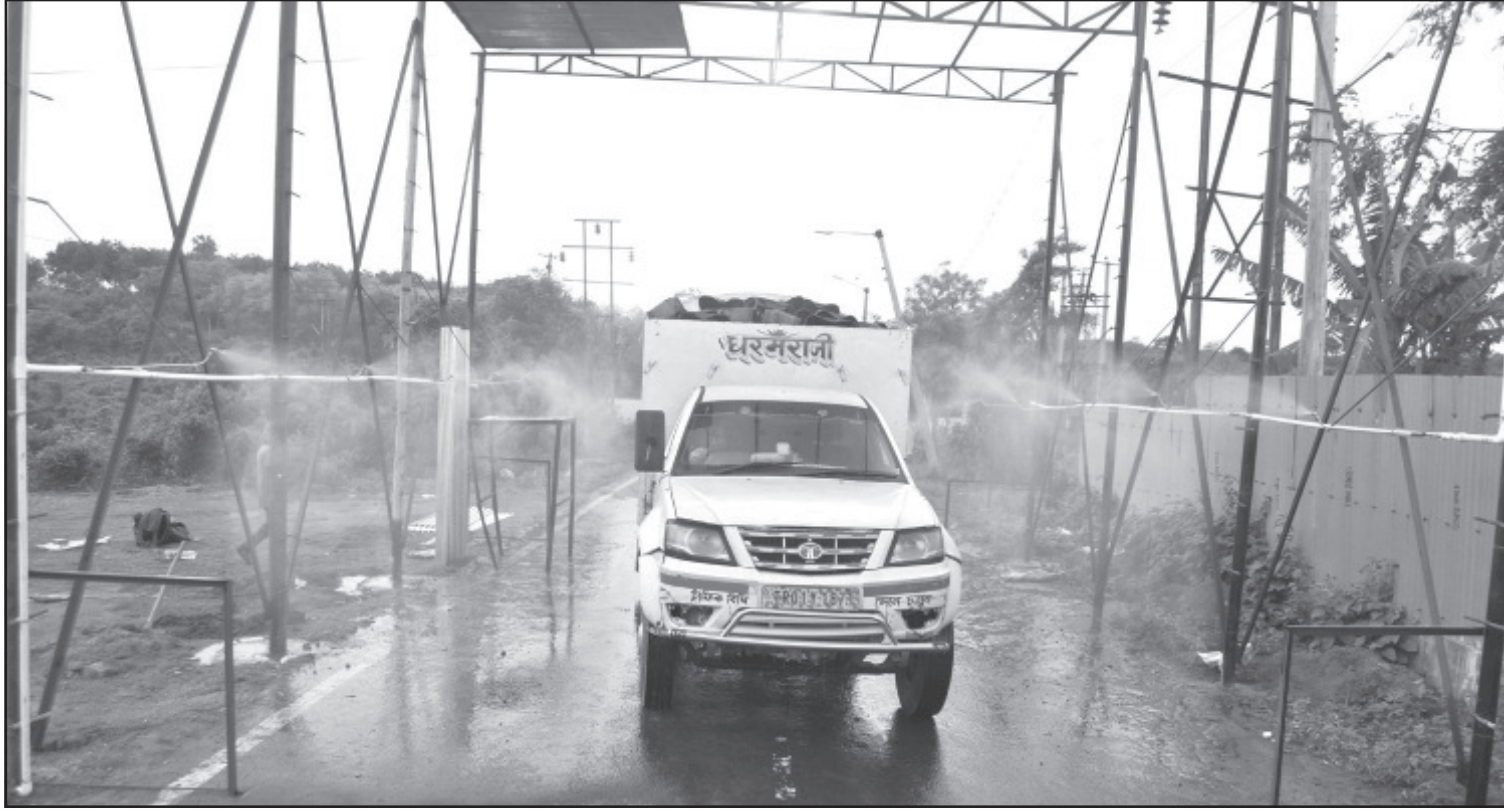
মঙ্গলবার বোধজং নগরে যানবাহন স্যানিটাইজ করা হচ্ছে।