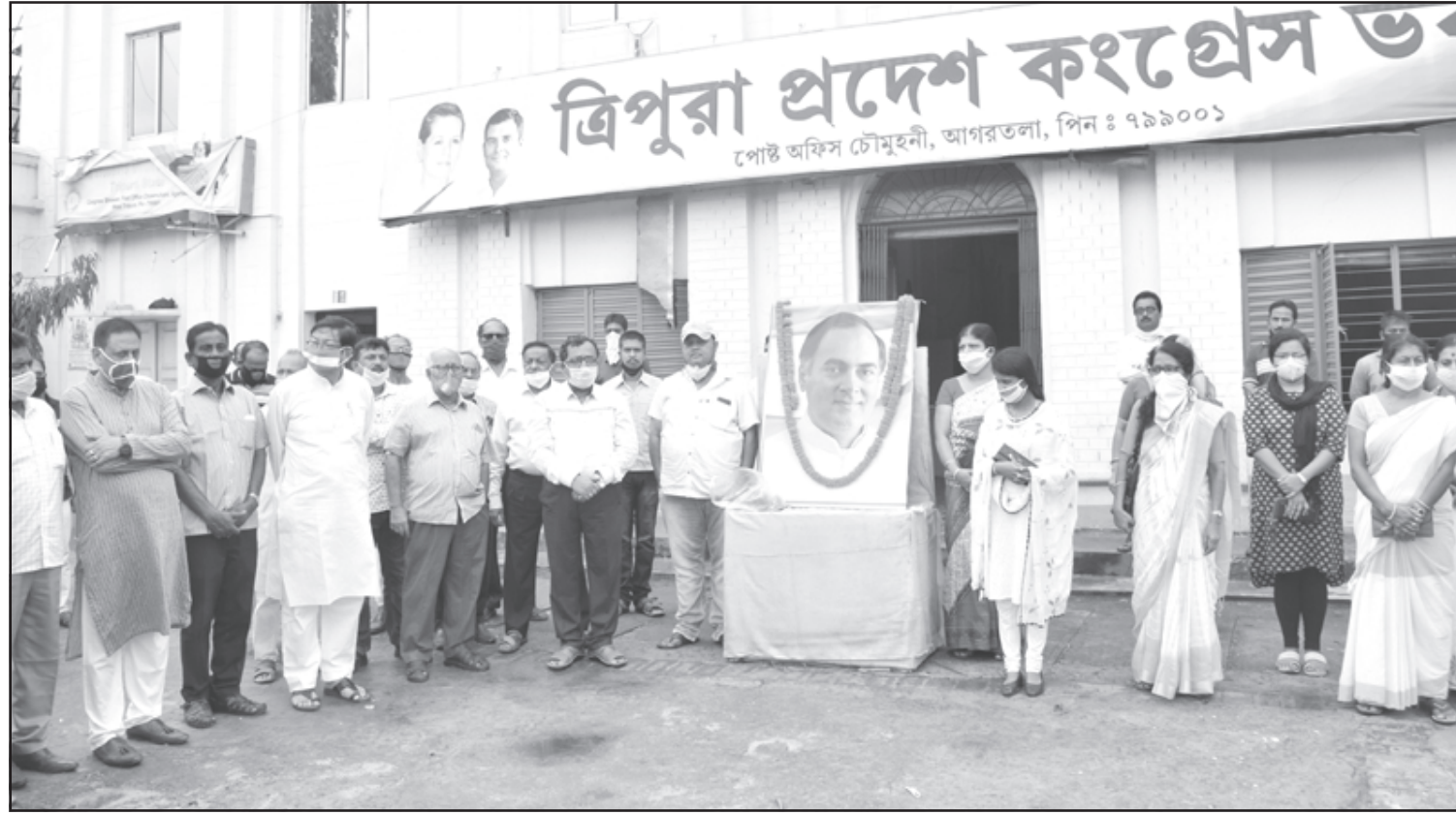
বৃহস্পতিবার গোটা দেশের সাথে রাজ্যেও যথাযোগ্য মর্যাদায় প্রাক্তন প্রধানমন্ত্রী রাজীব গান্ধীর মৃত্যু বার্ষিকী পালিত হয়।