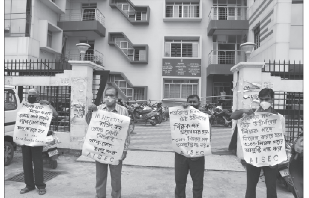
বৃহস্পতিবার আগরতলায় শিক্ষা দপ্তরের সামনে এআইএসইসি'র কর্মকর্তারা ডেপুটেশন প্রদান করেন।