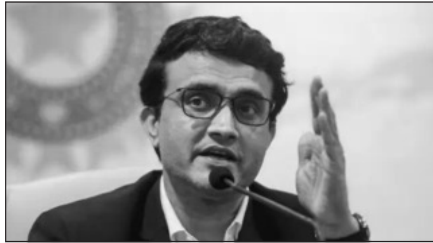
মনোহরের মেয়াদ দুই মাস বাড়তে পারে। স্মিথ এর মধ্যে প্রতিদ্বন্দ্বীতা জমিয়ে দিলেন। কারণ ইংল্যান্ড ও ওয়েলস ক্রিকেট বোর্ডের (ইসিবি) সাবেক প্রধান কলিন প্রেন্স সভাপতি হওয়ার দৌড়ে আছেন, জানায়

আইসিসি সভাপতি হিসেবে শশাঙ্ক মনোহরের মেয়াদ ফুরোচ্ছে এ মাসেই। এর পর আইসিসি সভাপতি হবেন কে? নিজের পছন্দ আগেই বলে দিলেন ক্রিকেট সাউথ আফ্রিকা (সিএসএ) পরিচালক ও সাবেক অধিনায়ক প্রায়ম স্মিথ (ভারতীয় ক্রিকেট বোর্ডের (বিসিসিআই) সভাপতি গাঙ্গুলীকে পরবর্তী আইসিসি সভাপতি হিসেবে দেখতে চান স্মিথ। সিএসএ প্রধান নির্বাহী জ্যাক ফাউলও সৌরভকে সমর্থন দিয়েছেন। ভারতীয় কেউ আইসিসির দায়িত্ব নিলে সমস্যা নেই, জানিয়েছেন তিনি। এদিকে করোনামহামারির মধ্যে