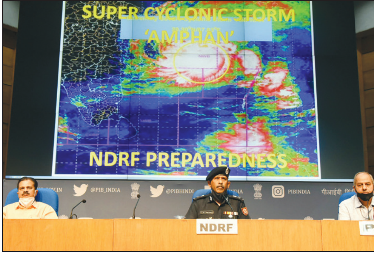
বৃহস্পতিবার নয়াদিল্লিতে ঘূর্ণিঝড় আমফান নিয়ে পর্যালোচনা বৈঠকের নেতৃত্ব দেন এনডিআরএফ এর ডিজি এস এন প্রধান সহ অন্যান্যরা।