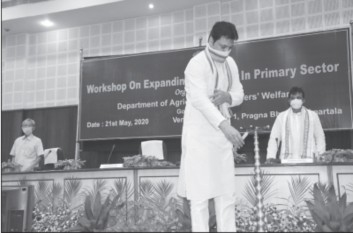
প্রাইমারি সেক্টরে ব্যবসা সম্প্রসারণ শীর্ষক একদিনের কর্মশালার উদ্বোধন করেন মুখ্যমন্ত্রী বিপ্রব কুমার দেব। বৃহস্পতিবার প্রজ্ঞা ভবন থেকে তোলা ছবি নিজস্ব।