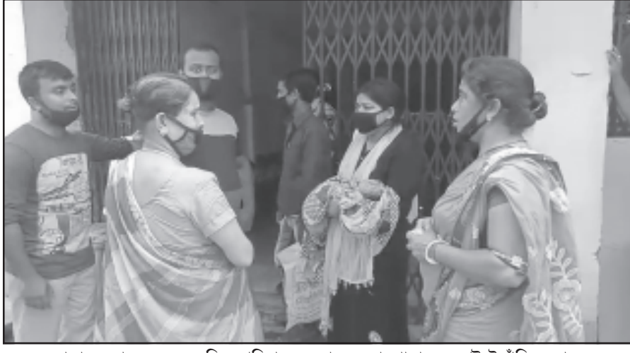
সদ্যজাত সন্তানের মৃতদেহ নিয়ে পরিবারের লোকজন হাসপাতালের গেইটে দাঁড়িয়ে আছেন।