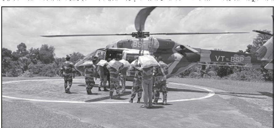
জানা যায়, মালদা কুমার পাড়া বিওপি সহ আরও একটি বিওপিতে যোগাযোগ ব্যবস্থার অপ্রতুলতার কারণে খাদ্য সামগ্রী নিয়ে যাওয়া বাহিনীর জওয়ানরা। শেষ পর্যন্ত হেলিকপ্টারের মাধ্যমে বিওপিতে খাদ্য সামগ্রী পৌঁছে দেওয়ার উদ্যোগ নেওয়া হয়। জানা গেছে, ৬ এর পাতায় দেখুন

নিজস্ব প্রতিনিধি, আগরতলা, ১৪ জুন।। গত কয়েকদিনের বর্ষে রাজ্যের পাহাড়ি এলাকা উজানঘাট চলাচলের অনুপযোগী হয়ে পড়েছে। তাতে সাধারণ মানুষ থেকে শুরু করে সীমান্ত নিরাপত্তার দায়িত্ব থাকার বিএসএফ জওয়ানরাও মারাত্মক সমস্যার সম্মুখীন হয়েছেন। রেশন সামগ্রী সহ নিত্য প্রয়োজনীয় সামগ্রী অপ্রতুল যোগাযোগ ব্যবস্থার কারণে প্রত্যন্ত এলাকায় পৌঁছে দেওয়া সম্ভব হচ্ছে না।