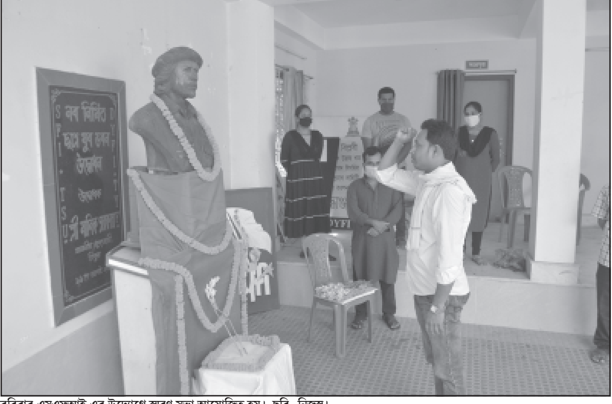
রবিবার এসএফআই এর উদ্যোগে স্বরণ সভা আয়োজিত হয়।

গুয়াহাটি, ১৪ জুন (হি.স.): অসমে ৩৯৪৩ জনে বৃদ্ধি পেয়েছে কোভিড-১৯ আক্রান্তের সংখ্যা। রবিবার বেলা ১২.৩৫ মিনিটে টুইট আপডেটে এই তথ্য দিয়েছেন স্বাস্থ্যমন্ত্রী হিমন্তবিশ্ব শর্মা। সেই সঙ্গে তিনি জানান, আজ এখন পর্যন্ত সুস্থ হয়েছে ১৮০৫ জন রোগী। সক্রিয় রয়েছে ২১২৭ জন। মৃত্যু হয়েছে আটজনের। আজ নতুন পজিটিভপ্রাপ্তরা যথাক্রমে ১৪ জন নগাঁও, ১০ জন গোলাঘাট, ২ জন বোরহাট, ২ জন বাকসা, ২ জন চিরাং এবং একজন করে কাবির আলং, ধেমাজি এবং বঙাইগাঁও জেলার বাসিন্দা। প্রসঙ্গত, গতকাল শনিবার (১৩ জুন) ২০৭ জনের শরীরে ধরা পড়েছিল মারণ করোনায় ভাইরাসের উপস্থিতি। শুক্রবার (১২ জুন) ২৬৩, বৃহস্পতিবার (১১ জুন) ১৪৫ জন, বুধবার ২৩৫ জন, মঙ্গলবার ২১৫ জনকে কোভিড-১৯ সংক্রমিত বলে শনাক্ত করা হয়েছিল। এদিকে গতকাল (১৩ জুন) একদিনে ২২১ জন এবং ১২ জুন ১০৫ এবং ১১ জুন ১৮৩ জন করোনায় আক্রান্তের পর পর দুবারের নমুনা পরীক্ষায় নেগেভিভ হাসপাতাল থেকে ছুটি দেওয়া হয়েছে।