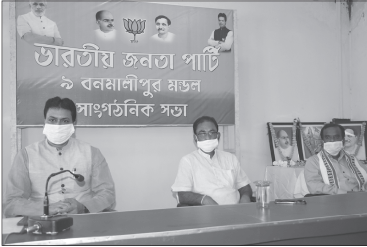
রবিবার ৯ বনমালীপুর মন্ডলের উদ্যোগে আয়োজিত সাংগঠনিক সভায় মুখ্যমন্ত্রী বিপ্লব কুমার দেব।