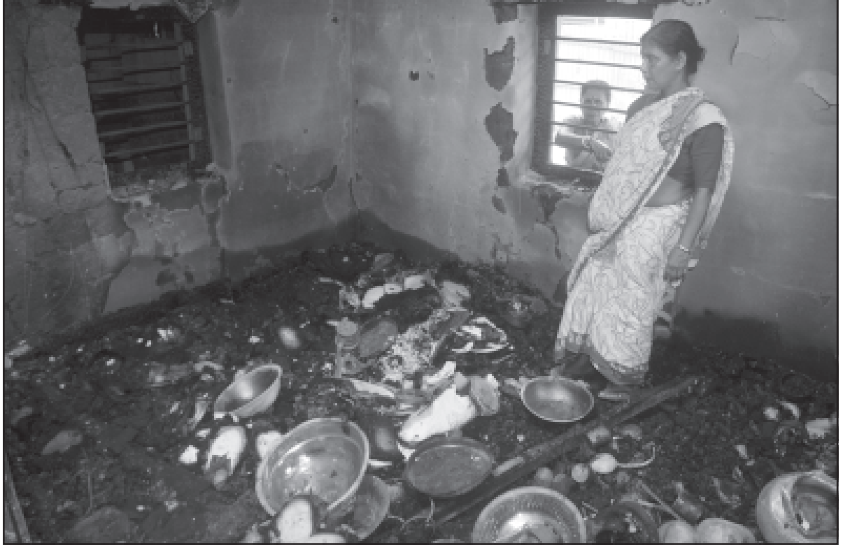
আমতলিতে শনিবার এক বাড়িতে অগ্নিকাণ্ড ঘটে।

উল্লেখ করা যেতে পারে, এর আগে এ দিন ভিডিও কনফারেন্সিংয়ের মাধ্যমে গরিব কল্যাণ রোজগার অভিযান আনুষ্ঠানিক উদ্বোধন করেন প্রধানমন্ত্রী। ১২৫ দিন ধরে চলবে এই অভিযান। মূলত পরিযায়ী শ্রমিকদের কথা ভেবে এই প্রকল্প নেওয়া হয়েছে।এতে উপরুক্ত হবে বিহার, উত্তর প্রদেশ, ওড়িশা, মধ্যপ্রদেশ, রাজস্থান এবং ঝাড়খন্ড।