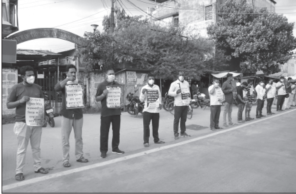
শনিবার ডিওয়াইএফআই এর উদ্যোগে আগরতলায় ডেপুটেশন প্রদান করা হয়।