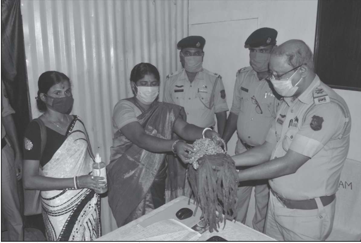
মঙ্গলবার একটি সামাজিক সংস্থার উদ্যোগে পুলিশ কর্তাদের মধ্যে মাঝ ও সেনিটাইজার বিতরণ করা হয়।