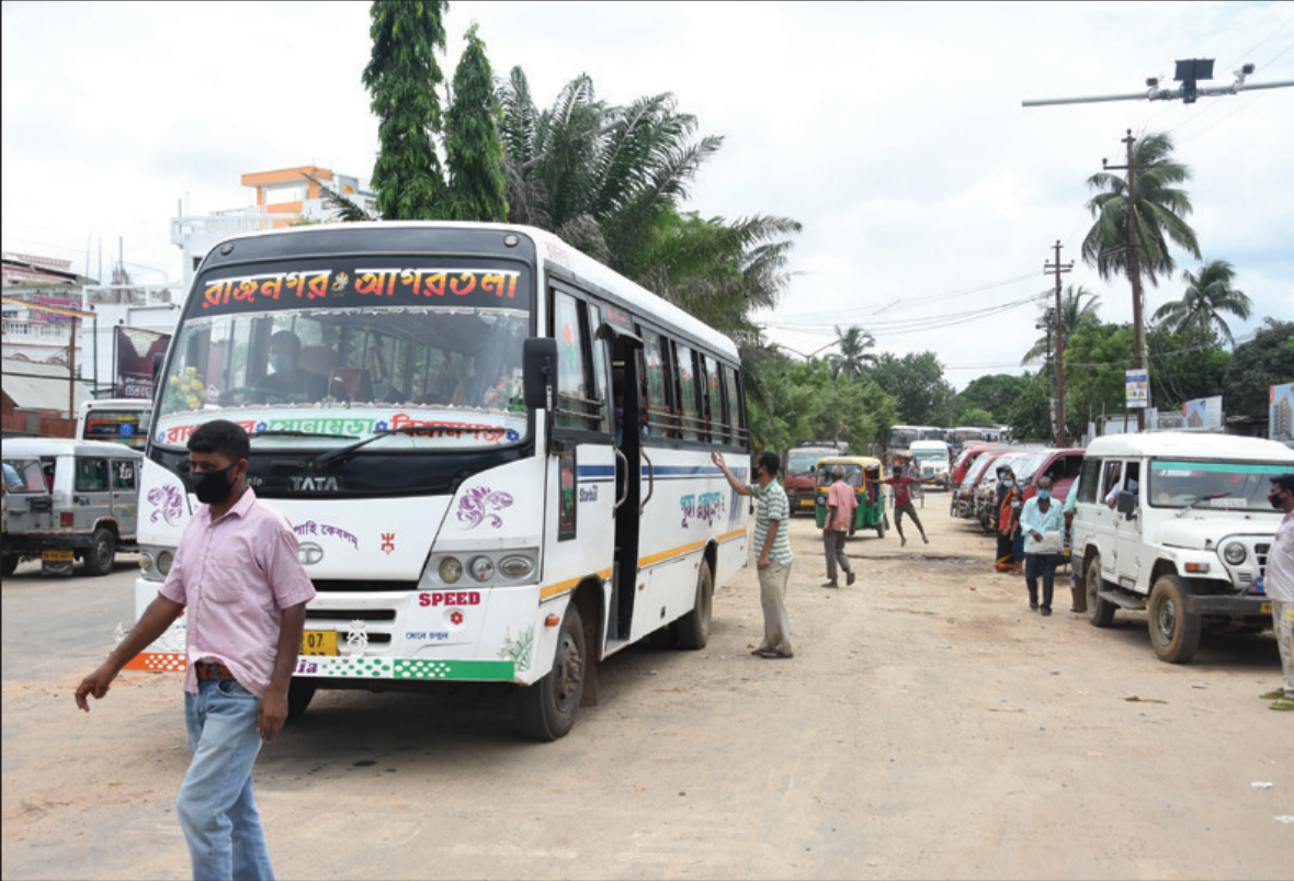
মঙ্গলবার আনলকের প্রথম দিনে শুরু হয়েছে বাস সার্ভিস।

নয়াদিল্লি, ৪ আগস্ট (হি.স.): কেন্দ্রীয় কৃষি এবং কৃষি কল্যাণ মন্ত্রী নরেন্দ্র সিং তোমার মঙ্গলবার রাষ্ট্রীয় সহকারী বিকাশ নিয়ম (এনসিডিসি) সহকার কাপ টিউব চ্যানেলের আনুষ্ঠানিক উদ্বোধন করেন। এনসিডিসি তরফ থেকে জানানো হয়েছে ইন্টারনেটে ওয়ানস্টপ চ্যানেল হিসেবে চালানো কাজ করা শুরু করে দিয়েছে। এই চ্যানেলে হিন্দি সহ আঞ্চলিক ভাষায় অনুষ্ঠান সম্প্রচারিত হবে। দেশের ১৮ রাজ্যের অনুষ্ঠান সম্প্রচারিত করা হবে। সমবায় সোসাইটি গঠন এবং পঞ্জিকরণ এর একটি ডিভিও প্রকাশ করেন কেন্দ্রীয় কৃষিমন্ত্রী।