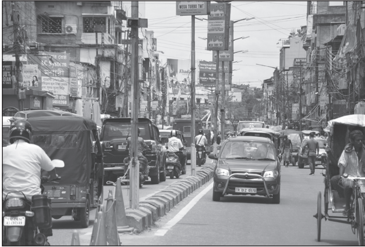
মঙ্গলবার আনলকের প্রথম দিনেই শহরতলীতে উপচে পড়া ভিড়।