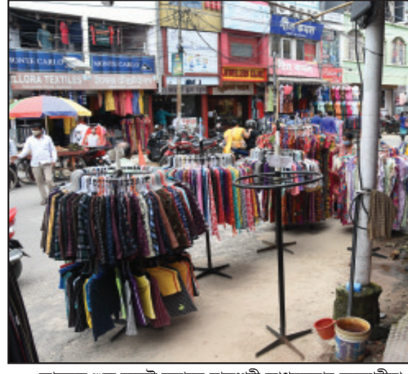
আনলক শুরু হতেই সকালে রাজধানী আগরতলায় ব্যবসায়ীরা দোকানপাট খুলে পসরা সাজিয়ে বসেছিলেন। পরে প্রশাসনের তরফ থেকে প্রচারণা করা হয় সব ধরনের দোকান খোলা হয়। তারপর বন্ধ করে দেয়া হয় দোকানপাট।