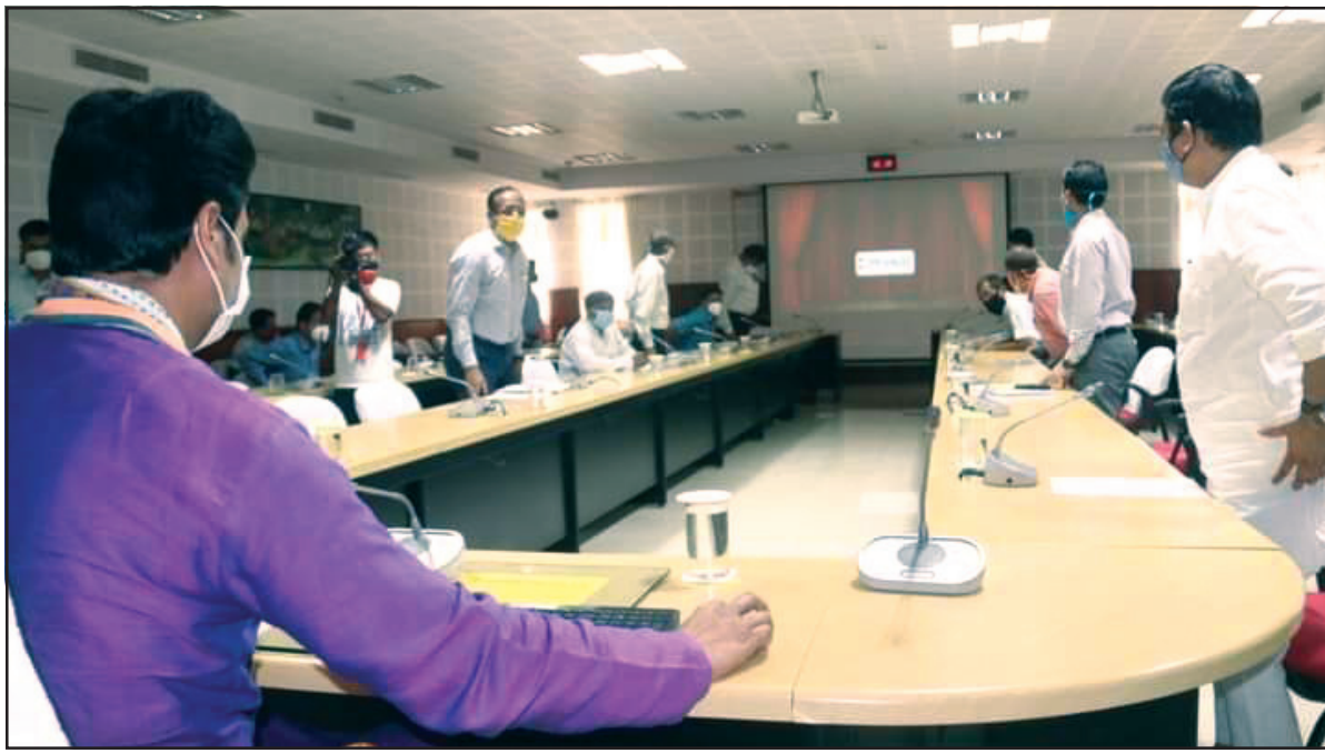
সোয়াগত ওয়েব পোর্টালের উদ্বোধন করেন মুখ্যমন্ত্রী বিপ্লব কুমার দেব।