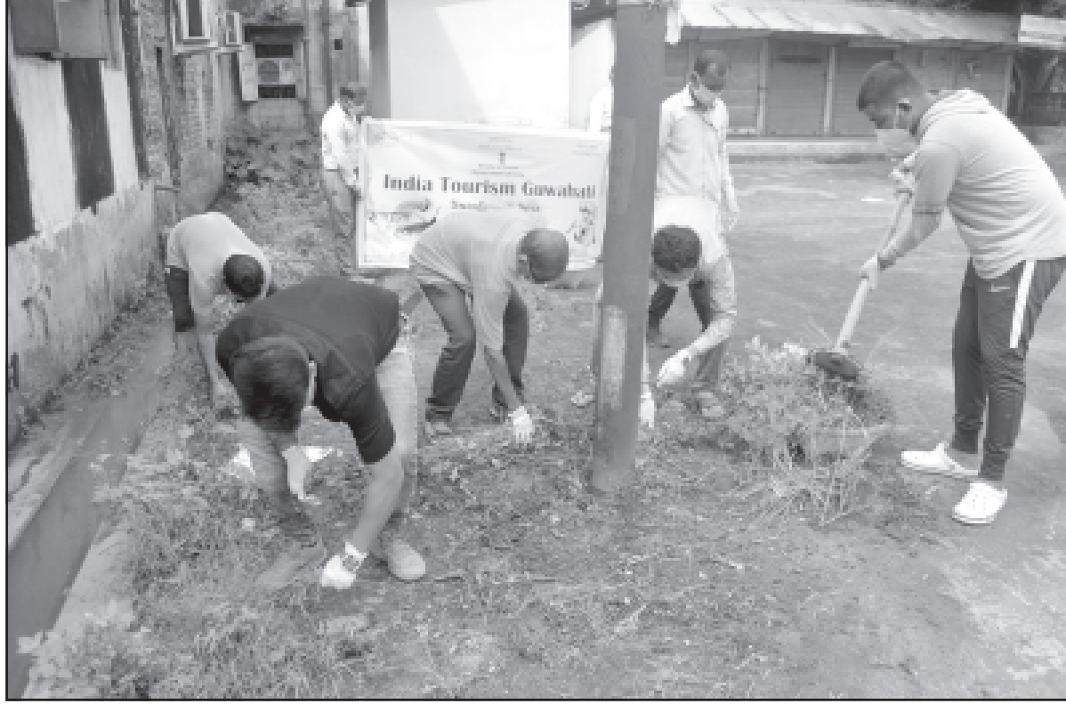
মঙ্গলবার আগরতলায় স্বচ্ছ ভারত অভিযান আয়োজিত হয়।