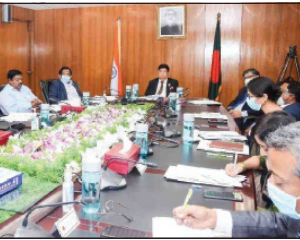
মোমেন আর ভারতীয় প্রতিনিধিদলের নেতৃত্ব দেন দেশটির পররাষ্ট্রমন্ত্রী এস জয়শঙ্কর। বাংলাদেশ-ভারত জেসিসির পঞ্চম সাতটি ২০১৯ সালের ৮ ফেব্রুয়ারি যোগাযোগ, বাণিজ্য ও জ্বালানী সহযোগিতার বিষয়ে বিশেষ দৃষ্টি রেখে বাংলাদেশ-ভারত পররাষ্ট্রমন্ত্রী পর্যায়ের ৬ষ্ঠ যৌথ পরামর্শক কমিশনের (জেসিসি) প্রতিনিধিদলের নেতৃত্ব দেন পররাষ্ট্রমন্ত্রী ডি আবদুল মোমেন আর ভারতীয় প্রতিনিধিদলের নেতৃত্ব দেন দেশটির পররাষ্ট্রমন্ত্রী এস জয়শঙ্কর। সভায় দুদেশের

করেছে। ভারুয়াল এ বৈঠকে বাংলাদেশ প্রতিনিধিদলের নেতৃত্ব দেন পররাষ্ট্রমন্ত্রী ডি আবদুল মোমেন।