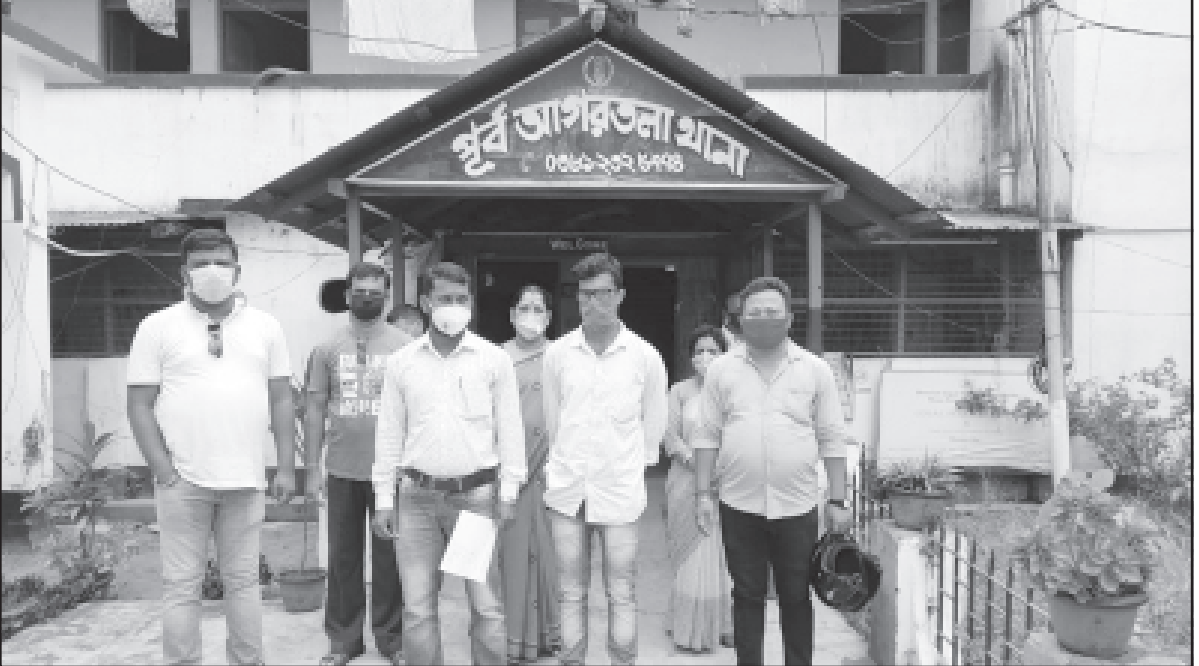
মঙ্গলবার এসএফআই কর্মীরা পূর্ব আগরতলায় ডেপুটেশন প্রদান করেন।