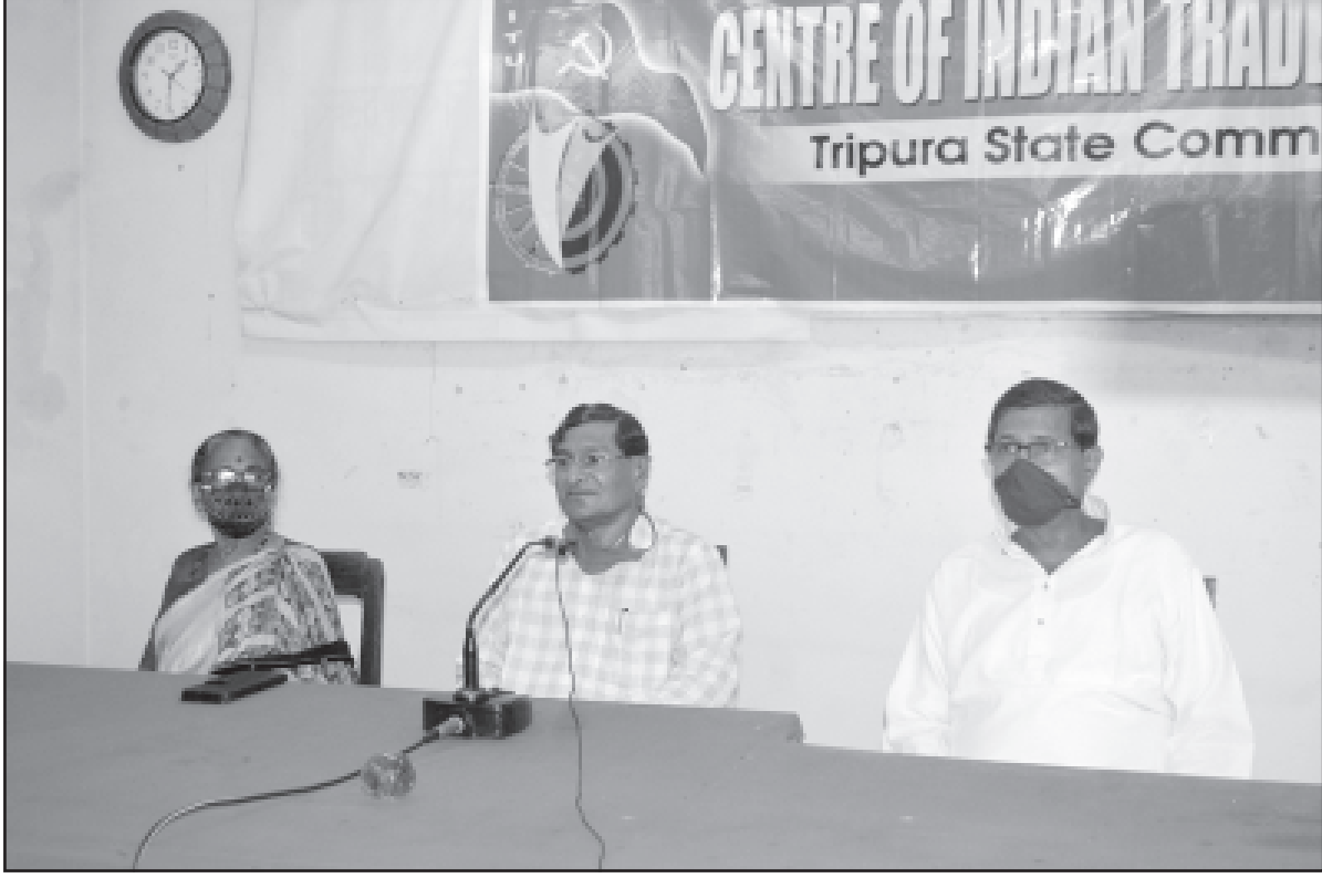
মঙ্গলবার আগরতলায় সিআইটিইউ এক সাংবাদিক সম্মেলনে মিলিত হন।