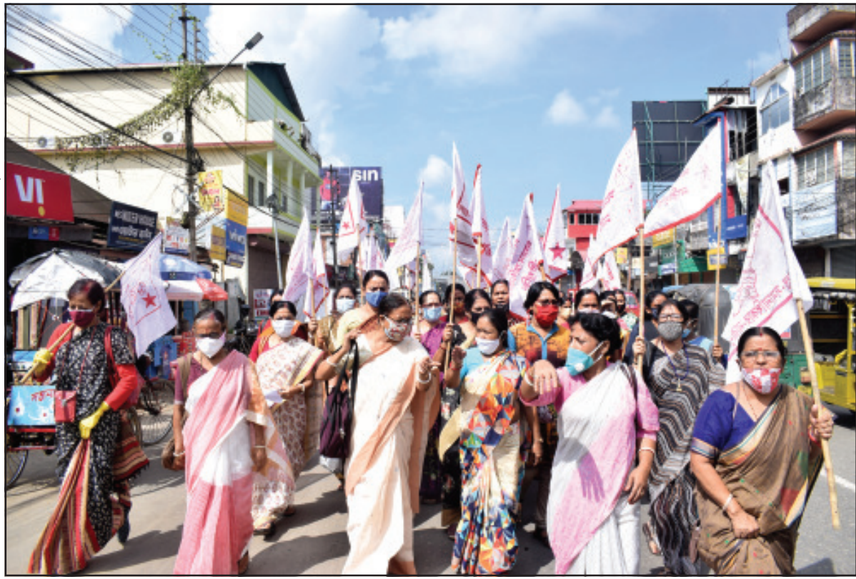
নারী সংক্রান্ত অপরাধের প্রতিবাদে গণতান্ত্রিক নারী সমিতির বিক্ষোভ মিছিল আগরতলায়।