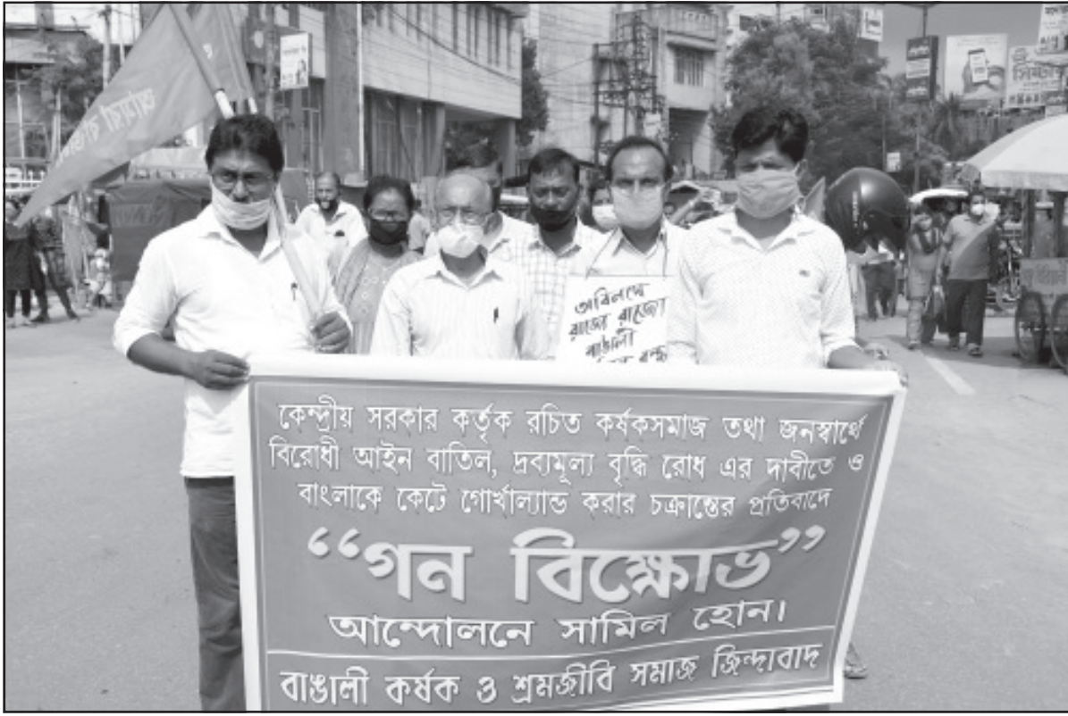
বিভিন্ন দাবিতে শনিবার আগরতলায় আমরা বাঙালির বিক্ষোভ আন্দোলন।