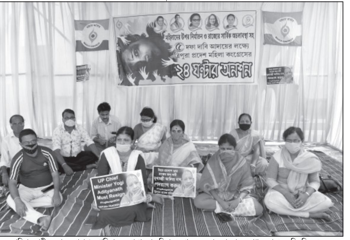
শনিবার নারী সংক্রান্ত অপরাধের প্রতিবাদে স্বরূপ প্রদেশ মহিলা কংগ্রেসের অনশন আন্দোলন আগরতলায়।