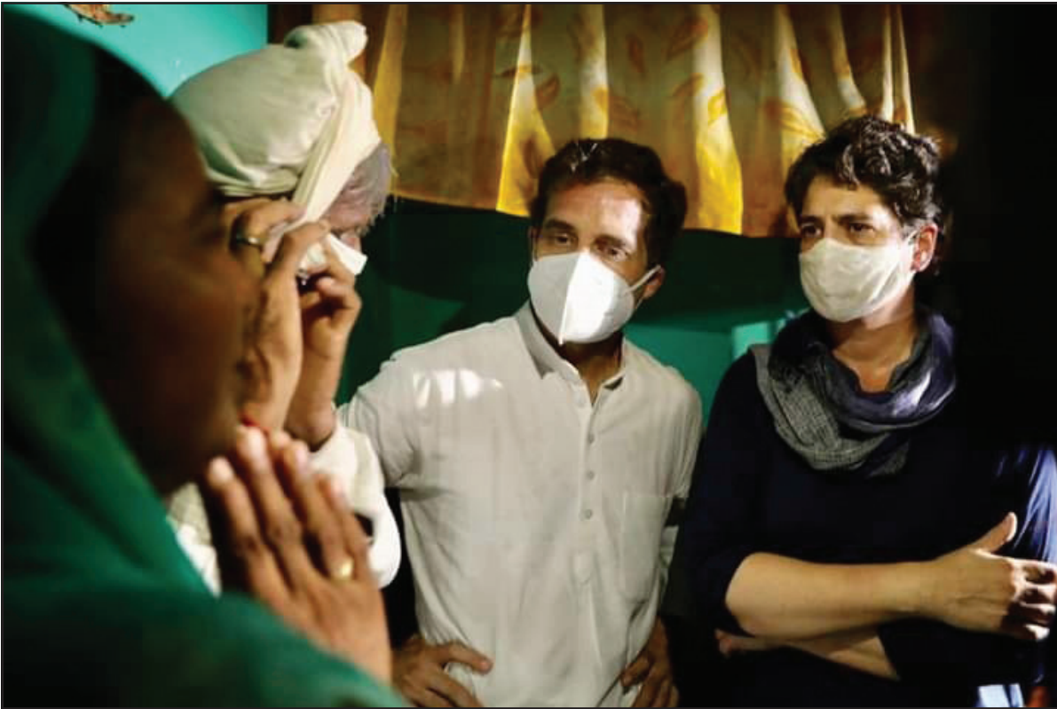
শেষ পর্যন্ত শনিবার হাথরাসে গণধর্ষণ মৃত কিশোরীর বাড়িতে গিয়ে পরিবারের সদস্যদের সাথে কথা বললেন রাহুল ও প্রিয়াঙ্কা।