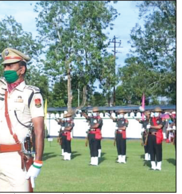
রাষ্ট্রীয় একতা দিবসে আগরতলায় পুলিশ মাঠে অনুষ্ঠানে শপথ বাঁধা পাঠ করেন পুলিশ কর্মীরা।

অনুষ্ঠানে প্রধান অতিথি মুখ্যমন্ত্রী বিপ্লব কুমার দেব আরও বলেন, ২০১৪ সালে প্রধানমন্ত্রী নরেন্দ্র মোদী ৬ এর পাতায় দেখুন