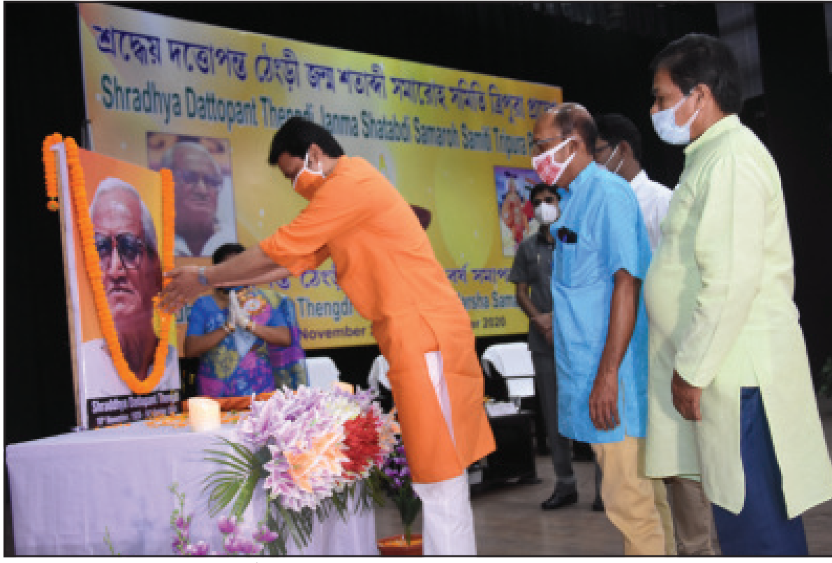
মঙ্গলবার রাষ্ট্রস্বামী দত্তপন্ড ঠেংড়িজির জন্মজয়ন্তীতে মুখ্যমন্ত্রী বিপ্রব কুমার দেব শ্রদ্ধা নিবেদন করেন।