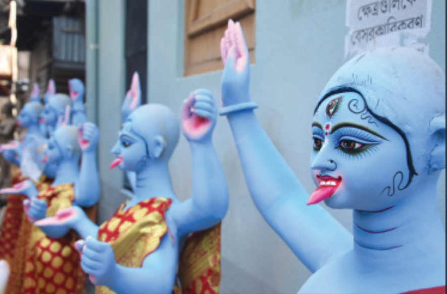
দোরগোড়ায় শ্যামা পূজা। প্রতিমা তৈরীতে চলছে জোর তৎপরতা। বৃহস্পতিবার তোলা নিজস্ব ছবি।

আগরতলা, ১২ নভেম্বর (হি.স.)। বিহার নির্বাচনে নিরাপত্তার দায়িত্ব পালন করে ত্রিপুরায় ফিরে আসার পর ১২ জন টিএসআর জওয়ানের দেহে করোনা-র সংক্রমণ মিলেছে। তাঁদেরকে আইসোলেশনে রাখা হয়েছে। এমনিতে তারা সুস্থ। ত্রিপুরা পুলিশের মুখ্য কার্যালয়ের জৈন উচ্চ পদস্থ আধিকারিক জানিয়েছেন, বিহার বিধানসভা নির্বাচনে নিরাপত্তার দায়িত্ব পেয়ে সাত শতাধিক জন টিএসআর জওয়ান গিয়েছিলেন। তারা গত মঙ্গলবার ত্রিপুরায় ফিরে এসেছেন। তাঁদের নিজ নিজ ব্যাটালিয়নের একাডমি স্থানে রাখা হয়েছে। ওই আধিকারিকের দাবি, বিহার থেকে ফিরে আসার পর করোনা-র সংক্রমণ ছড়ানো আটকানোর প্রসঙ্গে সকল জওয়ানের নমুনা পরীক্ষা হয়েছে। তাঁদের মধ্যে ১২ জনের দেহে করোনা-র সংক্রমণ মিলেছে।