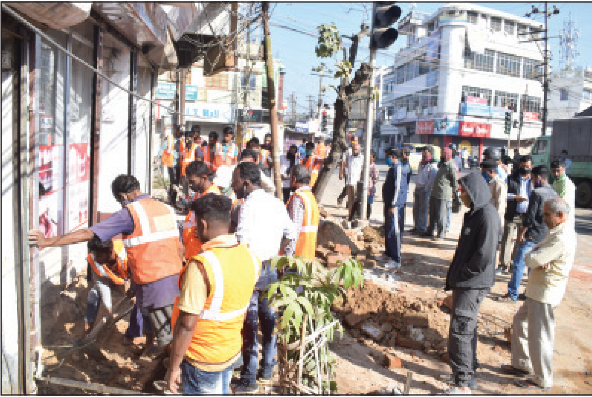
বুধবার আগরতলায় অবৈধ দখলমুক্ত করেন আগরতলা মিউনিসিপাল কর্পোরেশনে কর্মীরা।