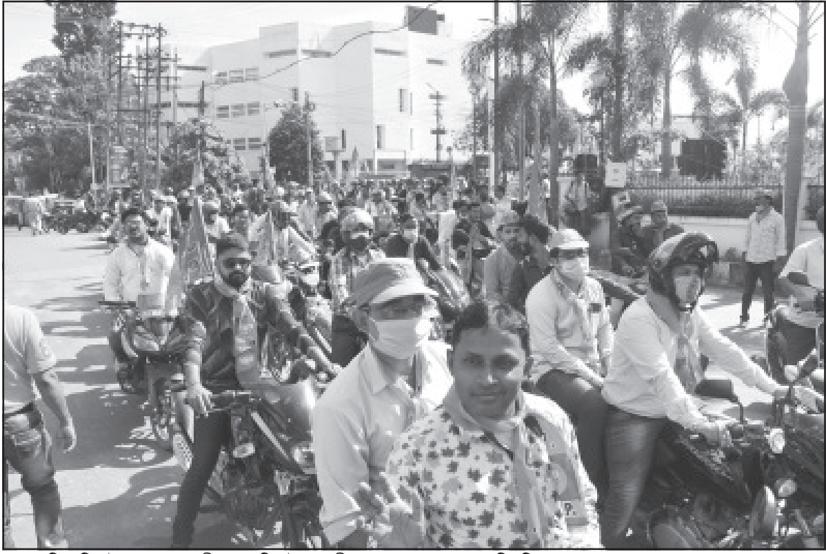
বৃধবার বিজেপির উদ্যোগে রাজধানীতে একটি বাইক র্যালীর আয়োজন করা হয়।