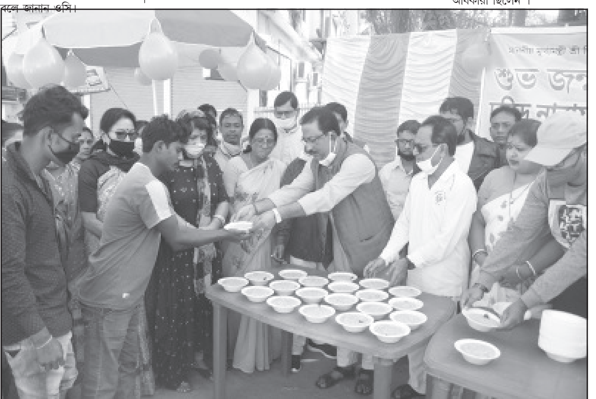
বৃহবার বিজেপির উদ্যোগে দুহদের মধ্যে ষিচুরি বিতরণ করা হয়।

কলকাতা, ২৫ নভেম্বর (হি.স.): করোনা-মুক্ত হয়ে বাড়ি ফিরলেন রাজ্যের পর্যটন মন্ত্রী গৌতম দেব। বৃহবার নার্সিং হোম থেকে বাঁকে করে যালি করে তাঁকে বাড়িতে পৌঁছে দেওয়া হয়। চলতি মাসের গোড়ার দিকে অসুস্থ বোধ করায় তাঁর করোনা নমুনা পরীক্ষা করা হয়। সেই রিপোর্ট পজিটিভ আসতেই একটি বেসরকারি নার্সিংহোমে ভর্তি করা হয় রাজ্যের পর্যটন মন্ত্রীকে। সেখানে চিকিৎসা চলে তার। এরপর গতকাল ফের একবার তার নমুনা পরীক্ষা করা হয়। সেই রিপোর্ট নেগেটিভ আসার পর বৃহবার তাকে নার্সিংহোম থেকে ছুটি দেওয়া হয়েছে।