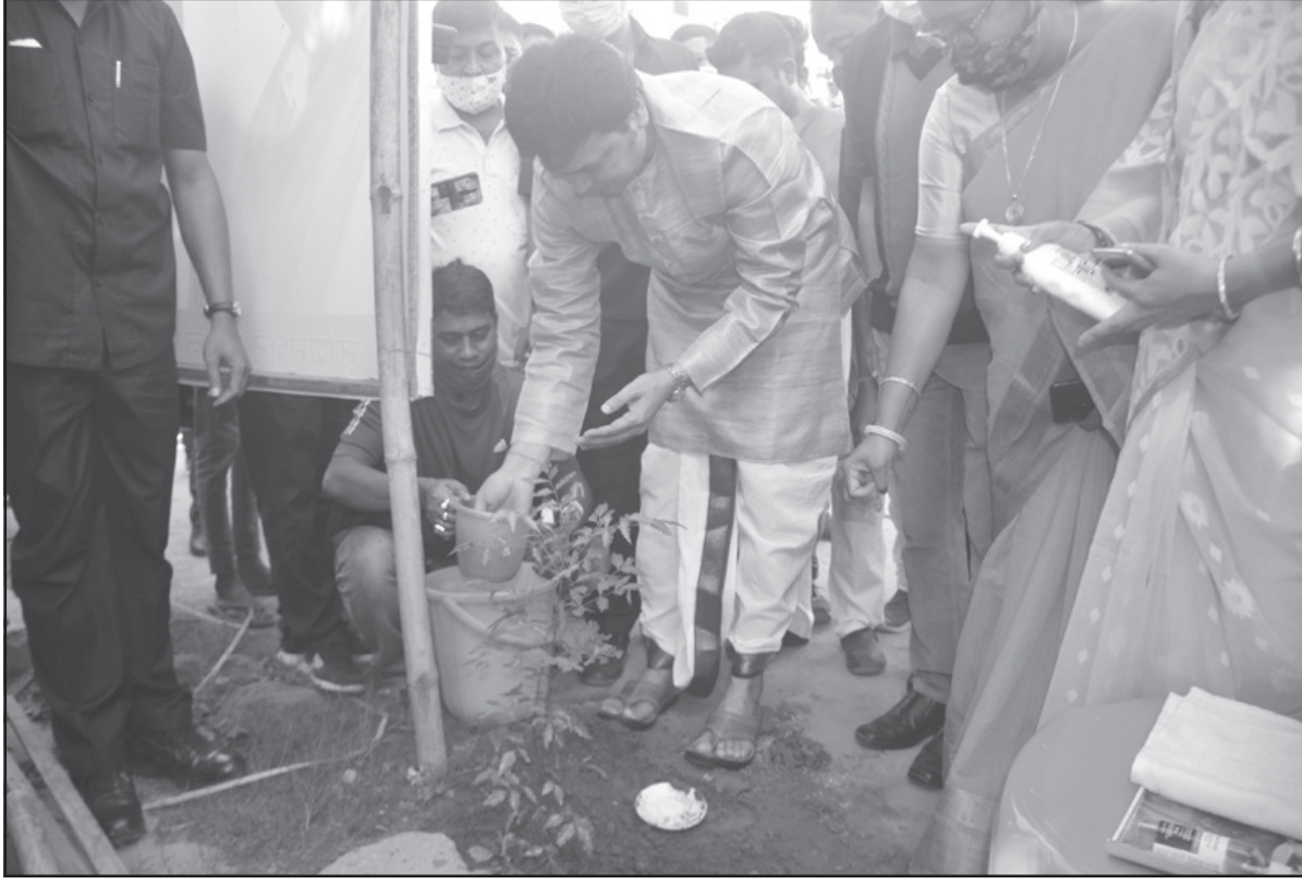
বৃহবার আগরতলায় বৃক্ষরোপন অনুষ্ঠানে মুখ্যমন্ত্রী।