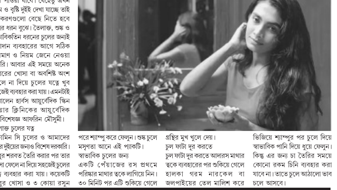
পরে শ্যাম্পু করে ফেলুন। শুষ্ক চুলে মসুগতা আনে এই প্যাকটি। স্বাভাবিক চুলের জন্য একটি পের্যাডের রস প্রথমে পরিষ্কার মাথার ত্বকে লাগিয়ে নিন। ৩০ মিনিট পর এটি শুকিয়ে গেলে