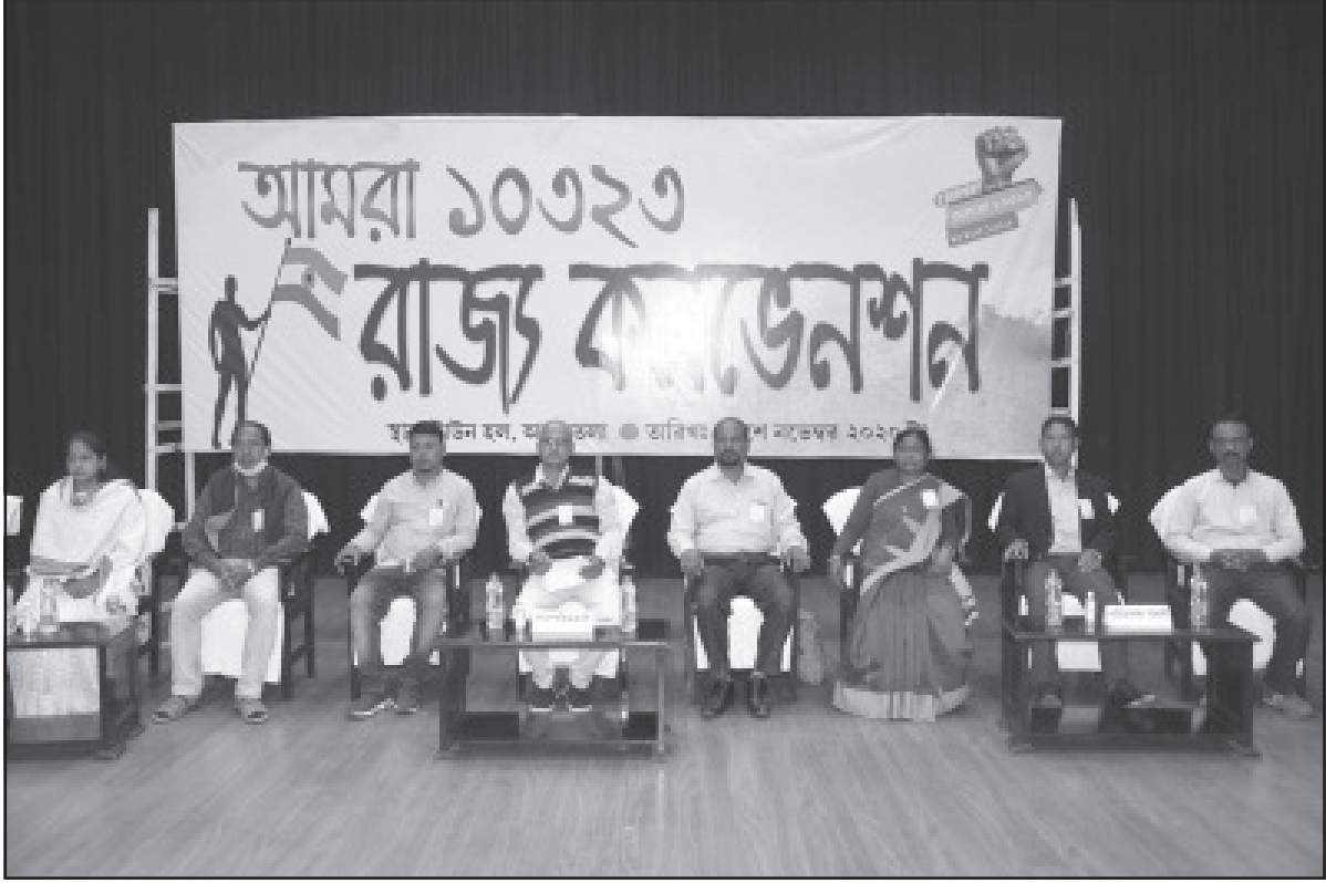
সোমবার আগরতলায় আমরা ১০৩২৩ চাকুরীচ্যুত কর্মীরা এক আলোচনা চক্রে অংশ গ্রহণ করেন।