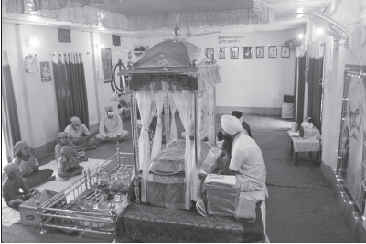
সোমবার আগরতলায় গুরুনানকরে জন্মজয়ন্তি পালিত হয়।