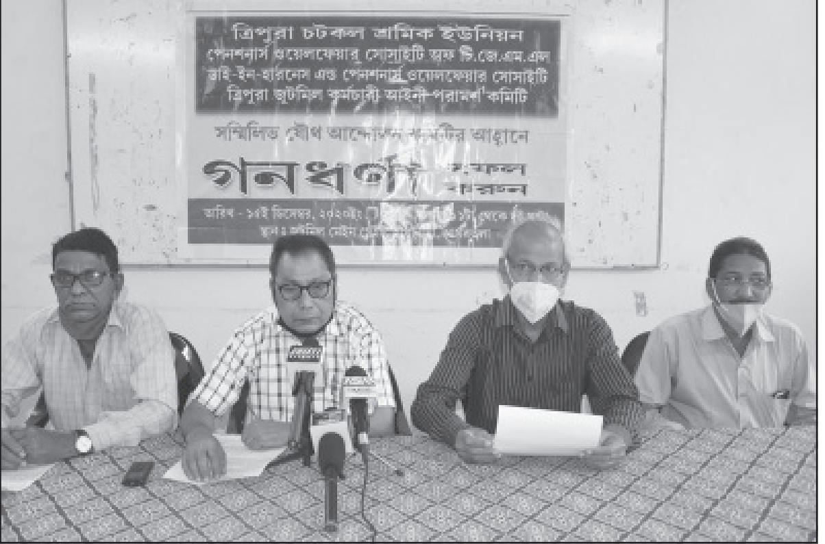
সোমবার ত্রিপুরা চটকল কর্মীদের গণধর্না পালিত হয়।

শিলিগুড়ি, ৩০ নভেম্বর (হি. স.): শিলিগুড়ির ২১ নং ওয়ার্ডের রবীন্দ্রনগর এলাকায় অজ্ঞাত পরিচয়ের এক ব্যক্তির মৃতদেহ উদ্ধারকে ঘিরে চাঞ্চল্য ছড়াল এলাকায়। ঘটনাটি ঘটেছে সোমবার দুপুরে। মৃত ওই ব্যক্তির পরিচয় আপাতত পাওয়া যায়নি স্থানীয় সূত্রে খবর, মৃত ওই ব্যক্তির মাথায় আঘাতের চিহ্ন রয়েছে। স্থানীয়দের এক অনুমান, ওই ব্যক্তির মাথায় ধারালো অস্ত্র দিয়ে কেউ আঘাত করা হয়েছে। ইতিমধ্যে এলাকায় শিলিগুড়ি থানার পুলিশ এসে উপস্থিত হয়েছে। পুলিশ সূত্রে খবর, বেশ কিছুক্ষণ ধরে মৃত ওই ব্যক্তির পরিচয় আপাতত পাওয়া যায়নি। ঘটনাস্থলে, একটি সাইকেল ও একটি ব্যাগ পড়েছিল।