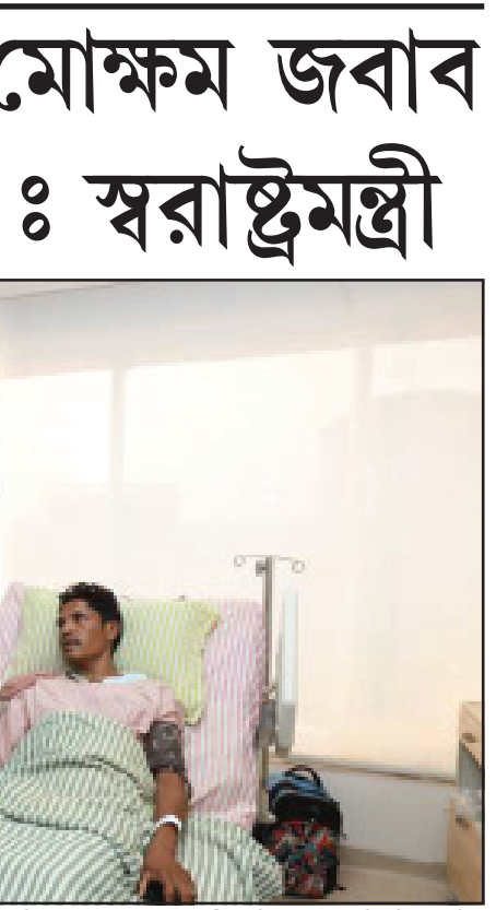
ছত্ৰিশগড়ে মাও হামলায় আহত জওয়ানদের হাসপাতালে গিয়ে দেখেন স্বরাষ্ট্রমন্ত্রী অমিত শাহ।

আগরতলা, ৫ এপ্রিল (হি.স.)। ত্রিপুরার আরও এক বীর জওয়ান শহিদ হয়েছেন। দেশ সেবায়