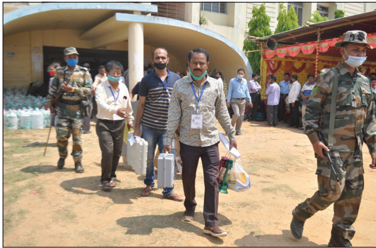
মঙ্গলবার এডিসি নির্বাচনের ভোট গ্রহণ। সোমবার দুপুরে ভোটকর্মীরা বুথের উদ্দেশ্যে যাত্রা করেন কঠোরা নিরাপত্তায়।