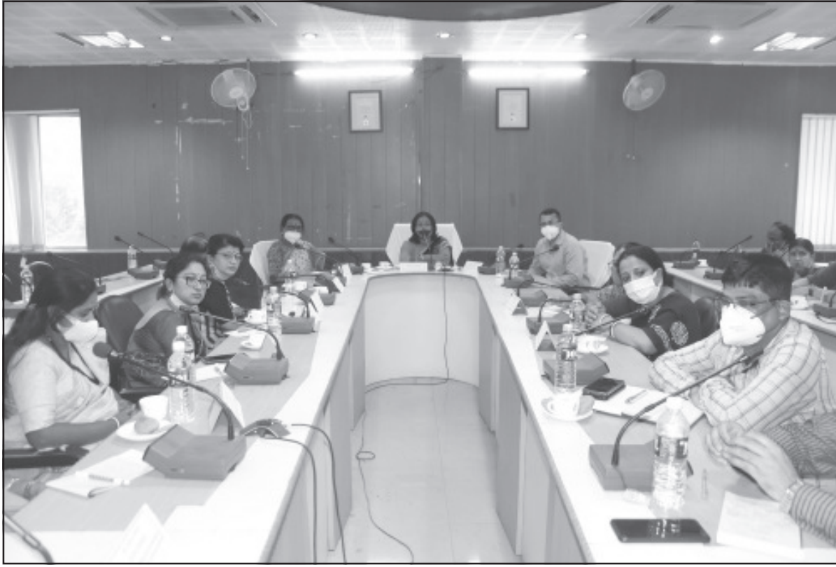
শিশুদের শিক্ষাবৃত্তি নিয়ে বৃহস্পতিবার জেলা শাসকের অফিসে রাজা কমিশনের আলোচনা সভা অনুষ্ঠিত হয়েছে।