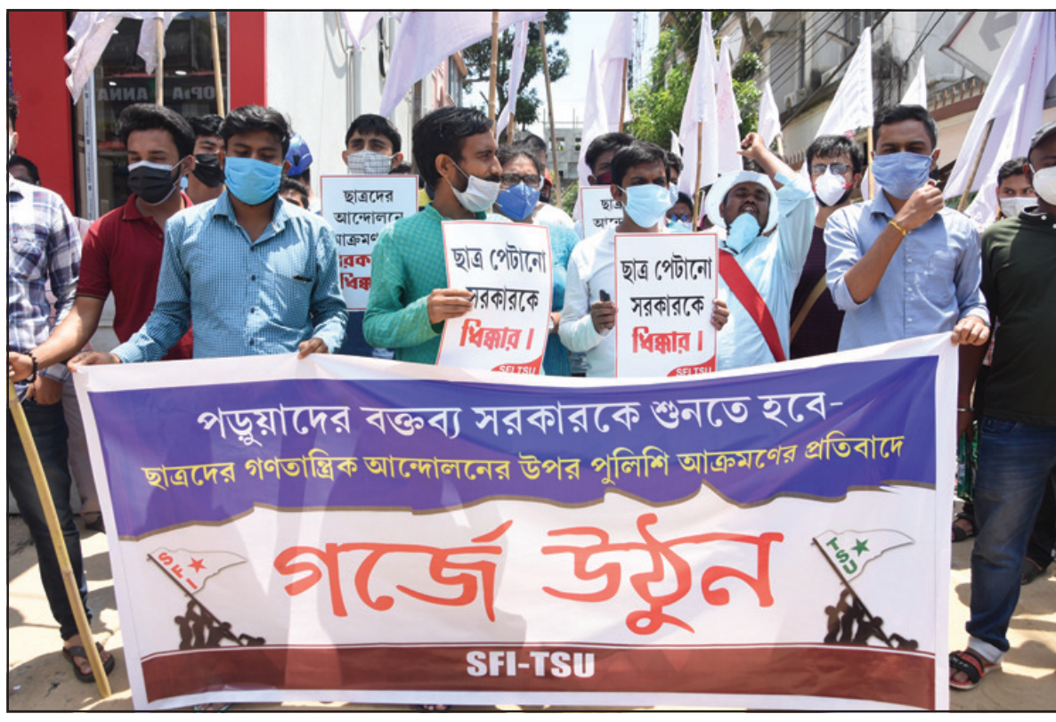
ছাত্রছাত্রীদের উপর পুলিশের আক্রমণের প্রতিবাদে মিছিল এসএফআইয়ের। বৃহস্পতিবার আগরতলায় তোলা নিজস্ব ছবি।

ব্যাহত হচ্ছে প্রত্যন্ত এলাকা গুলোতে। এমনই এক বাস্তব চিত্র ক্যামেরা বন্দি হল কীকড়া ছড়া এডিসি ভিলেজের অলরামপাড়া এলাকায়। অলরামপাড়ার রিয়াং জনজাতি বা বর্তমানেও অধুনা উন্নয়ন থেকে বঞ্চিত। অভিযোগ বর্তমানেও