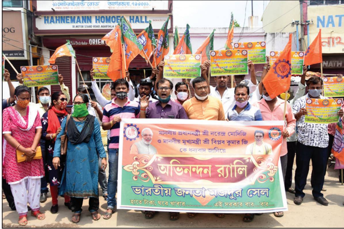
হাতে টাকা, ঘরে খাবার... এই সরকার বার... বলে প্রধানমন্ত্রীকে ধন্যবাদ জানিয়ে অভিনন্দন র্যালি ভারতীয় জনতা মজদুর সেলের।