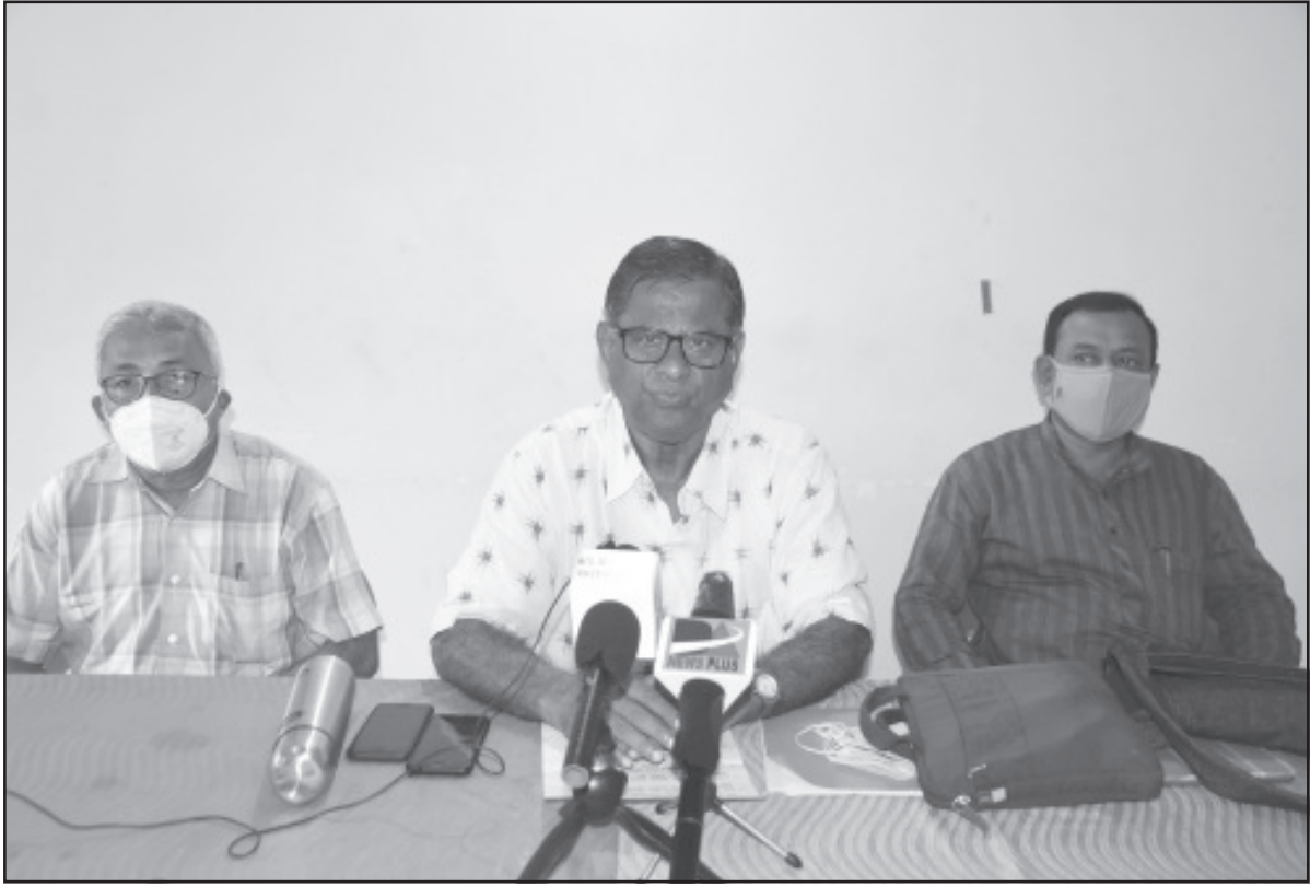
মঙ্গলবার সাংবাদিক সম্মেলনে বক্তব্য রাখেন সিট্রা, ক্ষেত্র মজুর, কৃষক সভা নেতৃবৃন্দ।