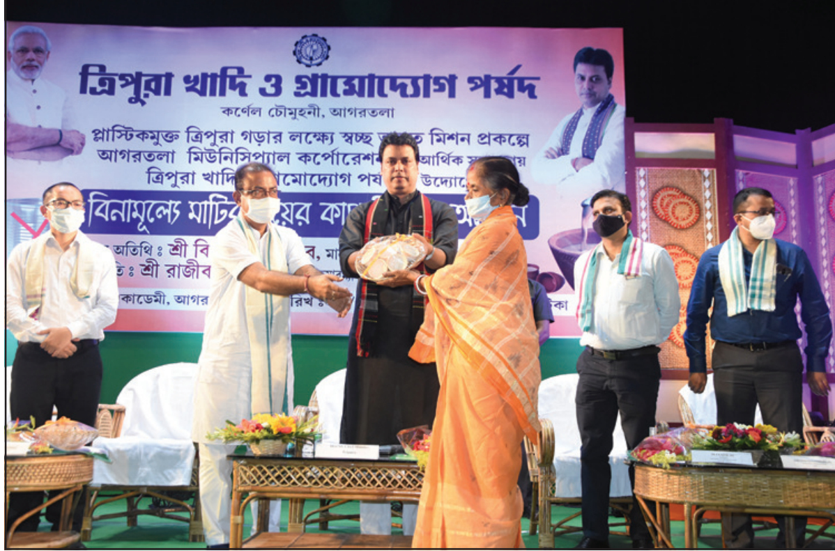
মঙ্গলবার চা বিক্রেতাদের বিনামূল্যে মাটির চায়ের কাপ বিতরণ করেন মুখ্যমন্ত্রী বিপ্লব কুমার দেব।

নিজস্ব প্রতিনিধি, চুড়াইবাড়ি, ১০ আগস্ট। দেশব্যাপী জাতীয় নাগরিক পঞ্জিকরণ (এনআরসি)-এর প্রস্তুতি নিয়ে এখনও পর্যন্ত কোনও সিদ্ধান্ত নেয়নি কেন্দ্রীয় সরকার। মঙ্গলবার সংসদে জানিয়ে দিলেন কেন্দ্রীয় স্বরাষ্ট্রমন্ত্রকের প্রতিমন্ত্রী নিত্যানন্দ রাই। যদিও তিনি জানিয়েছেন, ২০২১ সালে জরিপের প্রথম দফার সঙ্গেই, নাগরিকত্ব আইনের (১৯৫৫) অধীনে জাতীয় নাগরিক পঞ্জিকরণ আপডেইট করার সিদ্ধান্ত নিয়েছে সরকার।