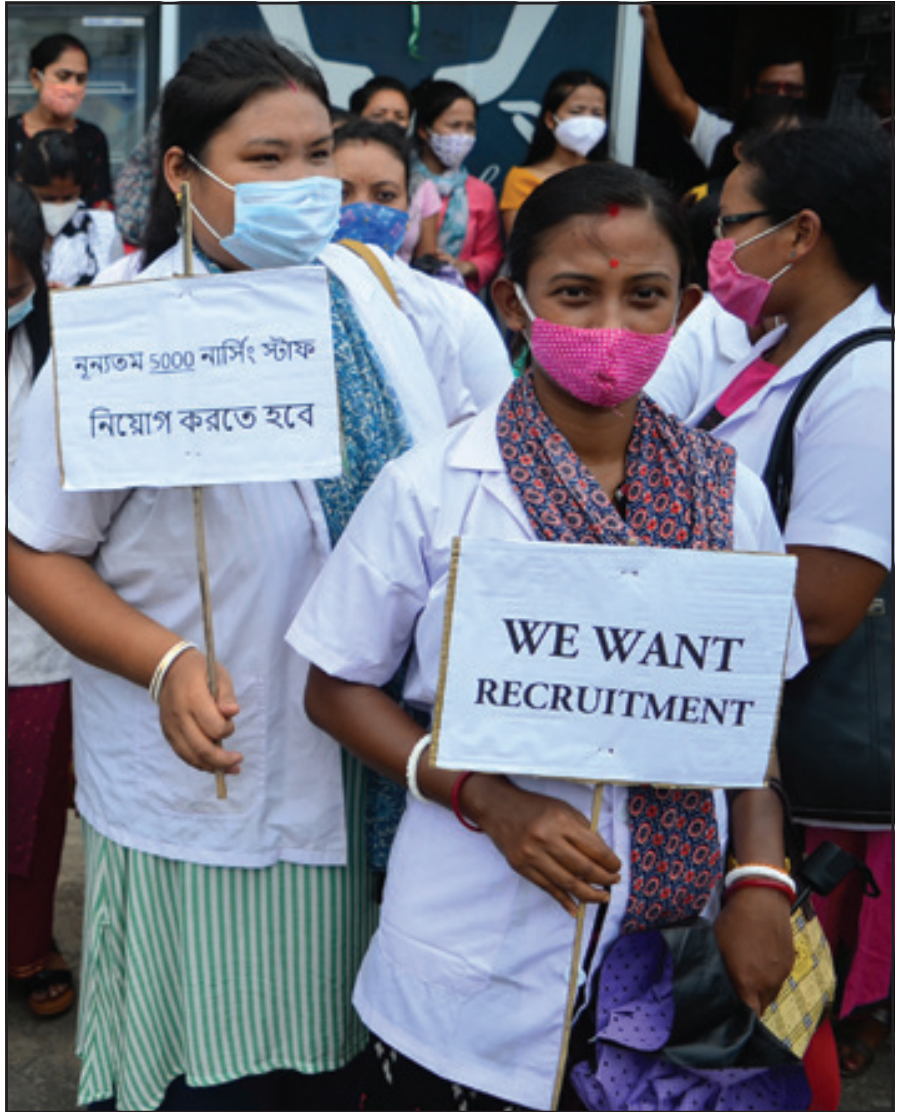
বুধবার আগরতলায় চাকরীর দাবিতে আন্দোলনে शामिल হলেন বেকার নার্সরা।

নিজস্ব প্রতিনিধি, আগরতলা, ১১ আগস্ট। ক্ষুদিরাম বসুর প্রয়াণ দিবসে শহীদ ক্ষুদিরাম বসু স্মৃতি রক্ষা কমিটির পক্ষ থেকে