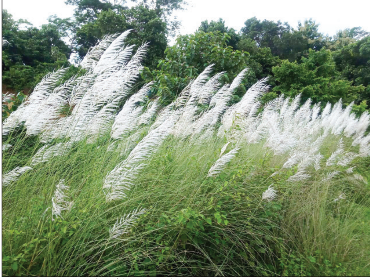
আগমনীর বার্তা দিল কাশফুল। তেলিয়ামুড়া থেকে গয়াচন্দ্র সূত্রধরের তোলা ছবি।