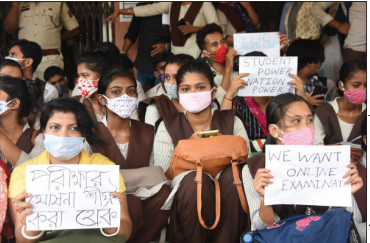
অনলাইন পরীক্ষার দাবীতে আগরতলায় শিক্ষা ভবনে আন্দোলন সংগঠিত করেছে।

তিনি জানান, ওই ঘটনায় তাঁর প্রতিবেশী দুই যুবককে গতকাল রাতেই গ্রেফতার করেছে পুলিশ। অপর অভিযুক্ত বর্তমানে পলাতক রয়েছে।