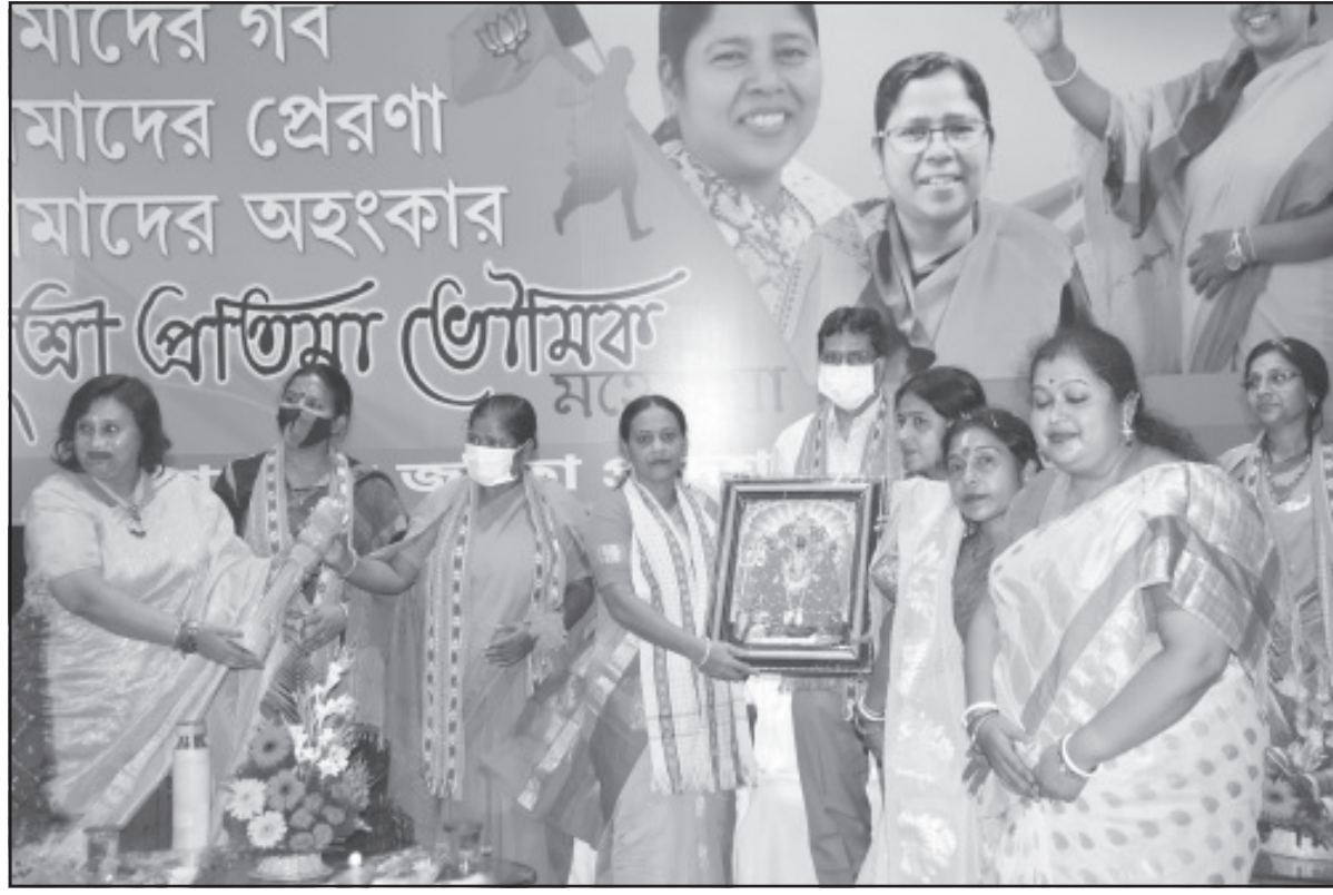
কেন্দ্রীয় প্রতিমন্ত্রী প্রতিমা ভৌমিককে সংবর্ধনা দেওয়া হয় বিজেপি মহিলা মোচার পক্ষ থেকে।