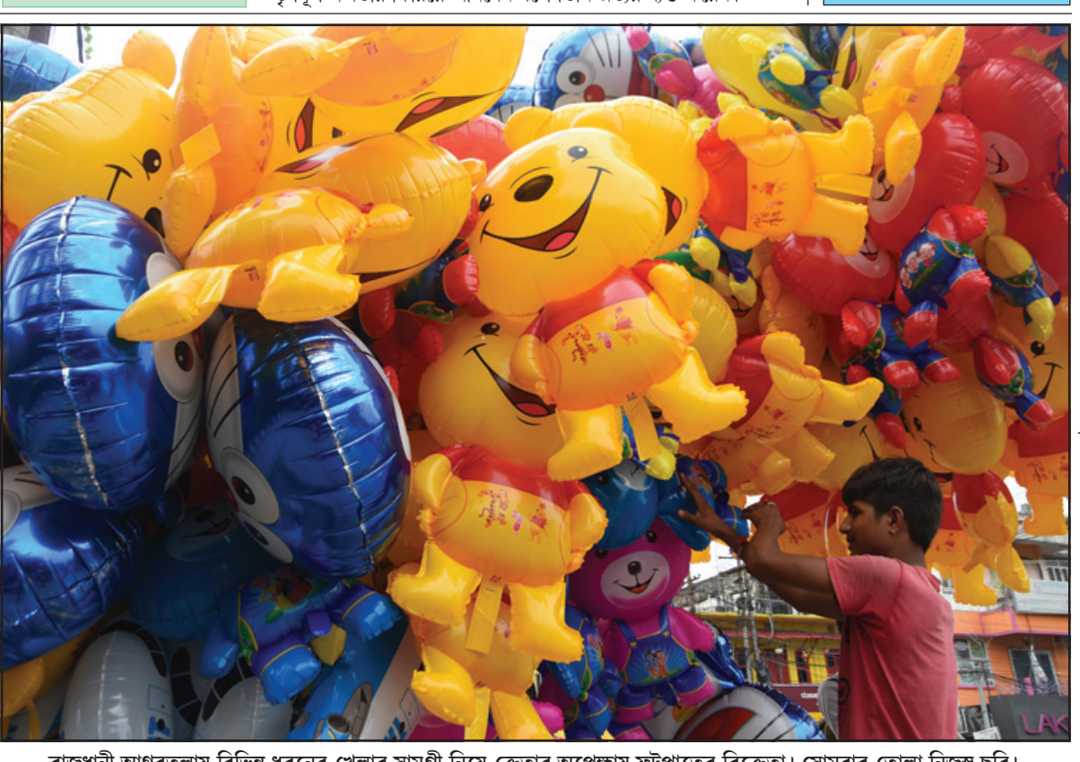
রাজধানী আগরতলায় বিভিন্ন ধরনের খেলার সামগ্রী নিয়ে ফ্রেতার অপেক্ষায় ফুটপাথের বিক্রোতা। সোমবার তোলা নিজস্ব ছবি।