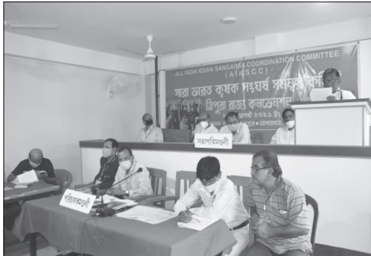
সোমবার কৃষক সভার বৈঠক অনুষ্ঠিত হয় আগরতলা।