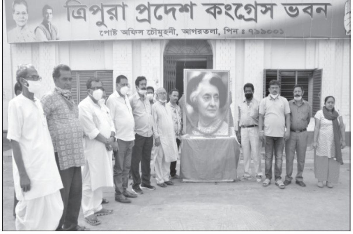
এডিসি প্রতিষ্ঠা দিবস যথাযোগ্য মর্যাদায় পালন করল কংগ্রেস।