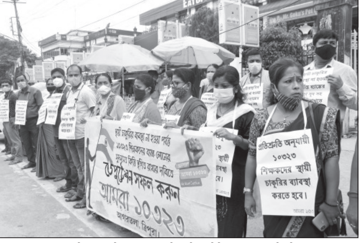
সোমবার শিক্ষা ভবনে বিক্ষোভ দেখায় চাকুরিচ্যুত শিক্ষক-শিক্ষিকাদের একাংশ।