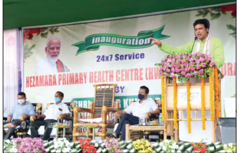
বিকেন্দ্রীকরণের মাধ্যমে পরিকাঠামো ও পরিষেবা উন্নয়নে অগ্রাধিকার দিয়ে কাজ করছে সরকার। রাজ্যের সমস্ত অংশের নাগরিকদের সার্বিক বিকাশের লক্ষ্যে একাধিক পরিকল্পনা

পাহাড়ের নাম হাতাইকতর করা হয়েছে। সঠিক ব্যবস্থাপনার মাধ্যমে কেন্দ্রীয় এবং রাজ্য সরকারের বিভিন্ন প্রকল্পের সহায়তা প্রকৃত সুবিধাভোগীদের মধ্যে পৌঁছে দেওয়া হচ্ছে। এর সফল হিসেবে দিল্লি থেকে পাঠানো বিভিন্ন প্রকল্পের ১০০ শতাংশ অর্থায়ন ও রাজ্য ও কেন্দ্রীয় সরকারের বিভিন্ন প্রকল্পের সফল পাচ্ছেন প্রকৃত সুবিধাভোগীরা। এরজন্য কোনও জনপ্রতিনিধির পেছন ছুটতে হচ্ছে না। বরং সরকারের সচ্ছন্দভঙ্গির ফলে জনপ্রতিনিধি এবং আধিকারিকরা বিভিন্ন প্রকল্পের সহায়তা অস্বীকার করে পৌঁছে দিতে কাজ করছেন। গ্রামীণ অর্থনীতির বিকাশের পাশাপাশি স্টার্টআপ সহ অন্যান্য পন্থায় রোজগার তৈরি হচ্ছে রাজ্যে। নির্মিতমান জাতীয় সড়ক রাজ্যের যোগাযোগ ব্যবস্থার উন্নয়নের গতিতে আরও ত্বরান্বিত করছে। মুখ্যমন্ত্রী বলেন, কৃষকদের জমিতে কাজ করার উপযুক্ত পরিবেশ তৈরির পাশাপাশি পান-প্রাপকরাও যেন কৃষিক্ষেত্রের বিভিন্ন