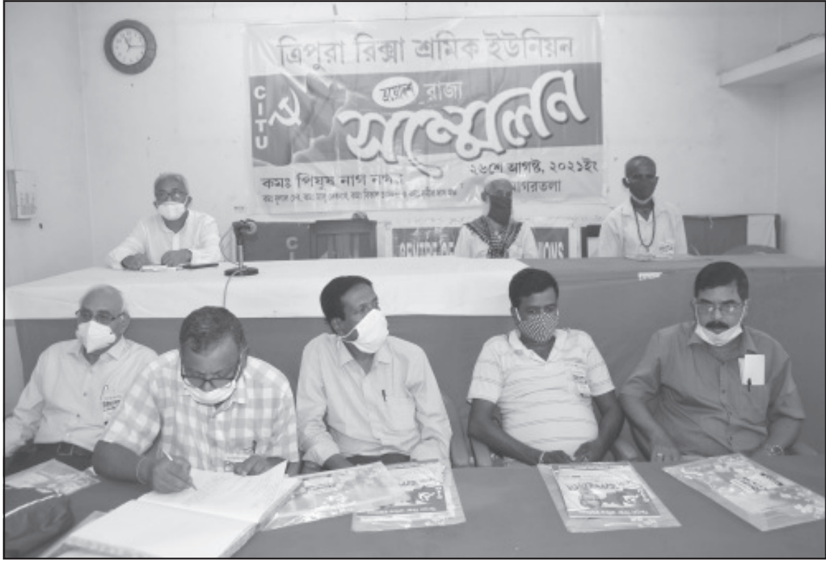
বৃহস্পতিবার আগরতলায় ত্রিপুরা রিক্সা শ্রমিক ইউনিয়নের সম্মেলন অনুষ্ঠিত হয়।