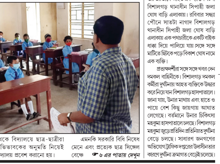
এমনকি সরকারি বিধি নিষেধ মেনে এবং প্রত্যেক ছাত্র সিঙ্গেল বেঞ্চে ৬ এর পাতায় দেখুন

নিজস্ব প্রতিনিধি, আগরতলা, ১৩ সেপ্টেম্বর।। দীর্ঘ প্রায় দেড় বছর পর স্কুলের আঙিনায় পা রাখল ছাত্রছাত্রীরা। সরকারি নির্দেশ অনুযায়ী সোমবার থেকে প্রাথমিক বিভাগের স্কুল খোলা হয়েছে। আগরতলা সহ রাজ্যের অন্যান্য জায়গায়তেও প্রাথমিক বিভাগের ক্লাস চালু করা হয়েছে। বিগত কয়েক মাস ধরে করোনাগা অতিমারীর প্রভাবে বিশালয়ের পঠন পাঠন বন্ধ ছিল। কিন্তু বর্তমানে করোনা পরিস্থিতি স্বাভাবিক হবার ফলে রাজ্য সরকারের শিক্ষা দপ্তরের পক্ষ