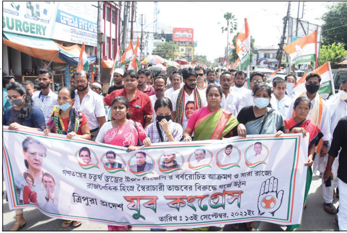
সোমবার আগরতলায় প্রদেশ যুব কংগ্রেসের বিক্ষোভ মিছিল। ছবি নিজস্ব।