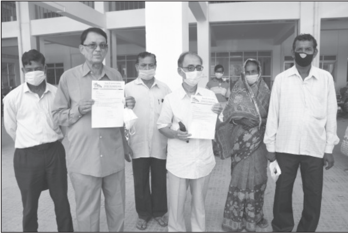
শ্রম দপ্তরে চা শ্রমিকদের বিভিন্ন দাবি নিয়ে ডেপুটিশন দেওয়া হয়।