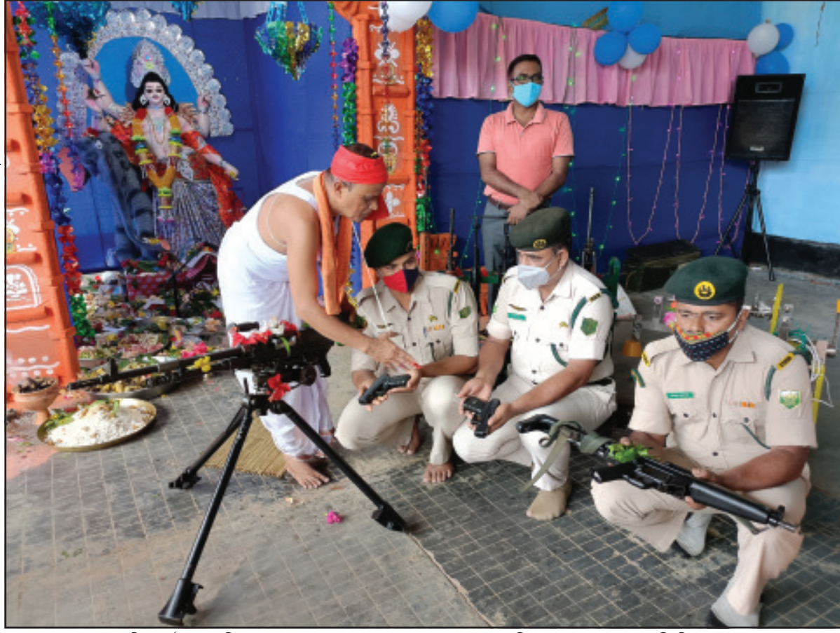
বিশ্বকর্মা পূজায় টিএসআর ক্যাম্পের জওয়ানরা আগ্নেয়াস্ত্র যাত্রা করিয়েছেন প্রথা মেনে।