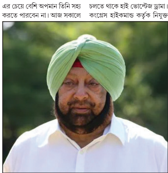
মুখ্যমন্ত্রী পদে ইস্তফা দিলেন ক্যাপ্টেন অমরিন্দর সিং

চণ্ডীগড়, ১৮ সেপ্টেম্বর (হি.স.)। পাঞ্জাবে আগামী বছরের বিধানসভা নির্বাচনের আগে, শনিবার মুখ্যমন্ত্রী ক্যাপ্টেন অমরিন্দর সিং তাঁর পুরো মন্ত্রী পরিষদ সহ পদত্যাগ করলেন। পদত্যাগপ্রহণের পর বিকল্প ব্যবস্থা না হওয়া পর্যন্ত রাজ্যপাল বনওয়ারীলাল পুরোহিত তাকে তত্ত্বাবধায়ক মুখ্যমন্ত্রী হিসেবে দায়িত্ব পালন করতে বলেছেন। এদিকে, কংগ্রেস বিধায়কদের দলীয় সভায়, সমস্ত বিধায়করা এক-লাইনের প্রস্তাব পাস করে দলের সভানেত্রী সোনিয়া গান্ধীকে মুখ্যমন্ত্রী বেছে নেওয়ার অধিকার দিয়েছেন।