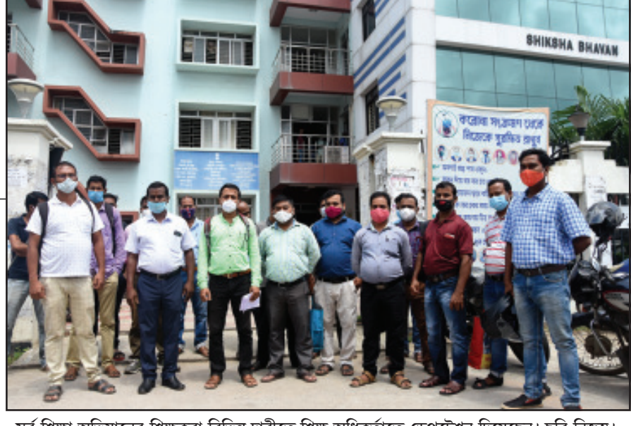
সর্ব শিক্ষা অভিযানের শিক্ষকরা বিভিন্ন দাবীতে শিক্ষ অধিকর্তাকে ডেপুটেশন দিয়েছেন।

পড়ুয়া ছাত্রী ঘটনার ২৪ ঘটায় যেতে না যেতেই ফের আত্মহত্যার ঘটনা কুমারঘাট থানা এলাকায় এখানে সুকান্তনগর বিদ্যাসাগর কলেজ পাড়ায় নিজ ঘর থেকে উদ্ধার হলো ওড়নায় ফাঁস জড়ানো বছর একুশের এক যুবতীর বুলন্ত দেহ।