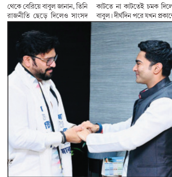
বাবুল সুপ্রিয়কে তৃণমূলে বরণ করলেন অভিষেক বন্দ্যোপাধ্যায়।

এর চেয়ে বেশি অপমান তিনি সহ্য করতে পারেন না। আজ সকালে কংগ্রেস হাইকমান্ড কর্তৃক নিযুক্ত কলকাতা, ১৮ সেপ্টেম্বর (হি.স.)। শনিবারের দুপুরে আচমকই তৃণমূলে যোগ দিলেন আসানসোলার বিজেপি সাংসদ তথা প্রাক্তন কেন্দ্রীয় মন্ত্রী বাবুল সুপ্রিয়। তৃণমূলের সর্বভারতীয় সাধারণ সম্পাদক অভিষেক বন্দ্যোপাধ্যায়ের উপস্থিতিতে তিনি শাসক দলের পতাকা হাতে তুলে নেন। উপস্থিত ছিলেন তৃণমূলের রাজ্যসভার সাংসদ ডেরেক ও'ব্রায়েন সিম্প্রতি নরেন্দ্র মোদী কেন্দ্রীয় মন্ত্রিসভার রদবদলের সময়ে মন্ত্রিত্ব খোঁয়ান বাবুল।