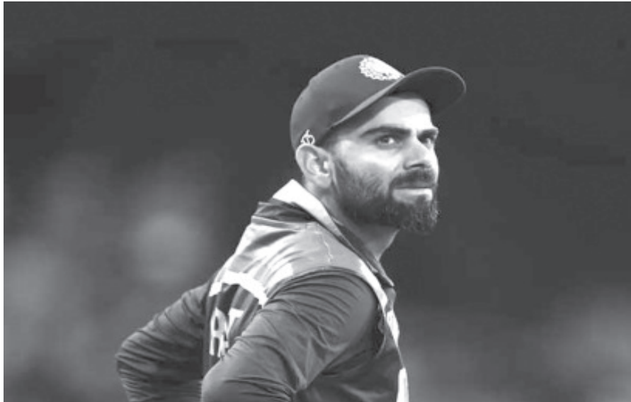
দলের মেম্বার হিসেবে দেখা যাবে মাহেশ্বরি সিং ধোনিকে। অধিনায়ক বিরাট কোহলী জানিয়ে দিয়েছেন এই বিশ্বকাপের পরেই টি-২০ ক্রিকেটে আর দলকে নেতৃত্ব দেবেন না তিনি। কোচ রবি

নয়াদিল্লি, ১৮ সেপ্টেম্বর (হিস) : পাকিস্তানের বিরুদ্ধে ম্যাচ দিয়ে বিরাট কোহলীদের টি-২০ বিশ্বকাপের যাত্রা শুরু। সেই ম্যাচ খেলার আগে প্রস্তুতি সেরে রাখতে চাইছেন কোহলীরা। সেজন্য ইংল্যান্ড এবং অস্ট্রেলিয়ার বিরুদ্ধে প্রস্তুতি ম্যাচ খেলবে ভারত। আইপিএল শেষ করেই বিশ্বকাপ। বিভিন্ন দলে একে অপরের বিরুদ্ধে খেলার পর এক সঙ্গে খেলতে নামবেন কোহলী, রোহিত শর্মা। তাই আগে থেকে প্রস্তুতি ম্যাচে নিজেদের দল গুছিয়ে নিতে চাইছে ভারত। সেই লক্ষ্যেই আগামী ১৮ অক্টোবর ইংল্যান্ডের বিরুদ্ধে এবং ২০ অক্টোবর অস্ট্রেলিয়ার বিরুদ্ধে খেলবেন কোহলীরা।