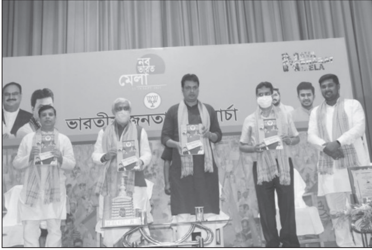
কেন্দ্রীয় মন্ত্রী অশ্বিন কুমার চৌবে এবং মুখ্যমন্ত্রী বিপ্লব কুমার দেব আগরতলায় যুব মোচাঁর নবভারত মেলা অনুষ্ঠানে।