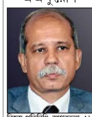
নিজস্ব প্রতিনিধি, আগরতলা, ১৮ সেপ্টেম্বর।