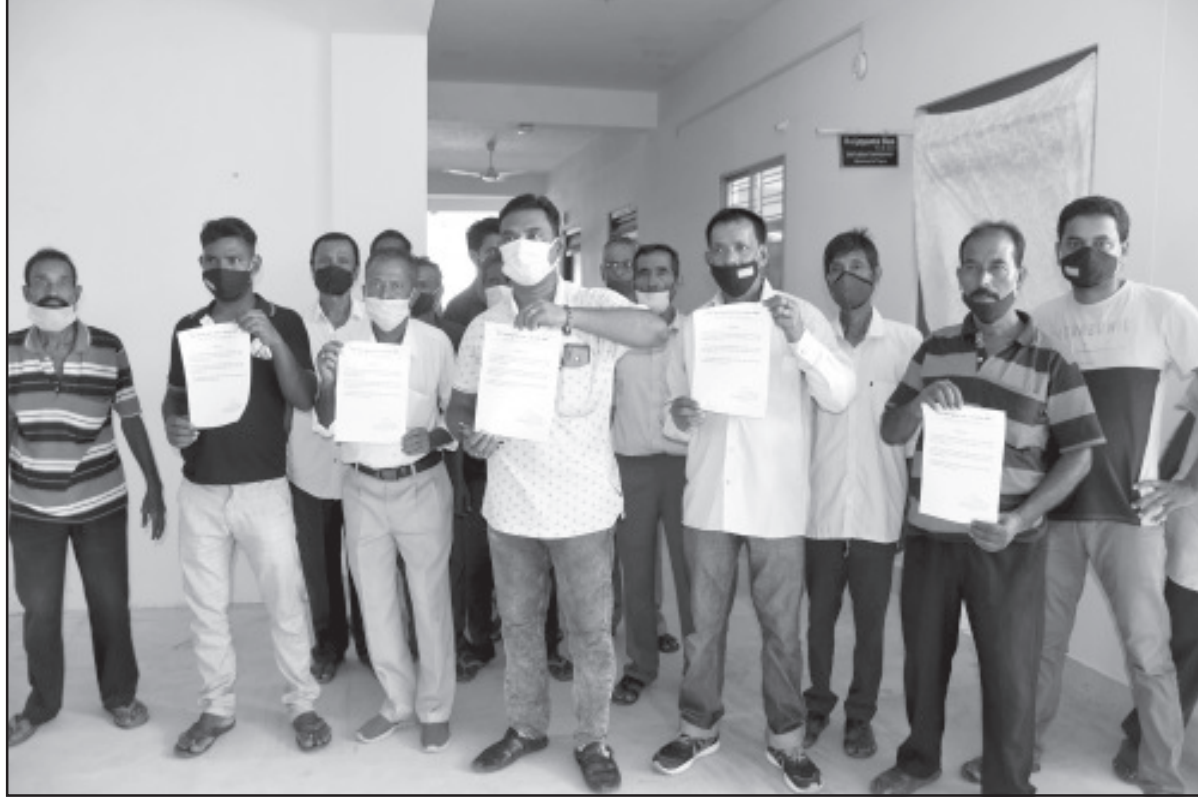
বেসরকারি বাস চালকরা ডেপুটেশন দিয়েছে শ্রম কমিশনকে।