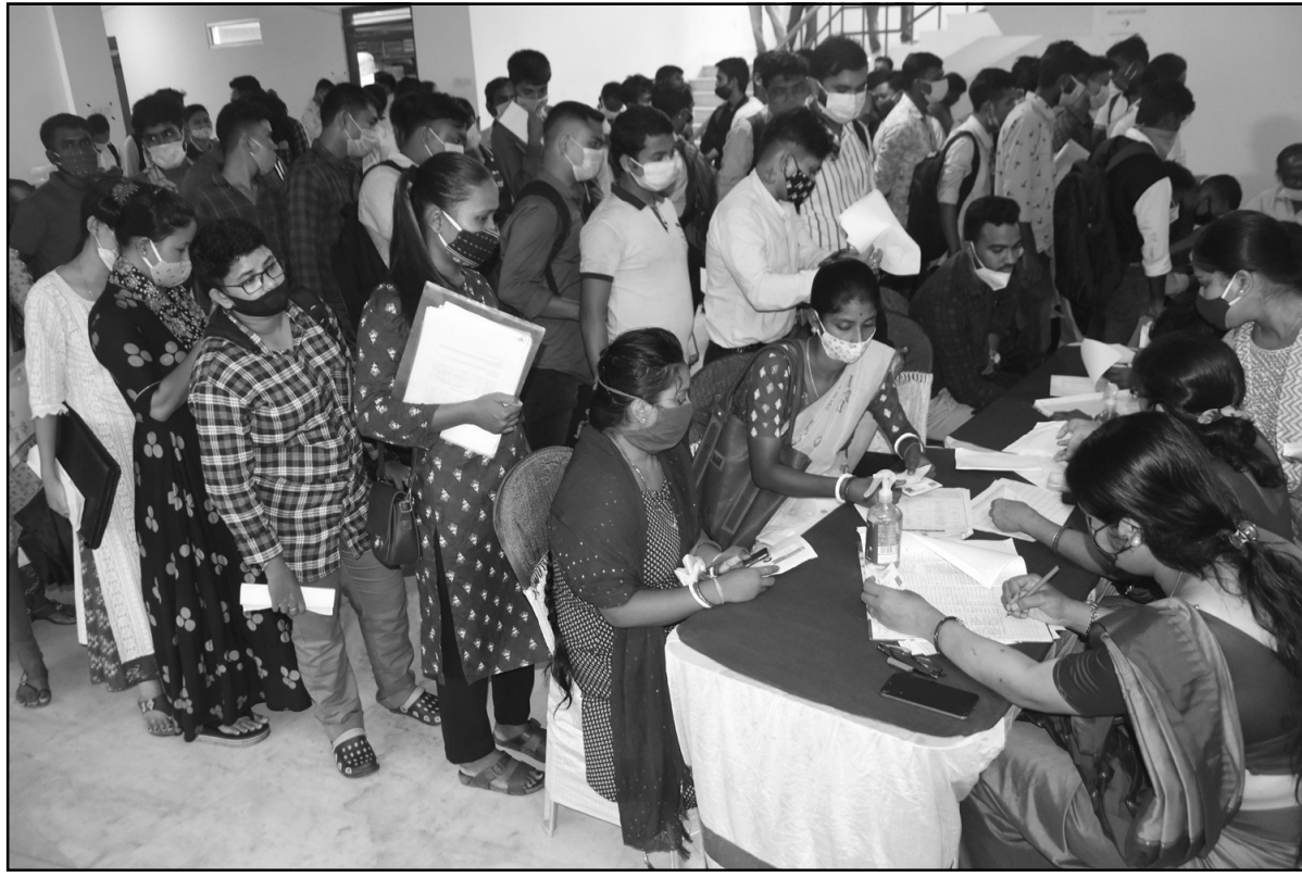
আগরতলা জব ফেয়ার অনুষ্ঠিত হয়েছে।