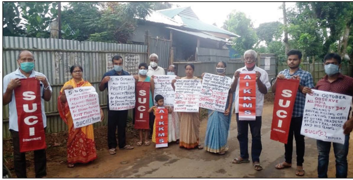
কৃষক আন্দোলনে গুলি চালানোর ঘটনার প্রতিবাদে আগরতলায় এসইউসিআই এর বিক্ষোভ প্রদর্শন।