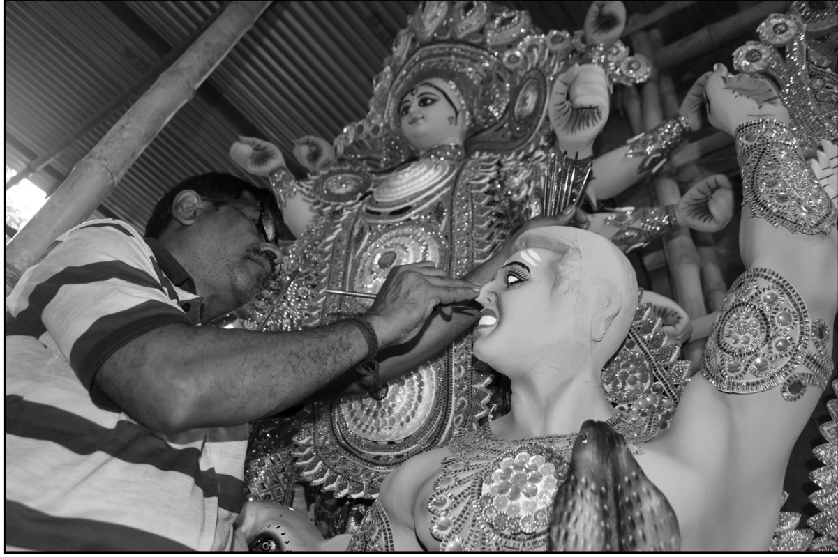
আর মাত্র ৫ দিন বাকি। মূর্তি পাড়ায় চলছে জোর তৎপরতা প্রতিমা তৈরির।