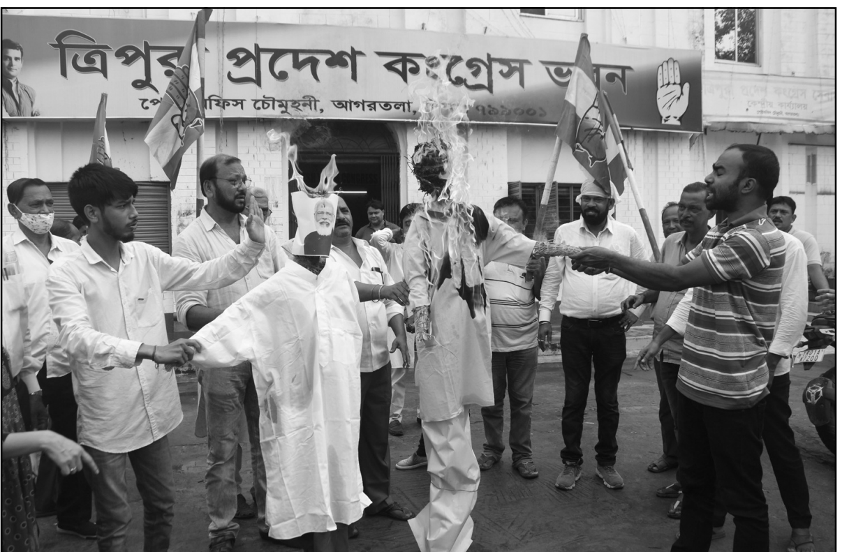
কৃষক আন্দোলনের উপর গুলি চালানোর ঘটনার প্রতিবাদ কর্মসূচি প্রদেশ কংগ্রেসের।