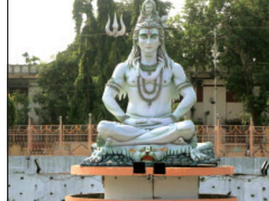
শুক্রবার ধর্মনিরপেক্ষ কালীবাড়ির পূণ্যদীঘির সংস্কার ও নবরূপে। সার্বিক কল্যাণে কাজ করছে সরকার। রাবার, আগরতলা

নিজেরাই অন্যদের কাজের সংস্থান তৈরি করছেন। মহিলা স্বশক্তিকরণের লক্ষ্যে রেশনশপের মালিকানা মহিলাদের দেওয়ার পদক্ষেপ নিয়েছে সরকার। যার অন্যতম লক্ষ্য মহিলাদের আয়গতর বৃদ্ধি ও অর্থনীতিতে অংশীদারিত্ব বাড়ানো। মহিলাদের অর্থনৈতিক উন্নয়ন ব্যতিরেকে সমগ্র রাজ্যের উন্নয়ন সম্ভব নয়। এই বিষয়টিকে গুরুত্ব দিয়ে মহিলা ক্ষমতায়নের লক্ষ্যে একাধিক পরিকল্পনা সফলভাবে রূপায়িত হচ্ছে। বেড়েছে রোগের শ্রমবিস। মুখ্যমন্ত্রী আরও বলেন, রাজ্যে করোনায় পরিস্থিতিকে সামনে রেখে স্বাস্থ্য পরিকাঠামোর উন্নয়ন ও পরিষেবার বিকেন্দ্রীকরণে সাফল্য এসেছে। নাগরিকদের স্বাস্থ্য সুরক্ষাকে গুরুত্ব দিয়ে আইসিইউ, ভেন্টিলেটর ৬ এর পাতায় দেখুন