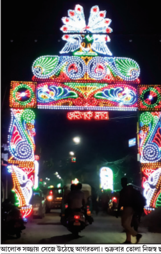
আলোক সজ্জায় সেজে উঠেছে আগরতলা।

হোক ভোট যুদ্ধে তারা অবতীর্ণ হবেই। এক্ষেত্রে রাজনৈতিক পরিস্থিতি এবং নির্বাচনের পরিস্থিতির উপর অনেক কিছুই নির্ভর করছে। অবাধ ও স্বচ্ছ নির্বাচনের গ্যারান্টি কতটা মিলবে তার উপর অনেক কিছু নির্ভর করছে। আপাতত ছয়টি রাজনৈতিক শক্তি সর্বল, দুর্বল যাই হোক না কেন তারা ভোট ময়দানে