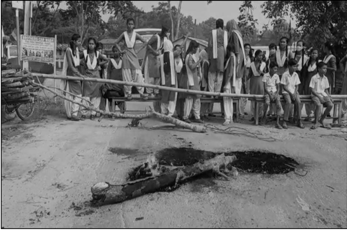
শিক্ষক বদলির প্রতিবাদে বঙ্গনগরে ছাত্রীদের পথ অবরোধ।