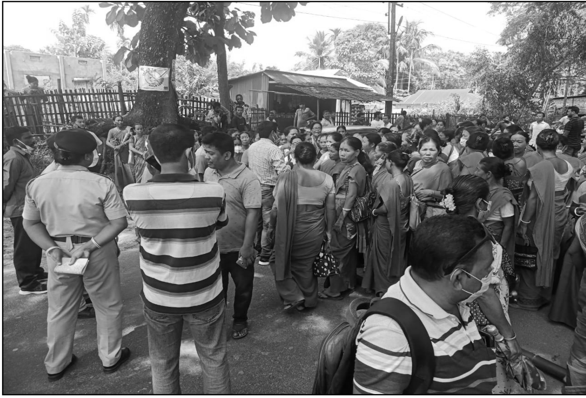
বক্সা বিল ও পুজো আড়ভাসের দাবিতে অসনওয়াড়ি কর্মী ও সহায়িকাদের পথ অবরোধ।