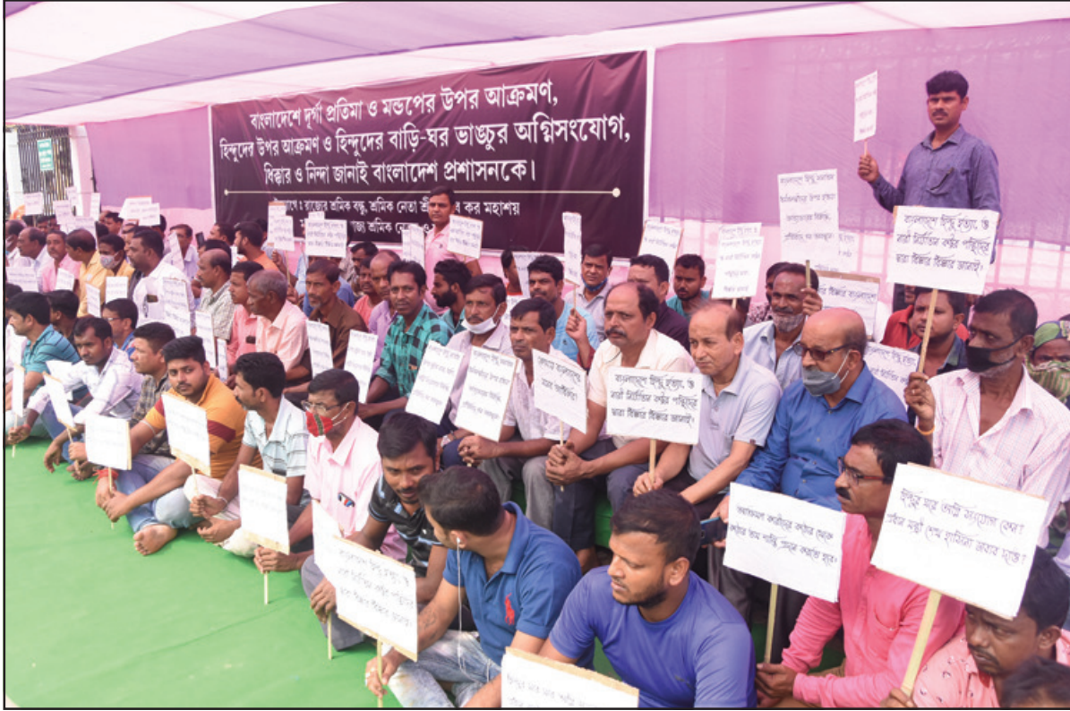
বাংলাদেশে হিন্দু নির্ধাতনের প্রতিবাদে রাজধানী আগরতলায় গণধরনা দিয়েছেন সাধারণ জনগণ। শুক্রবার তোলা নিজস্ব ছবি।