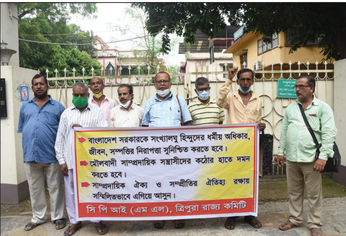
বাংলাদেশে হিন্দু নির্ধাতনের প্রতিবাদে শুক্রবার আগরতলাস্থিত বাংলাদেশ সরকারি হাইকমিশনে ধরণা সিপিআইএমএল এর।

পুনরায় বাগমা বাজারে এসে মিলিত হয়। মিছিল থেকে বাংলাদেশ সরকারের ওপর তীব্র ক্ষোভ প্রকাশ করা হয়। মিছিলে অংশগ্রহণকারীদের দাবি বাংলাদেশে হিন্দুদের উপর অত্যাচার কারীদের আইনের আওতায় এনে তাদের কঠোর শাস্তি প্রদান করতে হবে। এদিন এই প্রতিবাদ মিছিলে হিন্দু জাগরণ মঞ্চ এবং বিশ্ব হিন্দু পরিষদের সমর্থকদের উপস্থিতি ছিলো লক্ষ্যণীয়। বহুদিন পর বাগমা বাসিন এই ধরনের এক প্রতিবাদী মিছিল দেখাশোলে।