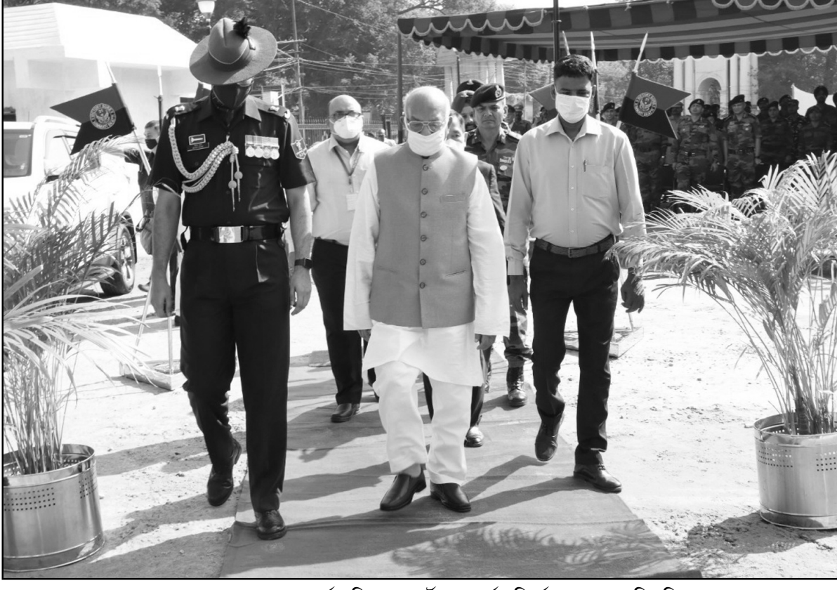
রাজ্যপাল সত্যেন্দ্র নাথায়ণ আর্ঘ্য শনিবার এলবার্ট এক্সা পার্ক পরিদর্শন করেছেন।