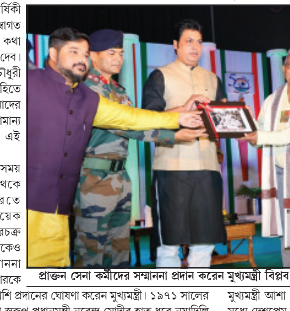
প্রাক্তন সেনা কর্মীদের সন্মাননা প্রদান করেন মুখ্যমন্ত্রী বিপ্লব কুমার দেব।

উল্লেখ্য, ১৯৭১ সালের মুক্ত ভারতের গৌরবময় বিজয় স্মরণ স্বরূপ এই স্বর্নিম্ন বিজয় মশাল যাত্রার সূচনা হয়েছে। ২০২০ সালের ১৬ ডিসেম্বর প্রধানমন্ত্রী নরেন্দ্র মোদির হাত ধরে নয়াদিল্লি থেকে স্বর্নিম্ন বিজয় মশাল রাজ্যে এসে পৌঁছেছে। মুখ্যমন্ত্রী বলেন, নানা সময়ে ভারতীয় সেনারা নিজেদের দক্ষতা, রাষ্ট্রপ্রেম এবং সাহসিকতার নজির রেখেছেন। এ সবার মধ্যে কারণিক যুদ্ধ বা সার্ভিক্যাল স্ট্রাইক হচ্ছে অন্যতম দৃষ্টান্ত।