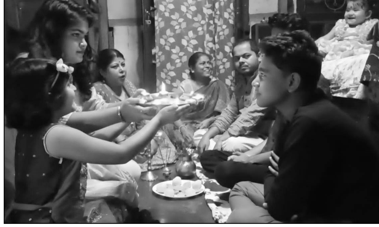
ভাইফোঁটার আনন্দে মজেছে শিশুরাও। শনিবারের তোলা ছবি নিজস্ব।