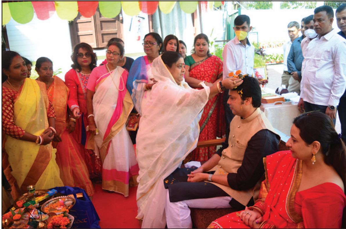
শনিবার মুখ্যমন্ত্রী বিপ্লব কুমার দেব সরকারি আবাসনে ভাইফেটায় অংশ নিয়েছেন।