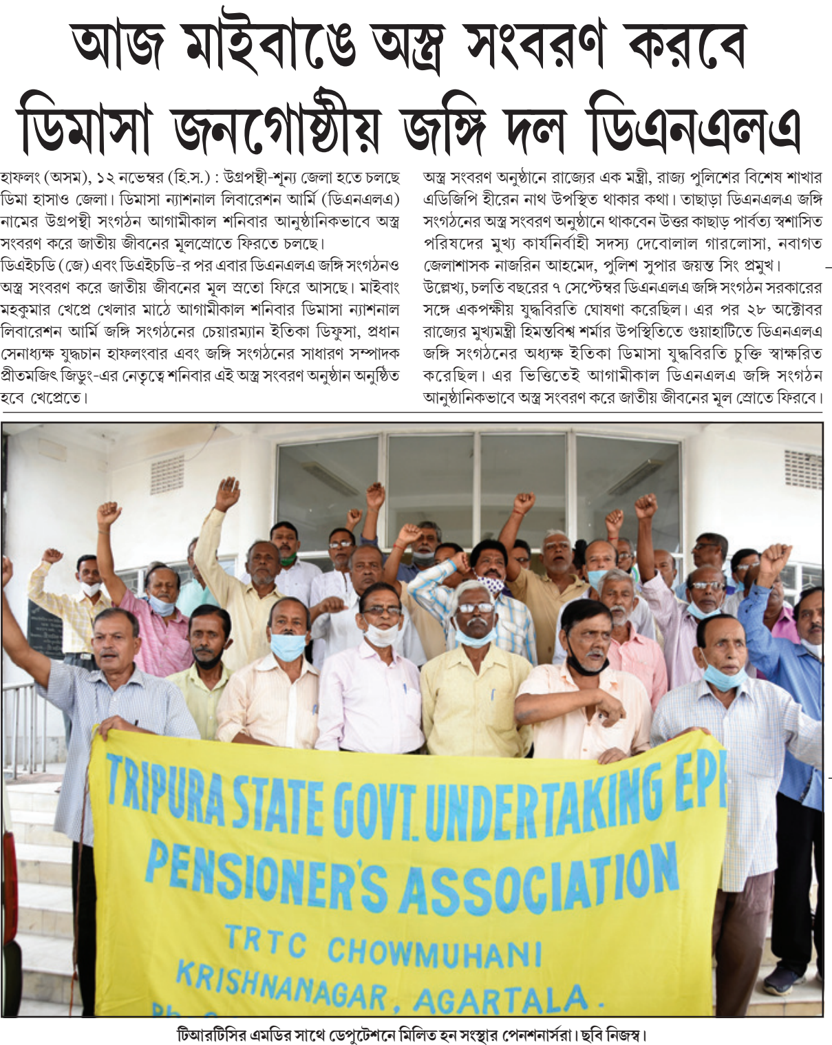
টিআরটিসি এমডির সাথে ডেপুটি সেক্রেটারি মিলিত হন সংস্থার পেনশনারস। ছবি নিজস্ব।

হচ্ছে সমবায়ের কাজকর্মের উপর আলোচনা পর্যালোচনার মাধ্যমে বিগতদিনের ভুলত্রুটি ও সাফল্য চিহ্নিতকরণ, যাতে করে সমবায়ের সঙ্গে যুক্তরা অনুপ্রাণিত হন এবং যথাযথ আন্তরিকতা ও উদ্যোগের মাধ্যমে স্ব স্ব সমবায়ের সঠিক পরিচালনার মাধ্যমে গ্রামীন অর্থনৈতিক বিকাশকে ত্বরান্বিত করতে পারেন।