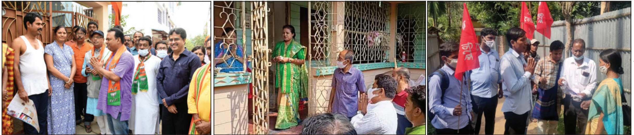
আগরতলা পুর নিগমের ৩৩ নং ওয়ার্ডে বিজেপি প্রার্থীর ভোট প্রচার। আগরতলা পুর নিগমের ২২ নং ওয়ার্ডে তৃণমূল কংগ্রেস প্রার্থীর ভোট প্রচার। আগরতলা পুর নিগমের ৩ নং ওয়ার্ডে বামফ্রন্ট প্রার্থীর ভোট প্রচার।