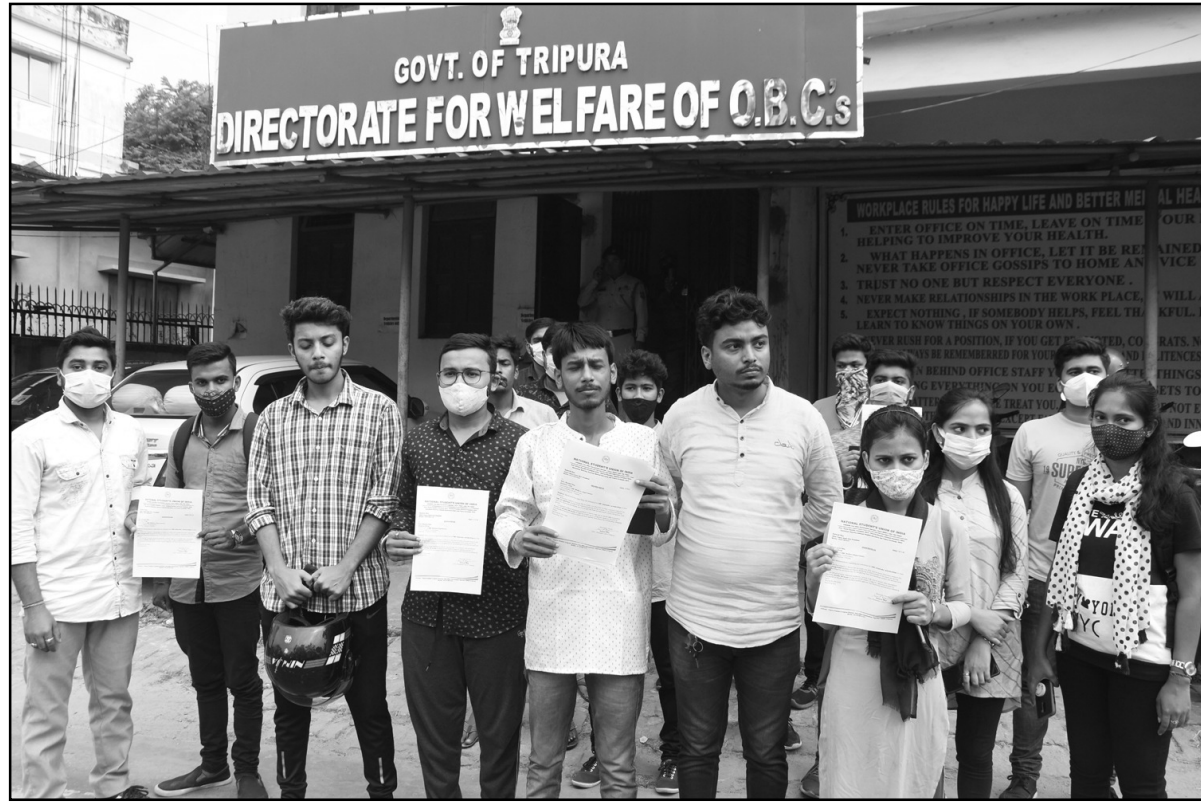
এনএসইউআই-এর পক্ষ থেকে ওবিসি উন্নয়ন দপ্তরের ডেপুটি সেক্রেটারি ডেওয়ান হরি ও নিজম।