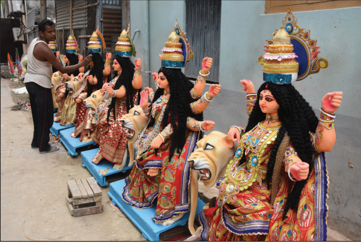
জগদ্ধাত্রী পূজা উপলক্ষে মূর্তি পাড়ায় জোর প্রদর্শিত।