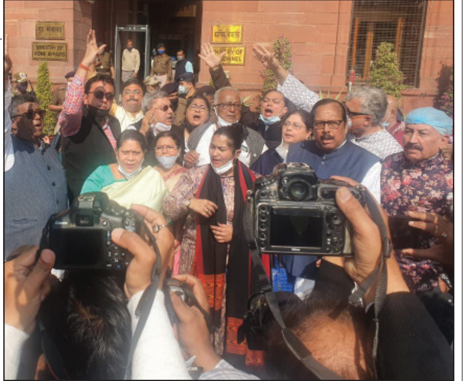
সোমবার নয়াদিল্লিতে স্বরাষ্ট্রমন্ত্রী অমিত শাহ'র অফিসের সামনে তৃণমূল সাংসদদের ধারণা।

বলবে বলে দাবি তৃণমূল সাংসদের। একই সুর শোনা গেল সাংসদ সৌগত রায় এবং দোলা সেনের গলাতেও। বর্ষীয়ান সাংসদ সৌগত রায়ের কথায়, "অমিত শাহের আশ্বাসে হিংসা থামল কিনা তার দিকে নজর থাকবে।" তৃণমূল কর্মীদের উপর ত্রিপুরা পুলিশ নৃশংস অত্যাচার করছে। মারধর করা হচ্ছে, স্লোগান দেওয়ার জন্য খানায় নিয়ে গিয়ে গ্রেফতার করছে। তাই বিপ্লব দেব সরকারের পুলিশের বিরুদ্ধে নালিশ জানাতে সোমবার সকালে দিল্লিতে স্বরাষ্ট্রমন্ত্রী অমিত শাহের দেখা না পেয়ে শেষমেশ নর্থ ব্লকে স্বরাষ্ট্রমন্ত্রকের অফিসের সামনেই ধরনায় বসে পড়েন তৃণমূল সাংসদরা। এমন হাই সিকিউরিটি জেনে সাংসদরা ধরনায় বসে পড়ায় ছুটে যান পুলিশ ও নিরাপত্তা কর্মীরা। তৃণমূল সাংসদের বুথিয়ে তাঁদের ধরনা তোলায় আবেদন জানান। কিন্তু অমিত শাহের সঙ্গে দেখা না করে সেখান থেকে কেউ নাড়বেন না বলে জানিয়ে দেন তৃণমূল সাংসদরা। সায়নী ঘোষের গ্রেফতার এবং অভিযুক্ত বন্দ্যোপাধ্যায়ের পদযাত্রা বাতিলের পরই এই ইস্যু দুটিকে জাতীয় স্তরে তুলে ধরতে দলের সাংসদের নির্দেশ দেন তৃণমূল নেত্রী। তার পরই রবিবার রাতে দিল্লি পৌঁছেন ১৫-১৬ জন ৩৬ এর পাতায় দেখুন