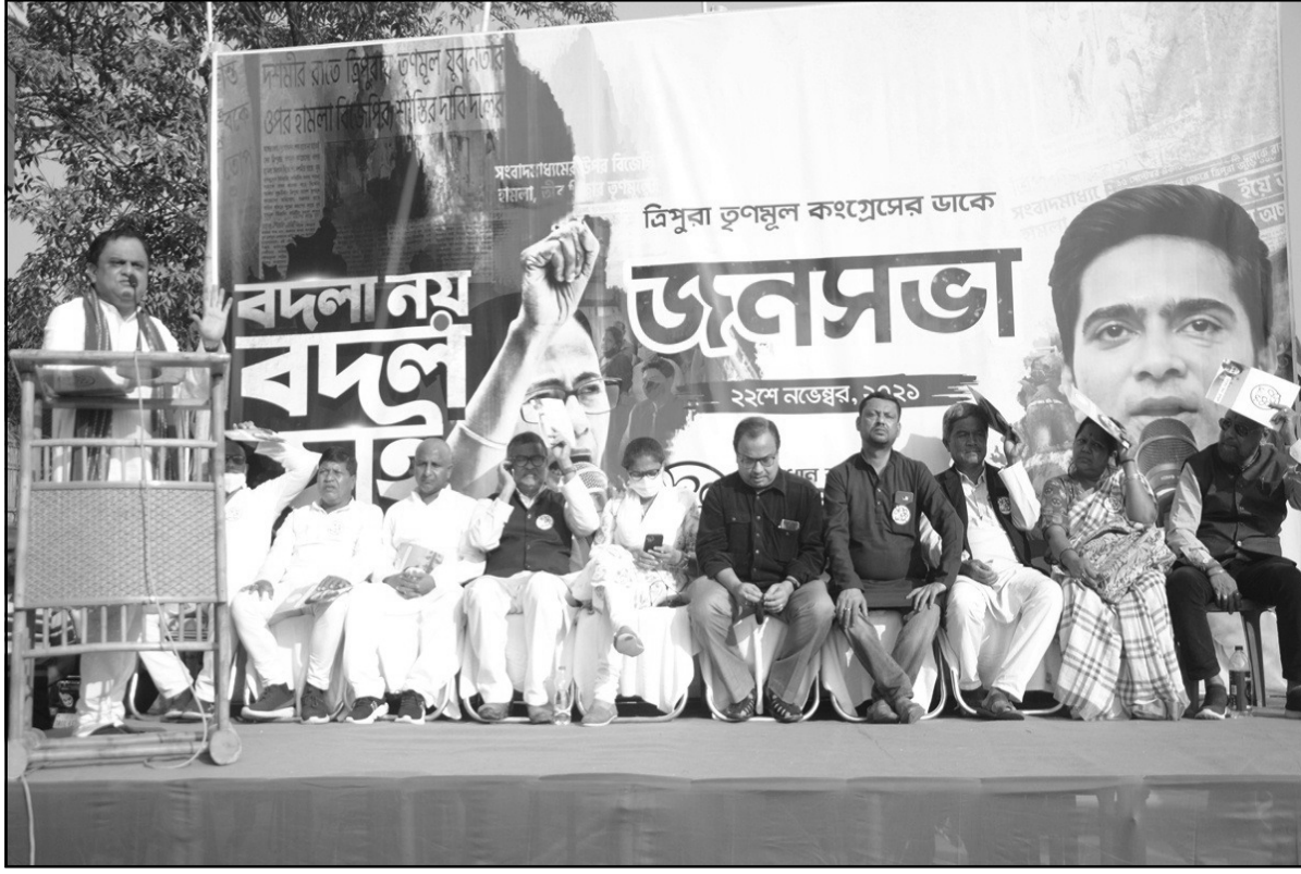
আগরতলা তৃণমূল কংগ্রেসের নির্বাচনী সভা অনুষ্ঠিত হয়।