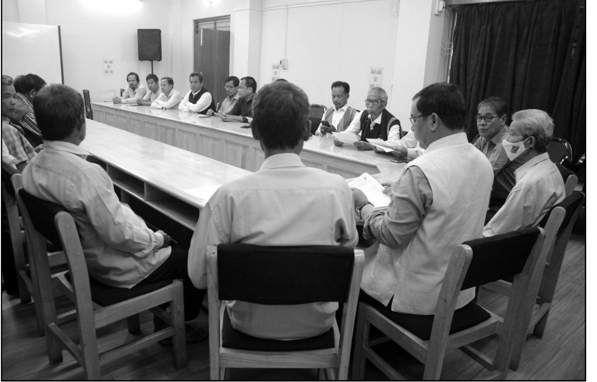
আইপিএফটি কেন্দ্রীয় কমিটি বৈঠক অনুষ্ঠিত হয়েছে সোমবার আগরতলায়।

করোনা আক্রান্ত বলিউড এবং দক্ষিণের কিংবদন্তি অভিনেতা কমল হাসান। সোমবার নিজের সোশ্যাল মিডিয়া হ্যান্ডলে জানিয়েছেন করোনা আক্রান্ত হওয়ার কথা। কিছুদিন আগেই আমেরিকা থেকে ফেরেন তিনি। তারপর সামান্য কক্ষের সমস্যা হচ্ছিল। কোভিড পরীক্ষা করলে তার ফল পজিটিভ আসে বলে জানান দক্ষিণী সুপারস্টার। এদিন দুপুরে নিজের করোনা আক্রান্ত হওয়ার কথা জানিয়ে তামিল ভাষায় টুইটারে অভিনেতা লেখেন, "আমেরিকা সফর থেকে ফেরার পর আমি সামান্য কক্ষের সমস্যা অনুভব করি। পরীক্ষা করানোর