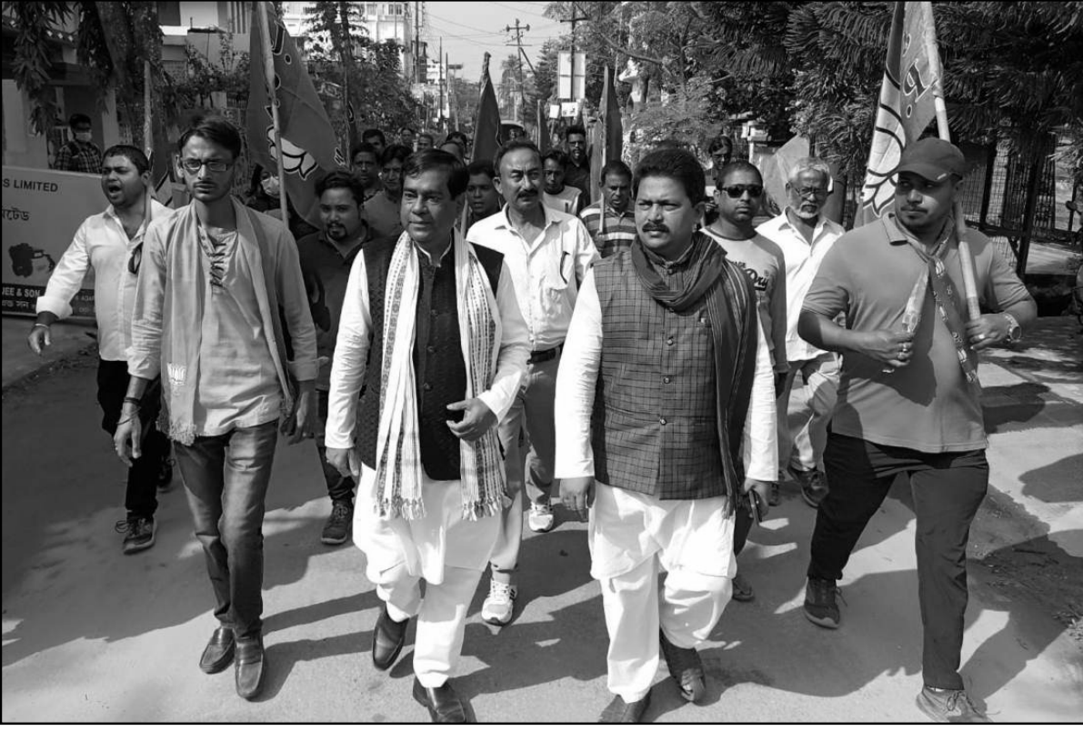
আগরতলা পুর নিগমের ভোটের লক্ষ্যে বিজেপি প্রার্থীর প্রচার।