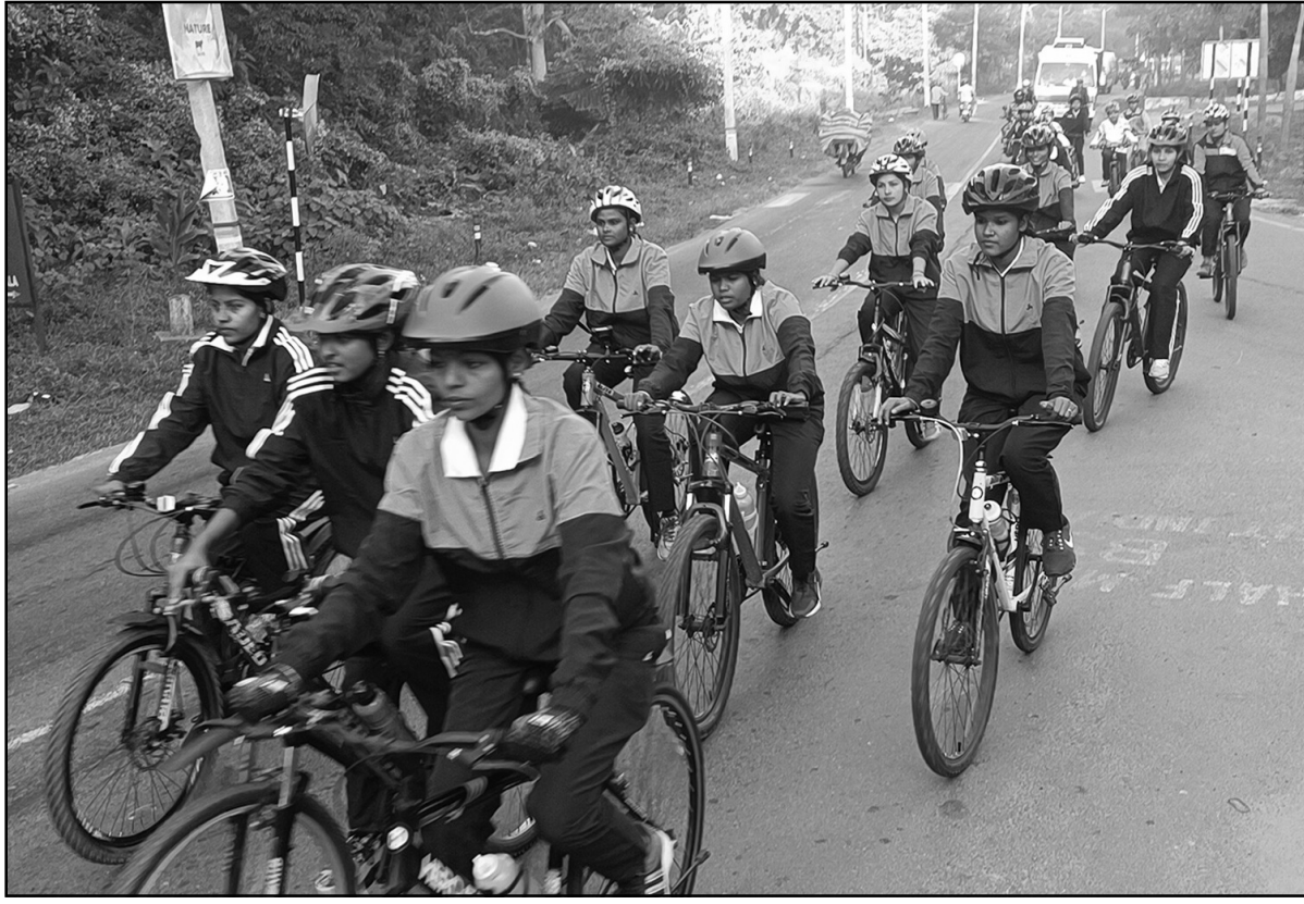
বিএসএফের প্রতিষ্ঠা দিবস উপলক্ষে সাইকেল র্যালি।