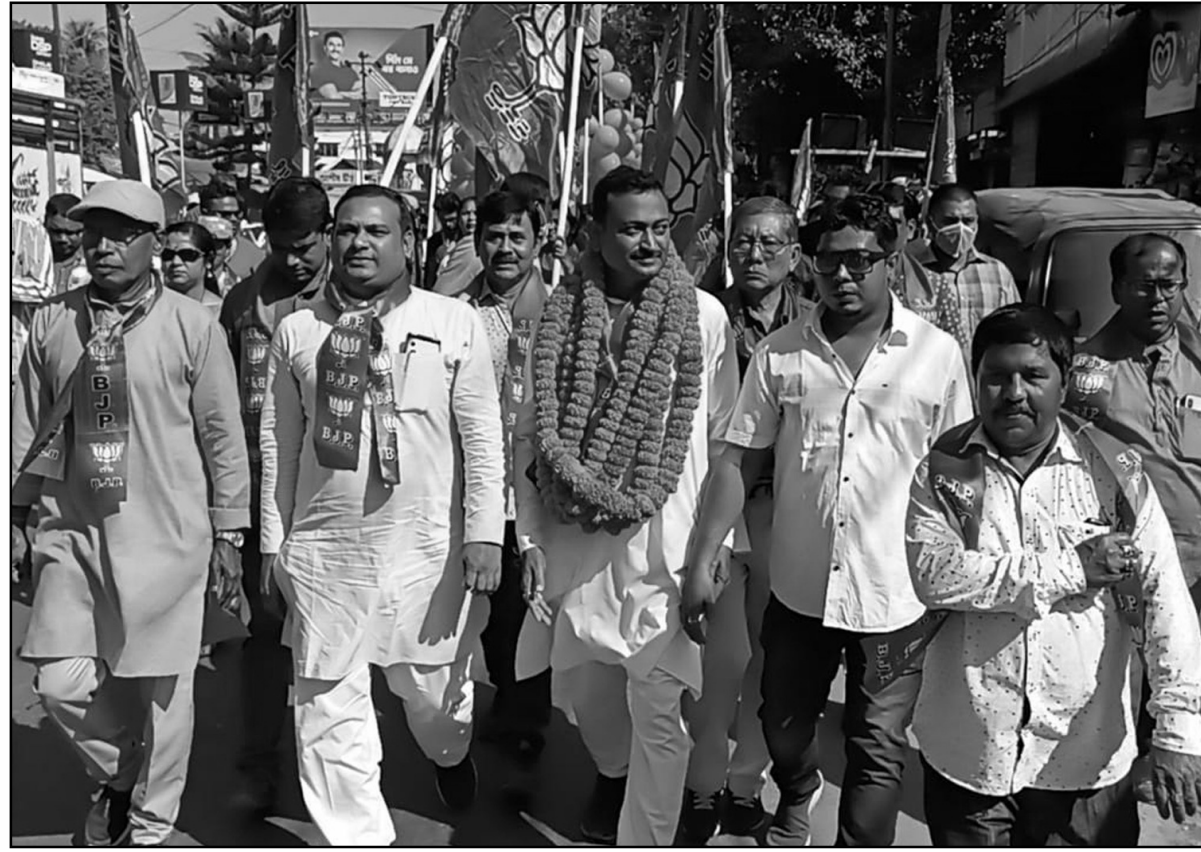
আগরতলায় বিজেপির বিজয় মিছিল অনুষ্ঠিত। ছবি : এ নিজ্জ