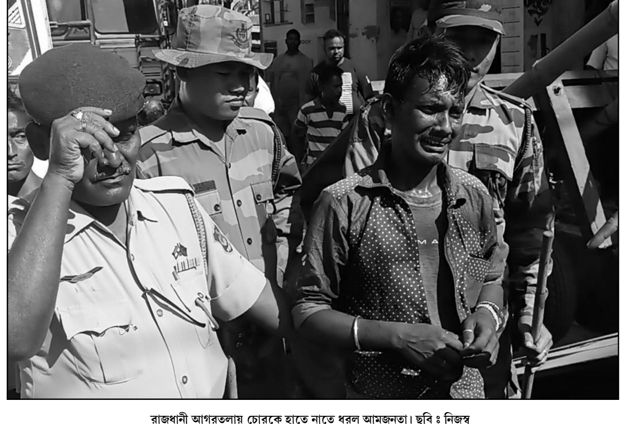
রাজধানী আগরতলায় চোরকে হাতে নাতে ধরল আমজনতা।

হয় নিরোজ। সঙ্গে সঙ্গে তাকে যোরহাট মেডিক্যাল কলেজ হাসপাতালে নিয়ে যাওয়া হলে, সেখানে কর্তব্যরত ডাক্তাররা নিরোজকে মৃত বলে ঘোষণা করেন। এদিকে এই দুর্ঘটনায় এসকোর্ট গাড়ির তিন পুলিশকর্মীও আহত হয়েছেন। তাঁদের যোরহাট মেডিক্যাল কলেজ হাসপাতালে নিয়ে ভরতি করা হয়েছে। নিরোজকে বাঁচাতে গিয়ে নিয়ন্ত্রণ হারিয়ে বলেরো গাড়িটা রাস্তার পাশে আছড়ে পড়ে। ফলে পুলিশের গাড়ি ভেঙেচুরে ব্যাপক