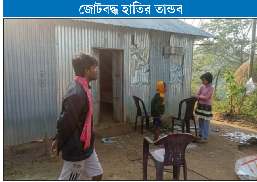
জোটবদ্ধ হাতির তাড়ব

নেমে যান বা নেমে পড়েন বাড়ি পটকা ফাটিয়ে বন্য হাতি তাড়াতে যান। ক্ষতিগ্রস্তদের প্রশ্ন বনদপ্তর এর থেকে আর বেশি কি করতে পারেন। শীতের রাতে এক আতঙ্ক নিয়ে রাত্রি যাপন করতে হয় সবাই। কখন না এসে যায় হাতির দল।