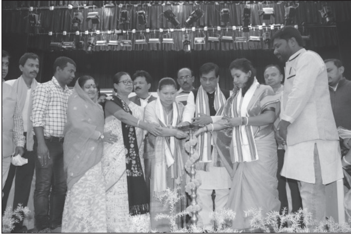
আগরতলা পুর নিগমের নব নির্বাচিত সদস্যদের স্বর্বেধন দিয়েছেন নিগমের ক্রিনিক স্টাফরা।