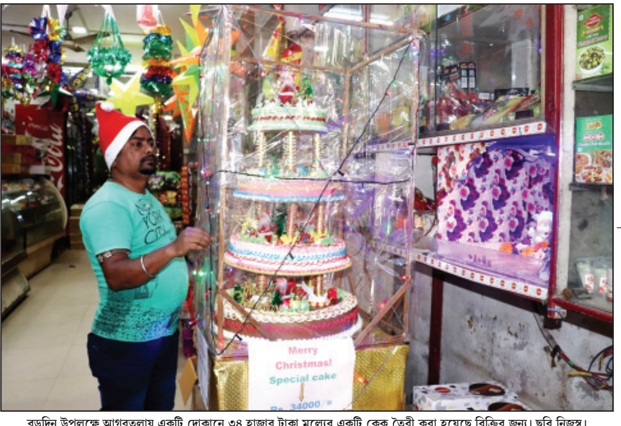
বড়দিন উপলক্ষে আগরতলায় একটি দোকানে ৩৪ হাজার টাকা মূল্যের একটি কেক তৈরি করা হয়েছে বিক্রির জন্য।