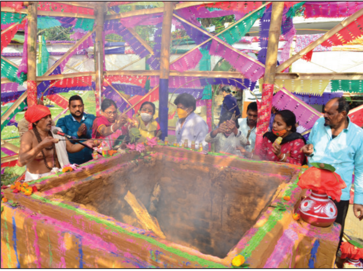
বৃহস্পতি আগরতলায় লক্ষ্মীনারায়ণবাড়ি মন্দিরে শিবব্যক্তি অনুষ্ঠিত হয়েছে।