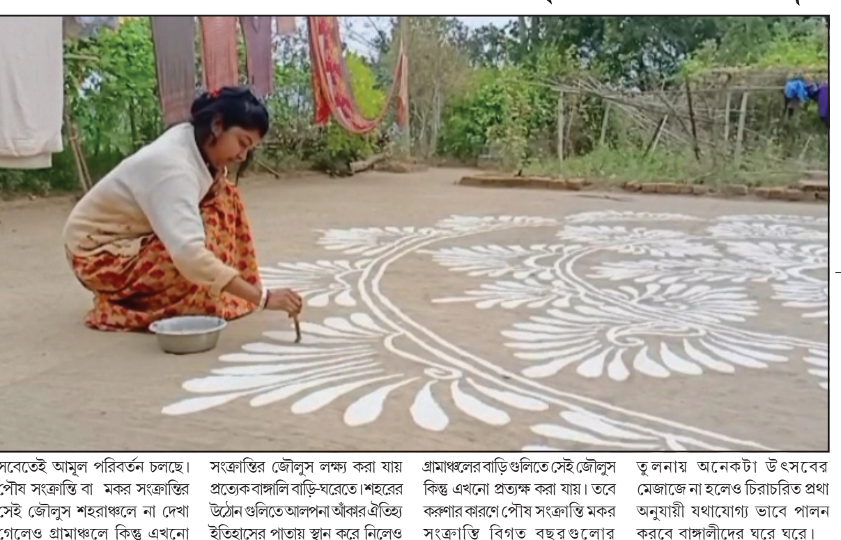
সবেগেই আমূল পরিবর্তন চলছে। সক্রান্তির জৌলুস লক্ষ্য করা যায় প্রত্যেকবাঙ্গালি বাড়িঘরেতে। শহরের পৌষ সংক্রান্তি না দেখা ইতিহাসের পাতায় স্থান করে নিলেও

গ্রামাঞ্চলের বাড়িগুলিতে সেই জৌলুস কিন্তু এখনো প্রত্যক্ষ করা যায়। তবে কল্যাণপুরে পৌষ সংক্রান্তি মকর সংক্রান্তি বিগত বছর গুলোর তুলনায় অনেকটা উৎসবের মেজাজে না হলেও চিরাচরিত প্রথা অনুযায়ী যথাযোগ্য ভাবে পালন করবে বাঙ্গালীদের ঘরে ঘরে।