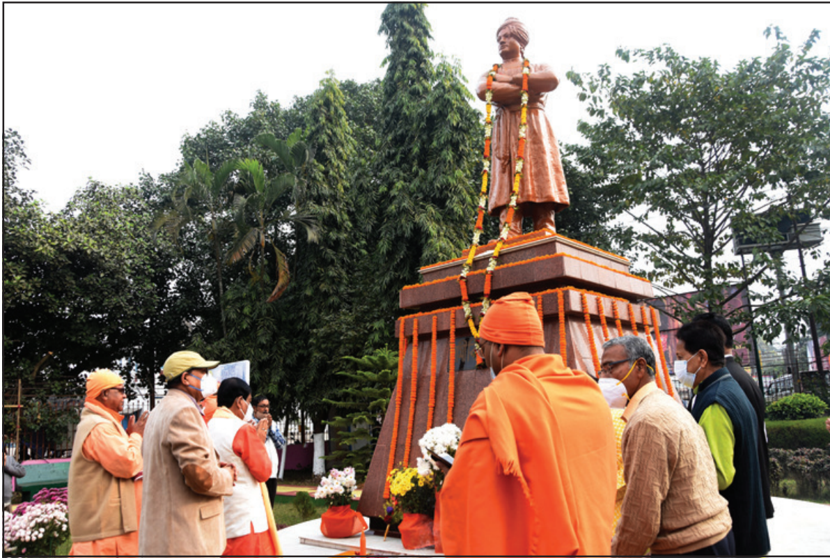
আগরতলায় বিবেক উদ্যানে স্বামী বিবেকানন্দের জন্মজয়ন্তী যথাযোগ্য মর্যাদায় পালিত হয়েছে বুধবার।