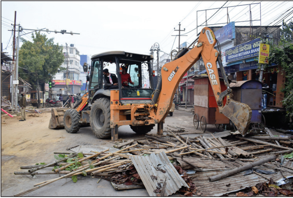
আগরতলা পুর নিগমের উদ্যোগে রাজধানীর ফুটপাথ দখলমুক্ত করার জন্য অভিযান চালানো হয়েছে বুধবার।