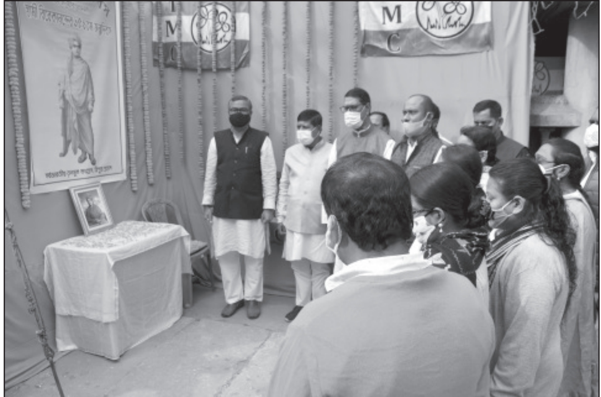
বৃদ্ধার আগরতলায় তৃণমূল কংগ্রেসের উদ্যোগে স্বামী বিবেকানন্দের জন্মজয়ন্তী পালন করা হয়েছে।