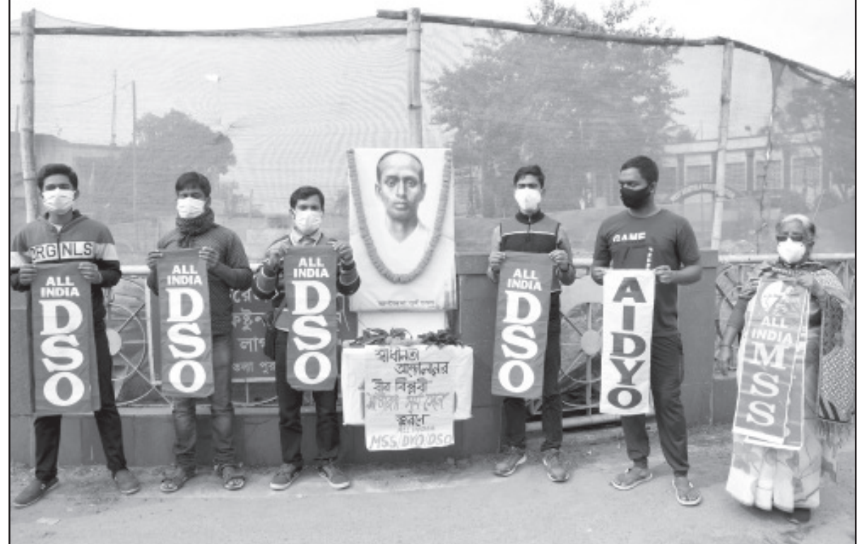
এসইউসিআই এর উদ্যোগে মাস্টার দা সূর্য্য সেনের প্রায়গ দিবস পালন করা হয়েছে বৃদ্ধার আগরতলায়।

কোভিড-১৯ আক্রান্ত হওয়ার পরই লতা মঙ্গেশকরকে মুম্বইয়ের রিচ ক্যান্ডি হাসপাতালের আইসিইউ-তে ভর্তি করা হয়। মৃদু উপসর্গ রয়েছে তাঁর শরীরে। তবে তিনি ভালোই আছেন, সতর্কতামূলক ব্যবস্থা হিসেবেই তাকে আইসিইউ-তে ভর্তি করা হয়।