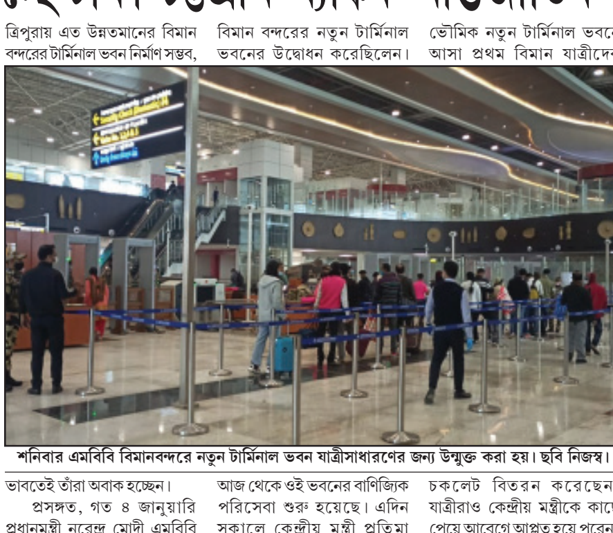
শনিবার এমবিবি বিমানবন্দরে নতুন টার্মিনাল ভবন যাত্রীসাধারণের জন্য উন্মুক্ত করা হয়।

নিজস্ব প্রতিনিধি, আগরতলা, ১৫ জানুয়ারি। দীর্ঘ প্রতিক্ষার অবসান হল আজ। এমবিবি বিমানবন্দরের নতুন টার্মিনাল দিয়ে যাত্রী পরিষেবা শুরু হয়েছে। আজ সকাল ১০টা কের্মীয় ন্যায় ও সামাজিক ক্ষমতায়ন মন্ত্রকের রাষ্ট্র মন্ত্রী কলকাতা থেকে আসা যাত্রীদের অভ্যর্থনা জানিয়েছেন। তিনি নিজেকে আজ নতুন টার্মিনাল দিয়ে প্রথম যাত্রীদের সাথে ভায়া কলকাতা দিল্লি যাচ্ছেন। এদিন কেন্দ্রীয় মন্ত্রী বলেন, ইতিপূর্বে আমরা রোগার কাজ ও সামাজিক ভায়ায় আবদ্ধ ছিলাম। আজ আমরা আন্তর্জাতিক উড়ান শুরু হওয়ার দ্বারপ্রান্তে দাঁড়িয়ে। সাথে তিনি যোগ করেন, খুব শীঘ্রই আগরতলা ভায়া গুয়াহাটি থেকে ঢাকা, চট্টগ্রাম ও ব্যাঙ্ককের বিমান শুরু হচ্ছে। এদিকে, আজ কলকাতার দুই নাগরিক এমবিবি বিমান বন্দরের নতুন টার্মিনালে পা রেখে ভীষণ আশ্চর্য হয়েছেন।