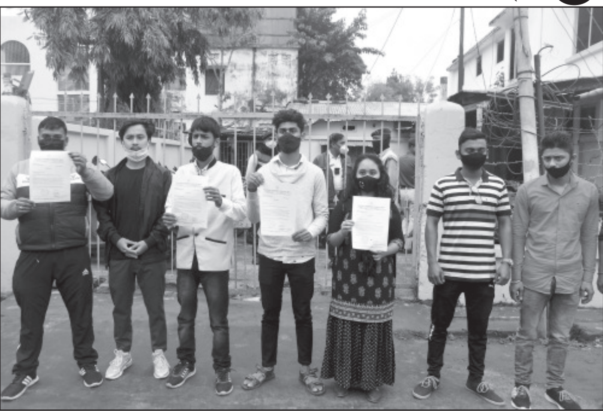
দুই ছাত্রকে নিগ্রহের প্রতিবাদে ট্রাফিক পুলিশের এসপি এর কাছে ডেপুটেশন দিয়েছে এনএসইউআই।