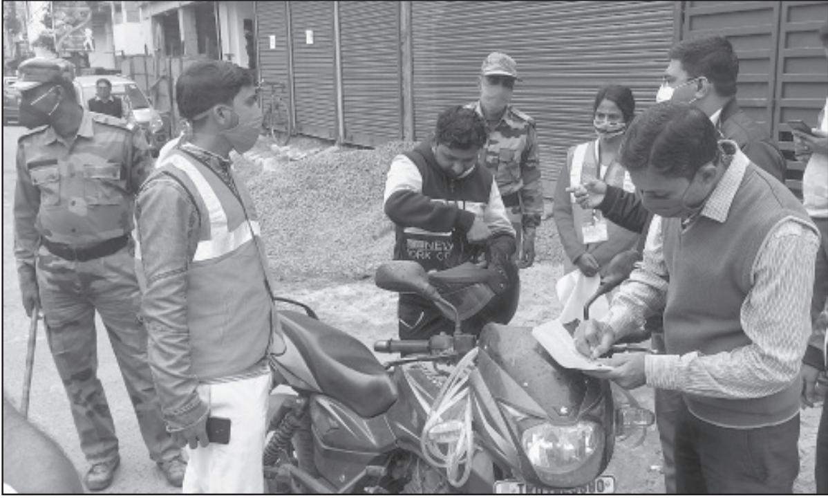
আগরতলায় প্রশাসনের উদ্যোগে মাস্ক এনফোর্সমেন্ট অভিযান চালানো হয়েছে।