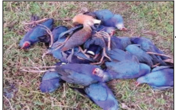
কিছু বছর দিঘির শহর, সরোবর সংঘটিত হওয়ায়। ঘটনার বিবরণে স্থানীয় সূত্রে জানা যায়, বিরল প্রজাতির পরিযায়ী পাখিদের নির্মম হত্যার অভিযোগ রয়েছে। বিপত্তি দেখা ৬ এর পাতায় দেখুন

নিজস্ব প্রতিনিধি, উদয়পুর, ২৮ জানুয়ারী। উদয়পুরের সুখসাগর জলায় পরিযায়ী পাখিদের নৃশংসভাবে হত্যার ঘটনায় প্রশাসন রীতিমতো দায়সারা মনোভাবই প্রকাশ করল। মাইকে সতর্ক বার্তা প্রচার করেই থেমে গেল প্রশাসন। যেখানে ত্রিপুরার সংস্কৃতিতে রয়েছে অতিথি দেব ভবং সেখানে পরিযায়ী পাখিদের নৃশংস ভাবে হত্যা রীতিমতো নজির গড়ল। এই পাখিগুলি প্রতিবছর শীতের মরশুমে রাজ্যের বিভিন্ন স্থানে জলাশয়গুলিতে আসে আবার শীতের শেষে সাইবেরিয়া সহ বিভিন্ন রাষ্ট্রে ফিরে যায়। এবারে উদয়পুর সুখসাগর জলায় যে নৃশংস ঘটনা ঘটল তাতে পরিবেশবিদ, পশুপ্রেমী থেকে সকল অংশের মানুষের মনে রেখাপাত করেছে। শীতের আমেজ উপভোগের