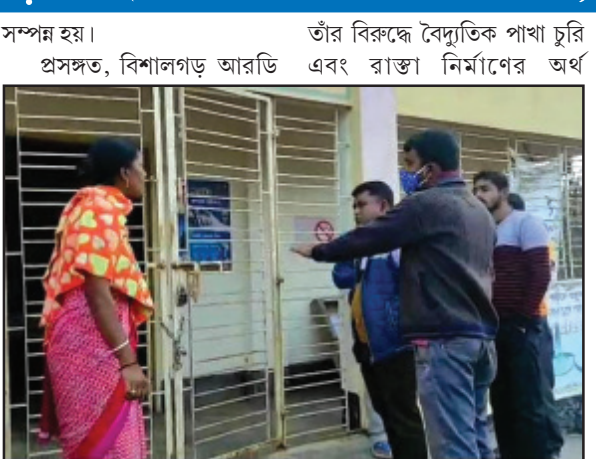
প্রসঙ্গত, বিশালগড় আরডি এবং রাস্তা নির্মাণের অর্থ

নিজস্ব প্রতিনিধি, চড়িলাম, ২৮ জানুয়ারী। স্বদলীয় পঞ্চায়েত সদস্যদের অনাস্থায় পদ খোয়ালেন প্রধান। নয়া প্রধান নিয়োগকে ঘিরে আজ প্রাক্তনের সমর্থকরা চন্দ্রনগর গ্রাম পঞ্চায়েত কার্যালয়ে তাল্লা ঝুলিয়েছেন। পরিস্থিতি নিয়ন্ত্রণে ছুটে যায় পুলিশ। এছাড়া ছুটে যান সিপাহীজলা জেলা উত্তরের বিজেপি সহ-সভাপতি তথা বিশালগড় মন্ডল সভাপতি ও অন্যান্য শীর্ষ নেতৃত্বধার। তাঁদের সাথে প্রাক্তন প্রধানের তীব্র বাকবিতণ্ডায় পরিস্থিতি উত্তপ্ত হয়ে উঠেছিল। অবশেষে পুলিশের হস্তক্ষেপে পঞ্চায়েত কার্যালয়ের তাল্লা খুলে দেন তাঁরা। এরই সাথে নয়া প্রধান পদে নির্বাচন প্রক্রিয়াও সম্পন্ন হয়।