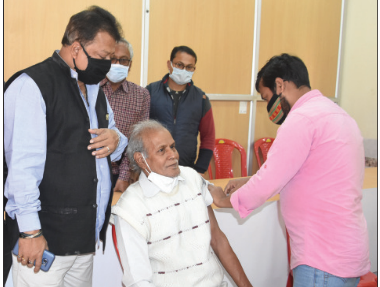
করোনার বেস্টার ডোজ। শুক্রবার আগরতলায় তোলা নিজস্ব ছবি।

এদিকে পাটনার পুলিশ অটজন ছাত্রকে চিহ্নিত করেছে এবং একটি এফআইআর-এ ছয়টি কোচিং সেন্টারের মালিকদের নাম উল্লেখ করেছে। তাঁদের বিরুদ্ধে এই বিক্ষোভে অংশ নেওয়ার অভিযোগ রয়েছে। কোচিং সেন্টারগুলির মালিকদের বিরুদ্ধে প্রাথমিকভাবে শিক্ষার্থীদের বিক্ষোভ প্রদর্শনের জন্য প্ররোচিত করার অভিযোগ আনা হয়েছে। পড়ুয়া ও টিউটরদের বিরুদ্ধে যে অভিযোগ আনা হয়েছে তার মধ্যে রয়েছে ভারতীয় দণ্ডবিধি ১২০বি (অপরাধমূলক ব্যয়বস্থা) ধারা এবং দাঙ্গা ও কর্মকর্তাদের উপর হামলা সম্পর্কিত অন্যান্য ধারা হিসেবে