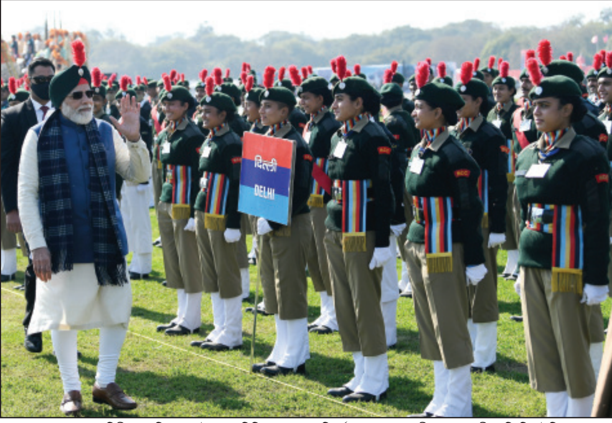
শুক্রবার নয়াদিল্লীতে কারিয়ার গ্লাউন্ডে এনসিসি'র প্যারেড পরিদর্শন করেন প্রধানমন্ত্রী নরেন্দ্র মোদী।