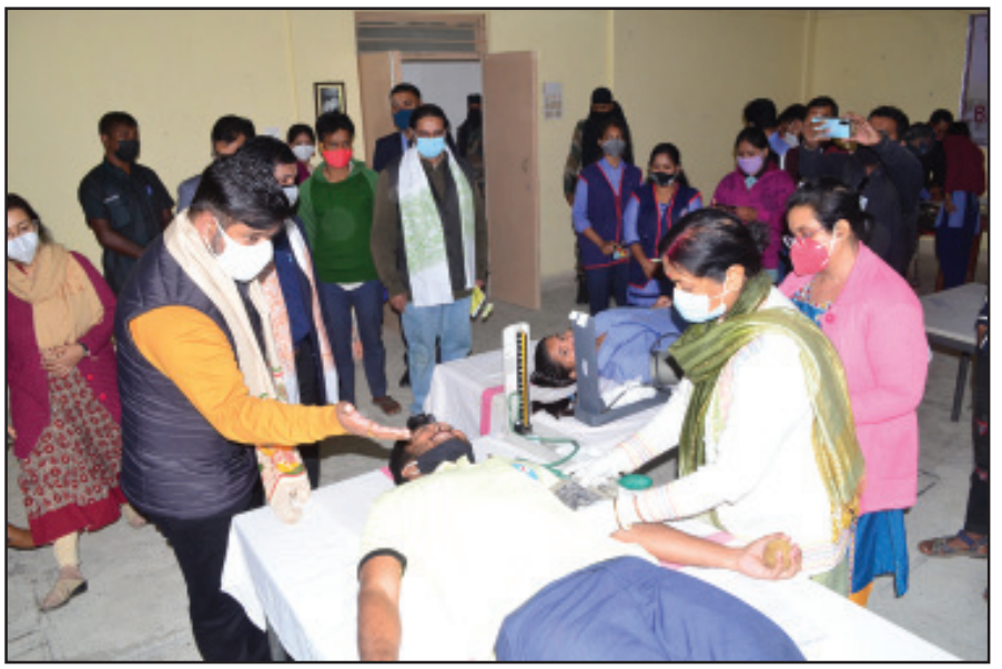
রক্তদানের বিনিময়ে একজন মুমূর্ষ মানুষের প্রাণ বাঁচানো সম্ভব। এদিন তিনি বলেন, আধুনিক চিকিৎসা বিজ্ঞানে অনেক