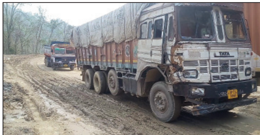
আঠারমুড়ায় জাতীয় সড়কে যান চলাচল স্তব্ধ হয়ে আটকে রয়েছে শত শত গাড়ি।

হয়েছে। এলাকার বিদ্যুতের খুঁটি উপরে পড়েছে এবং বিদ্যুতের তার অবশ্য বিদ্যুৎ নিগমের কর্মীরা পরিস্থিতি সামাল দিতে যুদ্ধকালীন পড়েছে। তাতে এলাকায় ব্যাপক ক্ষয়ক্ষতি হয়েছে। অবশ্য কালবৈশাখীর ঝড়ে এলাকায় প্রাণহানির কোন খবর নেই। মোহনপুরের মনিপুর সহ পার্শ্ববর্তী এলাকা গুলিতে কালবৈশাখীর ঝড় আছড়ে পড়ার খবর পেয়ে প্রশাসনের কর্মকর্তারা সোমবার সকালে এলাকায় ছুটে যান। তারা এলাকার বিভিন্ন বাড়ির পরিদর্শন করে ক্ষয়ক্ষতি নিরূপণের কাজ শুরু করেছেন। প্রশাসনের তরফ থেকে ক্ষতিগ্রস্ত প্রতিটি পরিবারকে আপৎকালীন আর্থিক সাহায্য প্রদানের উদ্যোগ গ্রহণ করা হয়েছে বলে জানা গেছে। এদিকে গতকাল খোয়াই এবং ধলাই জেলাতেও কালবৈশাখী ঝড়ে ব্যাপক ক্ষয়ক্ষতির খবর মিলেছে। রাজ্যের অন্যান্য স্থানগুলোতেও আংশিক কালবৈশাখী ঝড় আসছে পড়ার