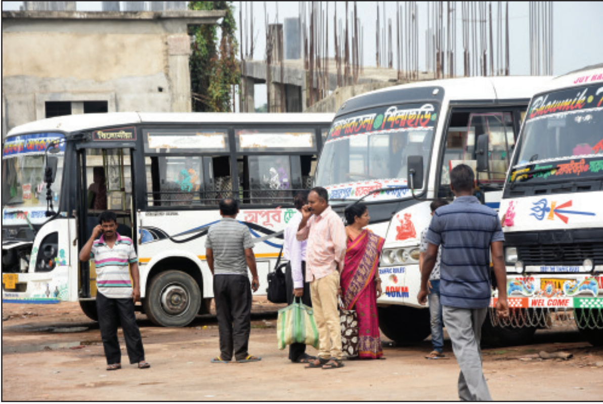
বামপন্থী ট্রেড ইউনিয়নের ডাকা ধর্মঘটে রাজধানী আগরতলায় যান চলাচল স্বাভাবিক ছিল সোমবার।