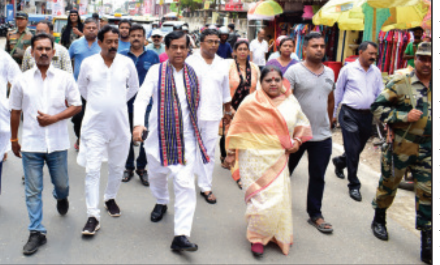
ধর্মঘটের বিরুদ্ধে আগরতলা শহরে পিকেটিং বিজেপি।

রাখার আগাম ঘোষণা করেছিল। স্বাভাবিক কারণ এই বন্ধের দিনে ব্যবসায়ীরা তাদের সমস্ত ব্যবসায়িক প্রতিষ্ঠান খোলা রাখেন। রাস্তায় যানবাহন চলাচল স্বাভাবিক ছিল। ধর্মঘটকে কেন্দ্র করে কোথাও থেকে কোনো ধরনের অপ্রীতিকর ঘটনার খবর মিলেনি। বন্ধকে ব্যস্ত করায় শাসকদলের তরফ থেকে সকল স্তরের জনগণকে অভিনন্দন জানানো হয়েছে। বামপন্থী ট্রেড ইউনিয়নগুলোর ডাকা দুই দিনের ভারত বন্ধে প্রথম দিনে কল্যাণপুরে তেমন সাড়া মিলেনা। সোমবার সকাল থেকেই কল্যাণপুরের বাজার হাট খোলা ছিল। কল্যাণপুর থানা এলাকার বাগান বাজার শান্তিনগর দ্বারিকাপুর ঘিলাতলী খাস কল্যাণপুর দক্ষিণ গিলাতলী মোহনছড়া তোতাবাড়ী সহ নানান বাজারের দোকানপাট খোলা ছিল। খোয়াই তেলিয়ামুড়া সড়কে ছোট ছোট গাড়ি চলেতে বড় গাড়ি কিন্তু দেখা যায়নি বললেই চলে। বামপন্থী ট্রেড ইউনিয়নগুলোর ডাকা দুই দিনের ভারত বন্ধে প্রথম দিনে কল্যাণপুরে তেমন সাড়া মিলেনা। সোমবার সকাল থেকেই কল্যাণপুরের বাজার হাট খোলা ছিল। কল্যাণপুর থানা এলাকার বাগান বাজার শান্তিনগর দ্বারিকাপুর ঘিলাতলী খাস কল্যাণপুর দক্ষিণ গিলাতলী মোহনছড়া তোতাবাড়ী সহ নানান বাজারের দোকানপাট খোলা ছিল। খোয়াই তেলিয়ামুড়া সড়কে ছোট ছোট গাড়ি চলেতে বড় গাড়ি কিন্তু দেখা যায়নি বললেই চলে।