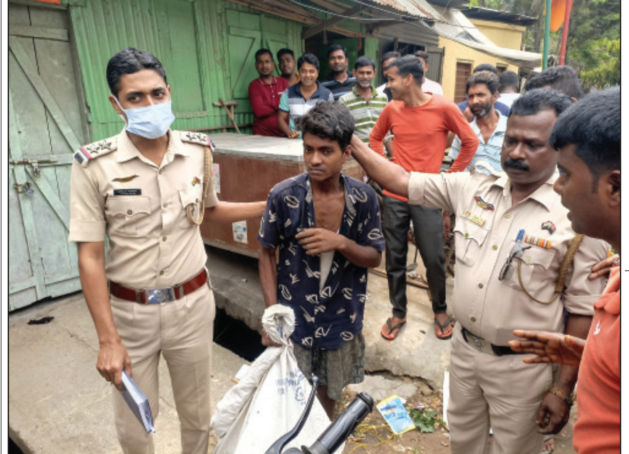
রাজধানী আগরতলা শহরের ফায়ার সার্ভিস টোমুহনীতে এক যুবককে চুরির অভিযোগে আটক করেছে পুলিশ।