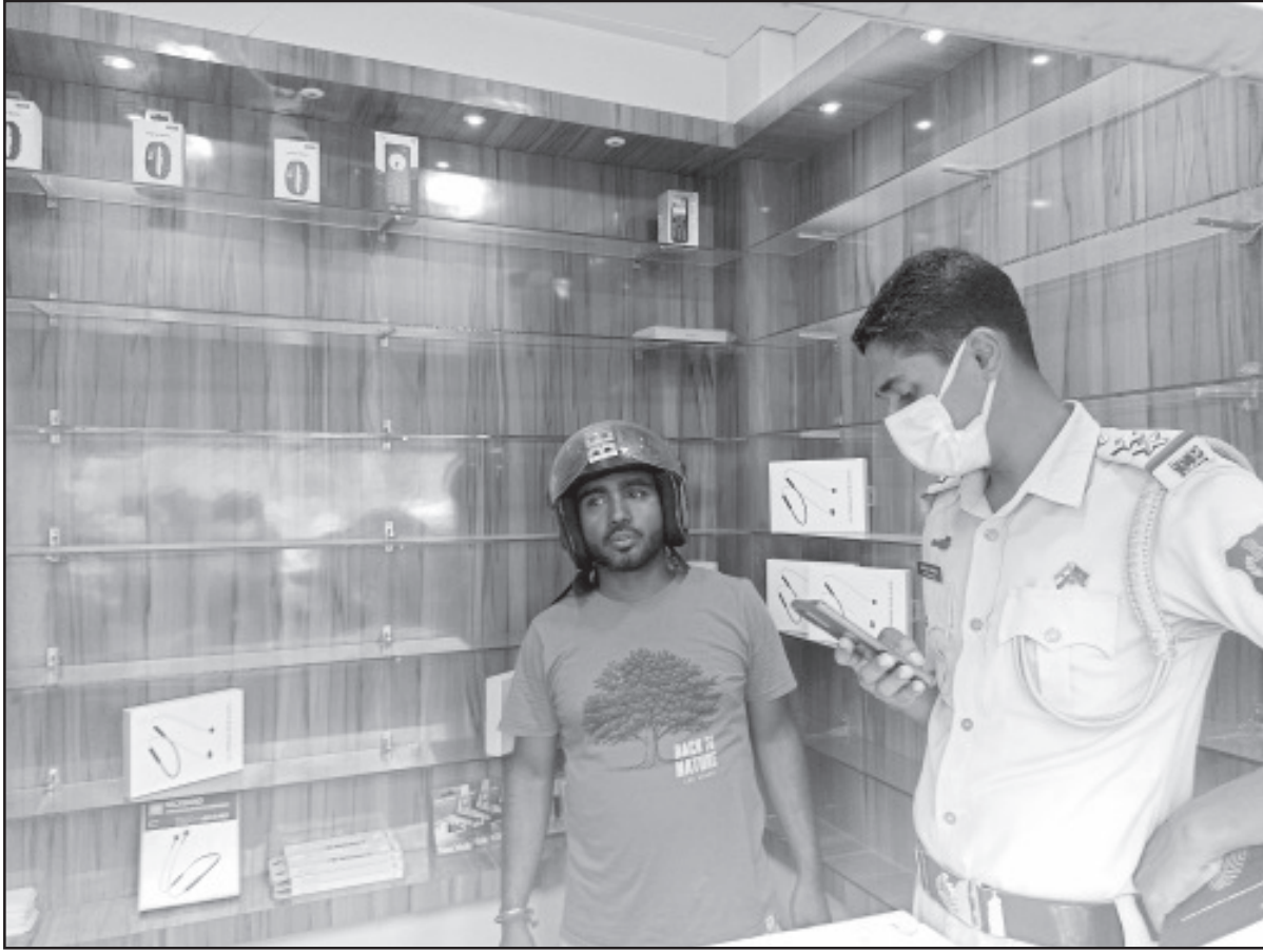
কেস চৌমুহনীতে একটি মোবাইলের দোকানে চোরের দল হানা দেয়। পুলিশ তদন্ত করছে।