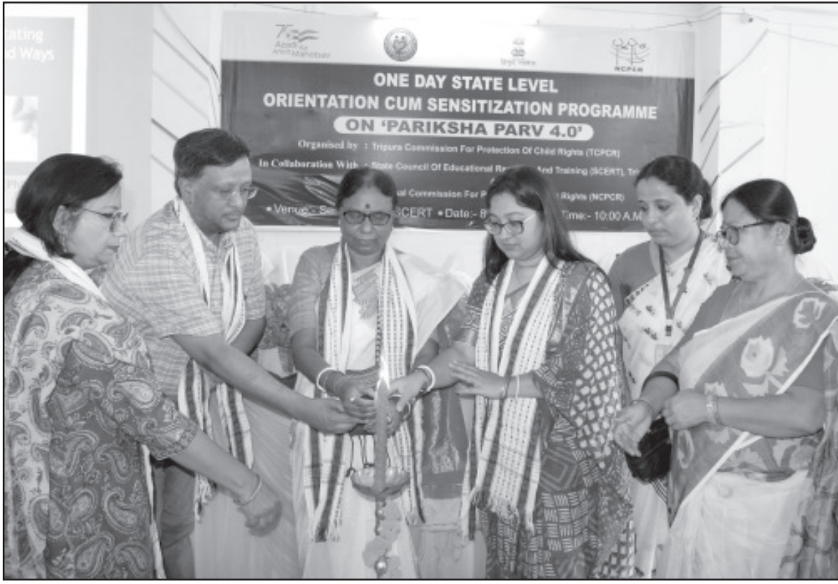
টিসিপিসিআরের উদ্যোগে গুরুবরা সিপার্চে একদিনের কর্মশালায় আয়োজন করা হয়েছে।