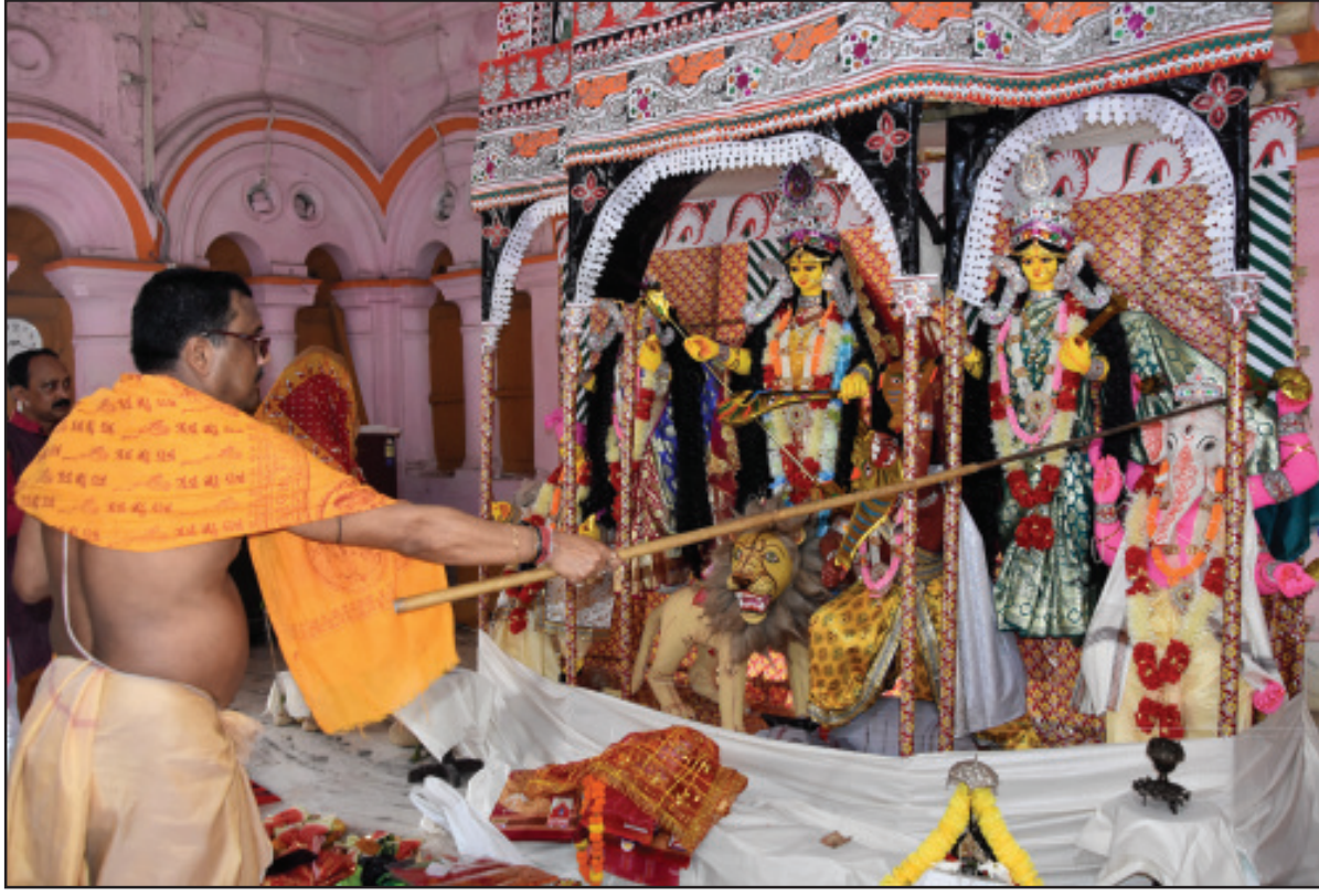
আগরতলায় দুর্গাবাড়িতে বাসন্তী পূজা। শুক্রবার তোলা নিজস্ব ছবি।