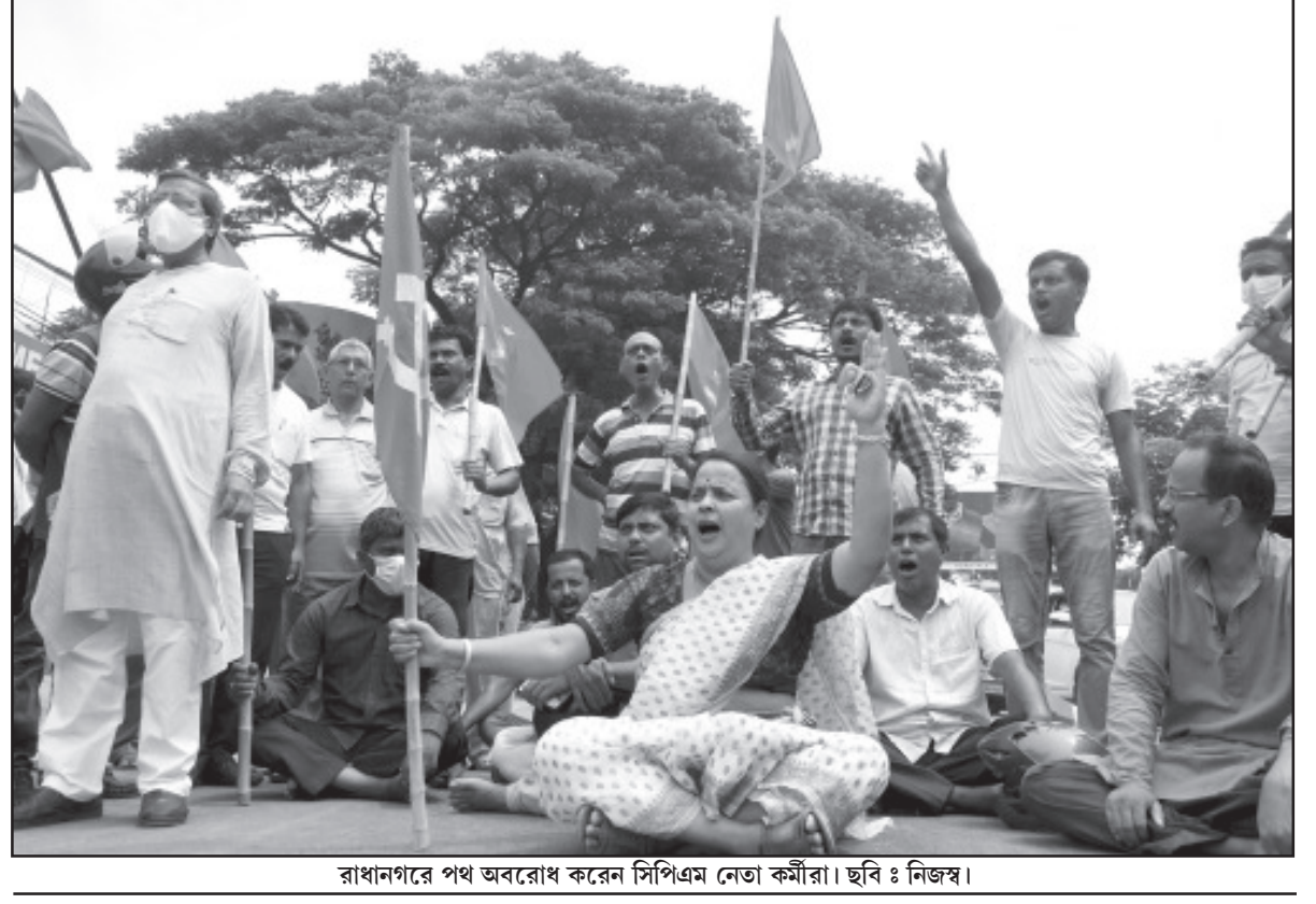
রাধানগরে পথ অবরোধ করেন সিপিএম নেতা কর্মীরা।

আলিপুরদুয়ার, ৭ জুন (হি. স.): দলনেত্রীর সভা বলে কথা। মমতা বন্দ্যোপাধ্যায় পৌঁছানোর অনেক আগেই প্যারড গ্রাউন্ড মাঠ ভরাতে শুরু করেছিলেন কর্মী-সমর্থকরা। ঘাসফুল শিবিরের সমর্থকদের রাজ্য সরকারের কাজের খতিয়ান রেখে বিরোধীদের সুখন একের পর এক আক্রমণ শানাচ্ছেন তৃণমূল সুপ্রিমো, তখনই ঘটে এক বিপত্তি। মূল মঞ্চের ডান দিকে সংজ্ঞাহীন হুওয়ার মতো অবস্থা হয় এক তৃণমূল কর্মী-সমর্থকের। তিনি মাটিতে পড়ে যান আর ঘটনাটি চোখ এড়ায়নি মমতা বন্দ্যোপাধ্যায়ের। তিনি তৎক্ষণাৎ বক্তব্য থামিয়ে ছুটে যান সেদিকে। মঞ্চ থেকে নিজের জলের বোতল নিয়ে ছুড়ে দেন সেদিকে দাঁড়ানো কর্মী-সমর্থকদের উদ্দেশে। দ্রুত ওই কর্মীর চোখে জলে দেওয়ার পরামর্শ দিয়ে আরও জলের বোতল পাঠাতে বলেন। পাশাপাশি মঞ্চ থেকেই মমতা বন্দ্যোপাধ্যায় নির্দেশ দেন, "এখনই কোনও ডাক্তার দেখিয়ে নাও।" তারপরই 'প্রবল গরম ও রোদে শরীর শুকিয়ে যাওয়ার জন্য এরকমটা হতে পারে' বলে মাইক হাতে জানান মুখ্যমন্ত্রী।