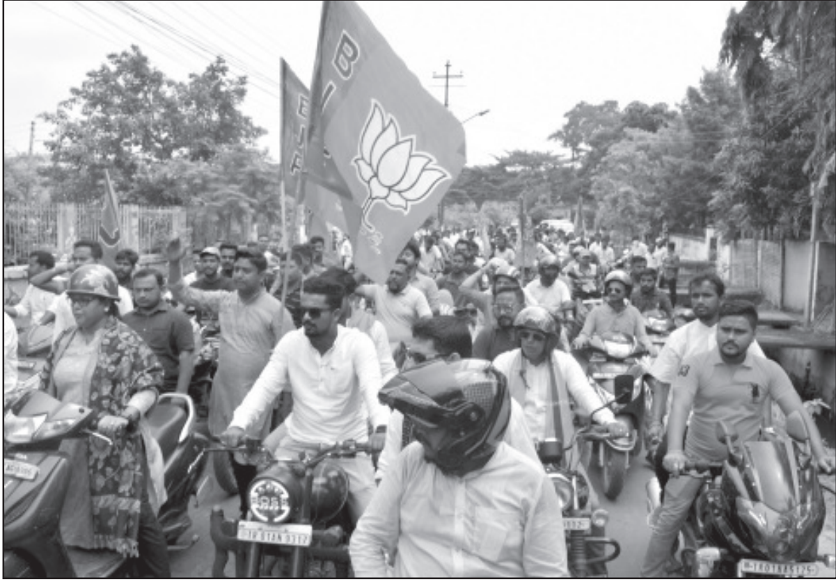
কেন্দ্রের মোদি সরকারের আট বছর পূর্তি উপলক্ষে যুব মোর্চার বাইক র্যালি আগরতলায়।