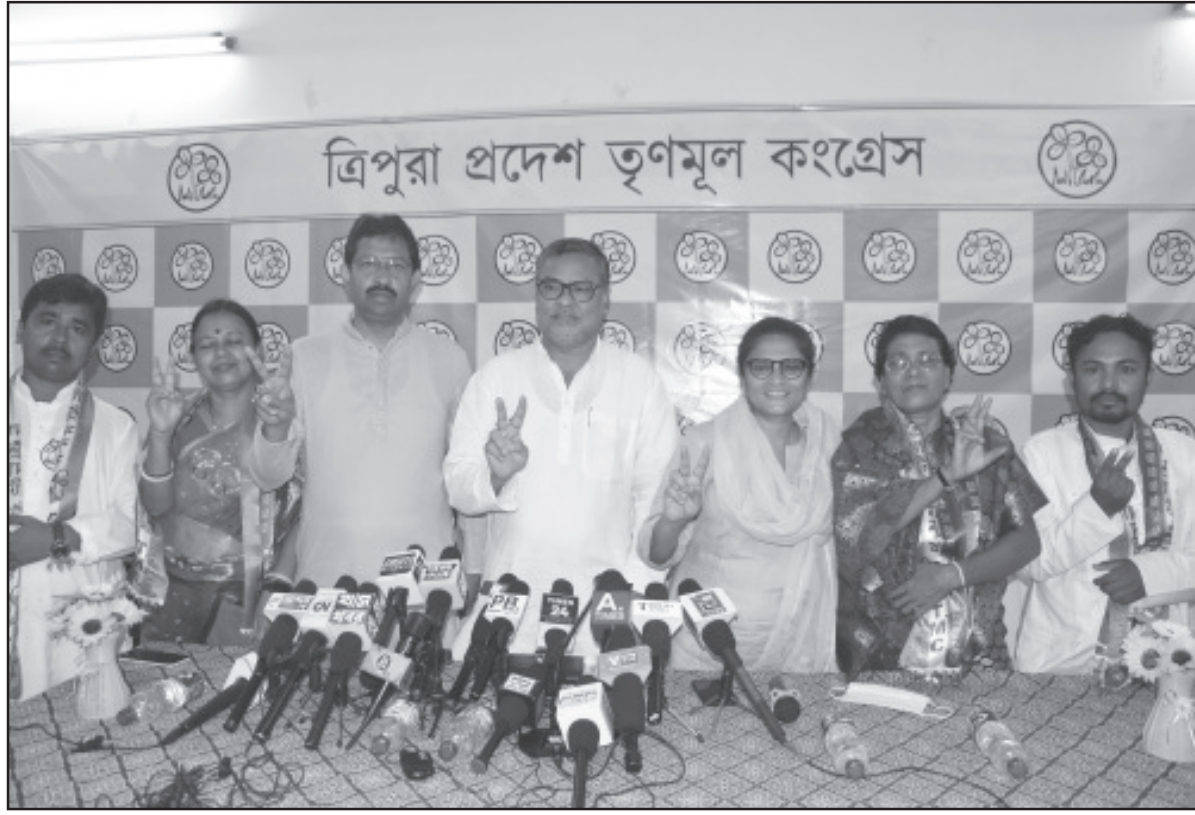
সাংবাদিক সম্মেলনে বক্তব্য রাখেন প্রদেশ তৃণমূল কংগ্রেস নেতৃবৃন্দ।