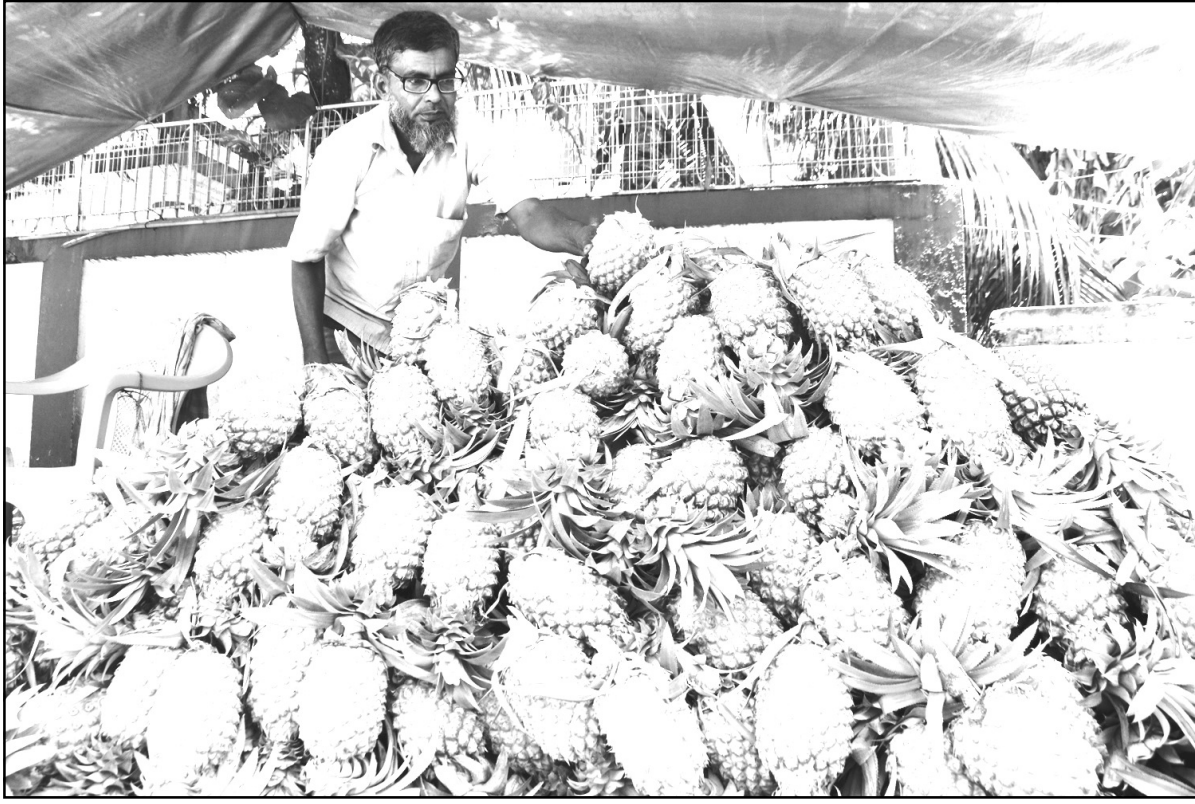
বাজারে এসে গেছে রসালো ফল আনারস।