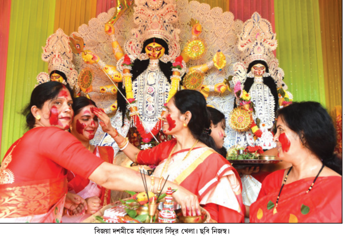
বিজয়া দশমীতে মহিলাদের সিঁদুর খেলা।