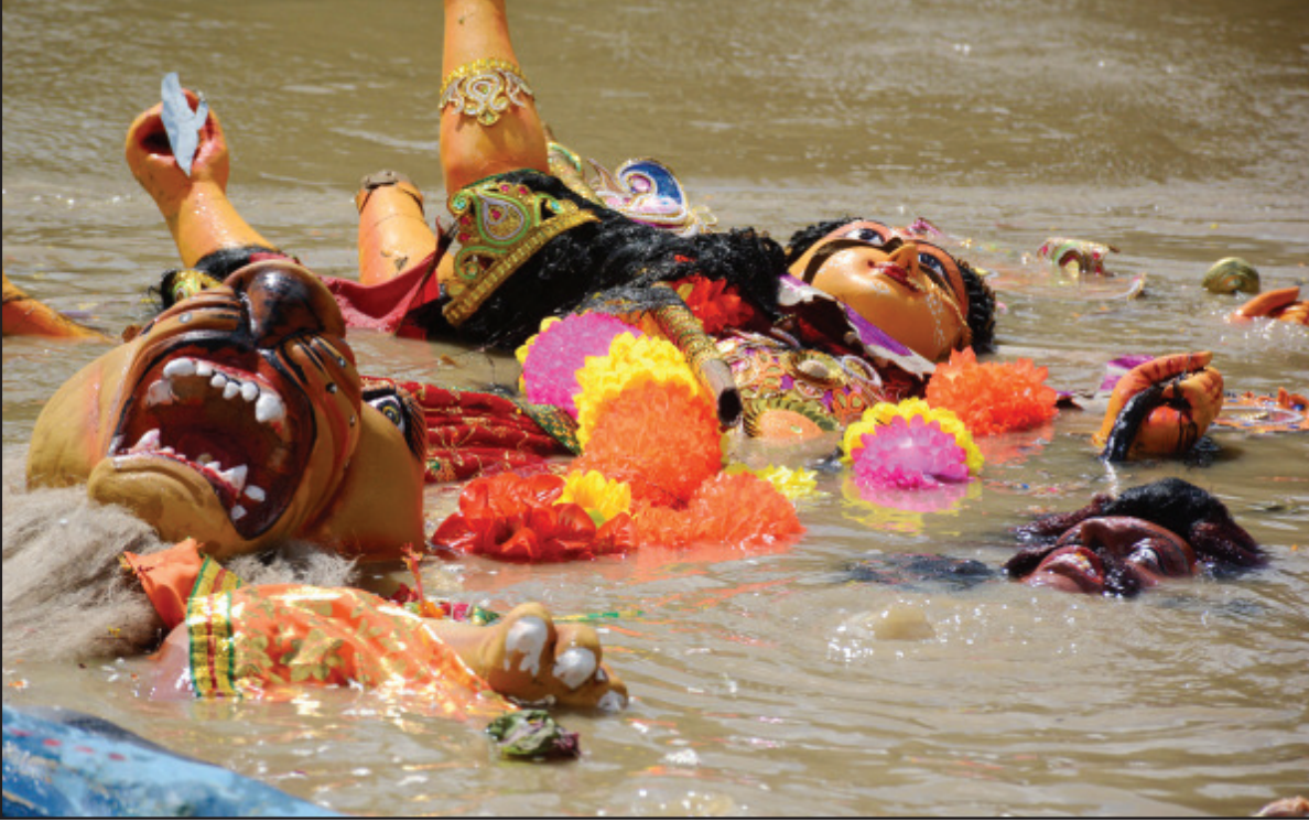
আগরতলায় দশমীঘাটে দেবী দুর্গার বিসর্জন। বৃহস্পতিবার তোলা নিজস্ব ছবি।