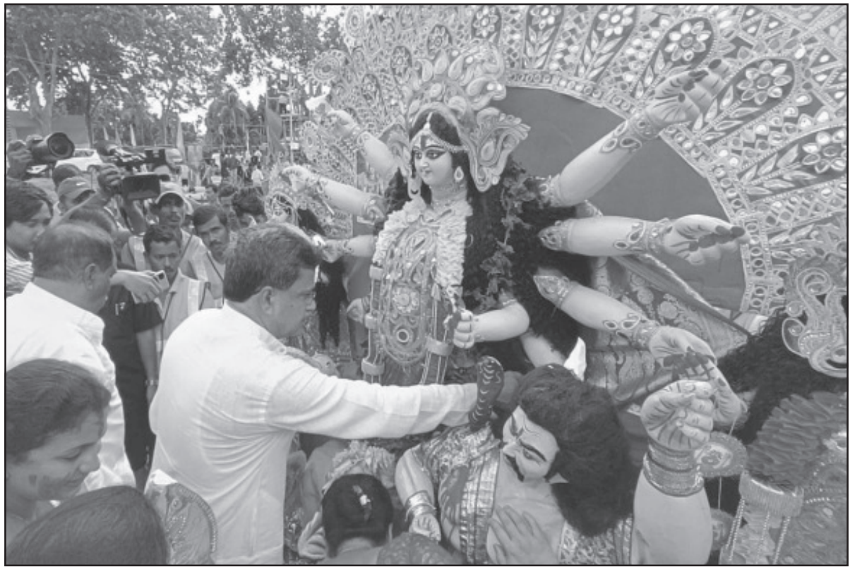
বিজয়া দশমীতে অংশ নিলেন মুখ্যমন্ত্রী ডঃ মানিক সাহা।

নিরঞ্জন যখন পুরোদমে চলছে তখন আচমকা ধেয়ে আসে হড়পা বান। সে দিকে খেয়াল ছিল না কারও। তার জেরে নদীতে যাঁরা নেমেছিলেন তাঁদের অনেকেই ষোড়ের টানে ভেসে যান। টাকেও ষোড়ের টানে ভেসে যায়। মাল নদীর মাঝে একটা চর রয়েছে। সেই চরে উঠে প্রাণ বাঁচান অনেকে। এই দুর্ঘটনায় শোক প্রকাশ করেছেন প্রধানমন্ত্রী নরেন্দ্র মোদী। টুইটে তিনি লিখেছেন, “জলপাইগুড়িতে প্রতিমা নিরঞ্জন সময় যে দুর্ঘটনা ঘটেছে তাতে আমি ক্ষুব্ধ। এই দুর্ঘটনায় যাঁরা মারা গিয়েছেন, তাঁদের পরিবারের প্রতি গভীর শোক প্রকাশ করছি।”