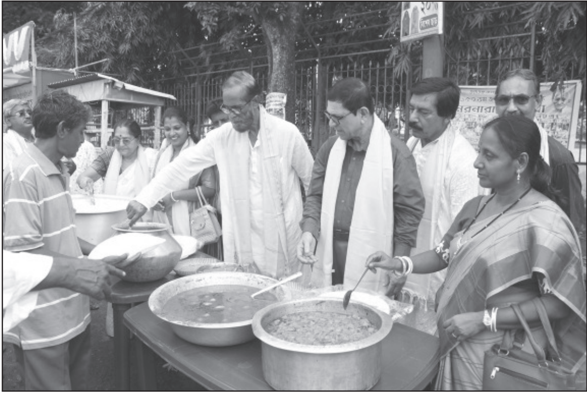
গান্ধীজির জন্মজয়ন্তীতে ২রা অক্টোবর কমিটির উদ্যোগে খাদ্য সামগ্রী বিতরণ করা হয়।