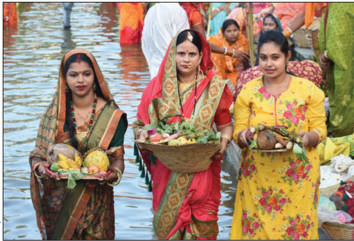
রবিবার ব্যাপক উৎসাহ উদ্দীপনায় ছট পূজা পালিত হয় আগরতলায়।