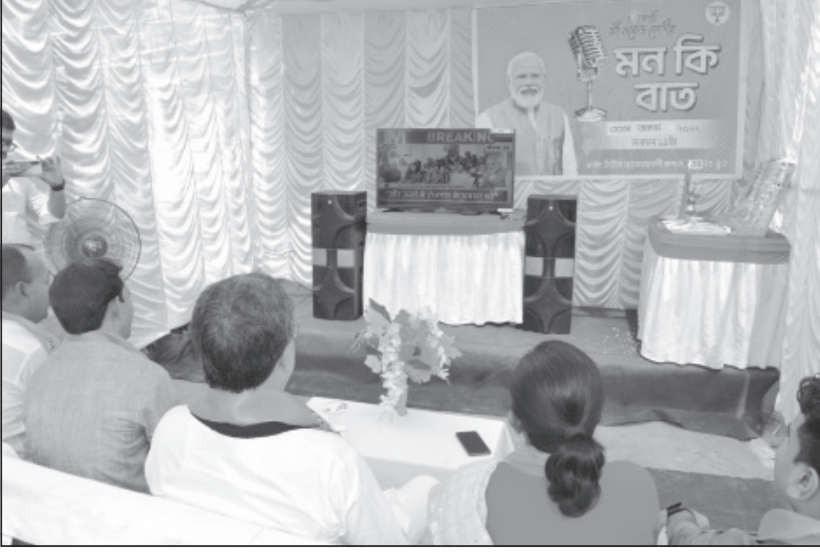
রবিবার দলীয় কর্মীদের নিয়ে প্রধানমন্ত্রীর মন কি বাত অনুষ্ঠান দেখেন মুখ্যমন্ত্রী মানিক সাহা।