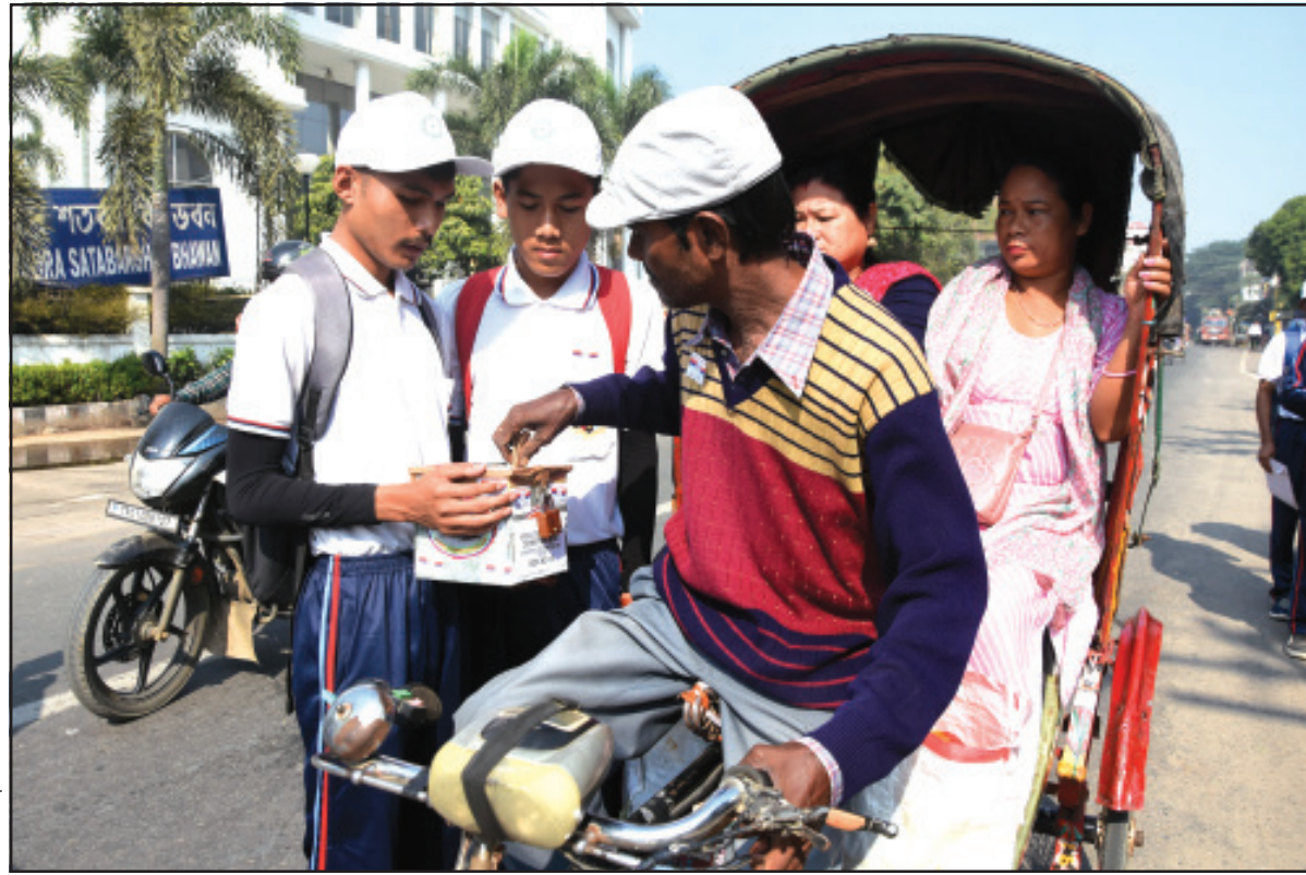
বৃহবার পতাকা দিবস উপলক্ষে আগরতলায় তহবিল সংগ্রহ অভিযান।