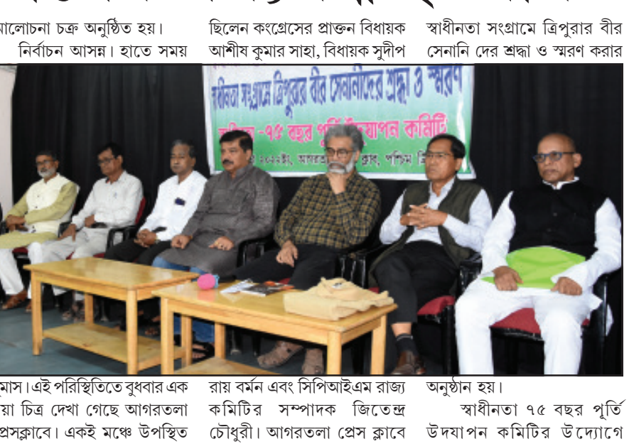
দুমাস। এই পরিস্থিতিতে বুধবার এক নয়া চিত্র দেখা গেছে আগরতলা প্রেসক্লাবে। একই মঞ্চে উপস্থিত

নিজস্ব প্রতিনিধি, আগরতলা, ৭ ডিসেম্বর।। স্বাধীনতা সংগ্রামে ত্রিপুরার বীর সেনানীদের শ্রদ্ধা ও সম্মান জানিয়ে বাম কংগ্রেসের ঐক্যবদ্ধ হওয়ার পথ প্রশস্ত হল। বুধবার আগরতলা প্রেস ক্লাবে স্বাধীনতার ৭৫ বছর পূর্তি উদযাপন কমিটির উদ্যোগে স্বাধীনতার সংগ্রামে ত্রিপুরার বীর সেনানীদের শ্রদ্ধা ও স্মরণ শীর্ষক আলোচনা চক্র অনুষ্ঠিত হয়। ভারতের স্বাধীনতা সংগ্রামে ত্রিপুরার জনগণের অংশগ্রহণ আজও নানাভাবে সমাদৃত। ত্রিপুরা থেকে যারা স্বাধীনতা সংগ্রামে অংশগ্রহণ করেছিলেন তাদের স্মরণে বুধবার আগরতলা প্রেস ক্লাবে স্বাধীনতার ৭৫ বছর পূর্তি উদযাপন কমিটির উদ্যোগে এক