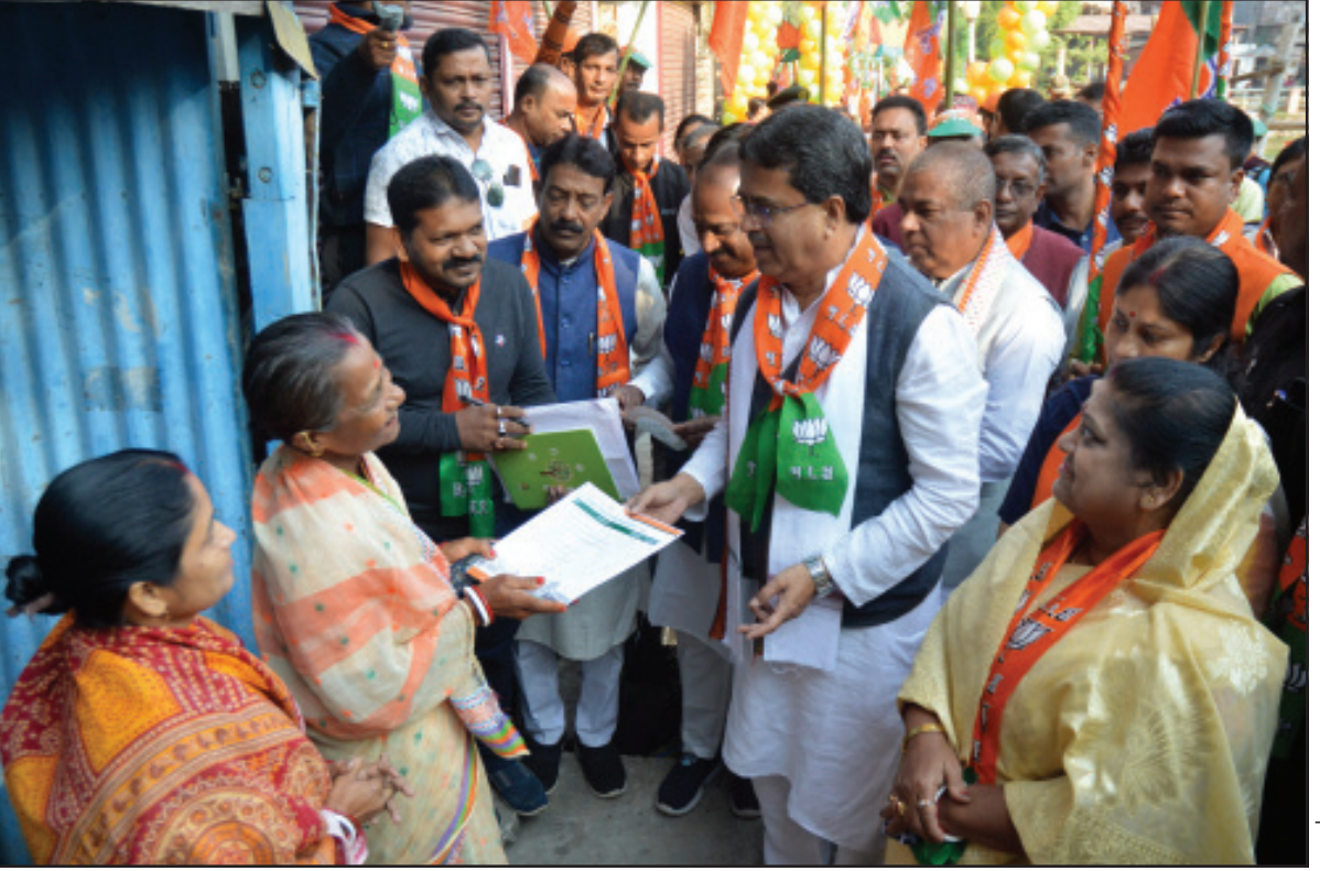
বড়দোয়ালীতে ঘরে ঘরে বিজেপি কর্মসূচিতে যোগ দিলেন মুখ্যমন্ত্রী প্রফেসার (ডঃ) মানিক সাহা। বুধবার তোলা নিজস্ব ছবি।