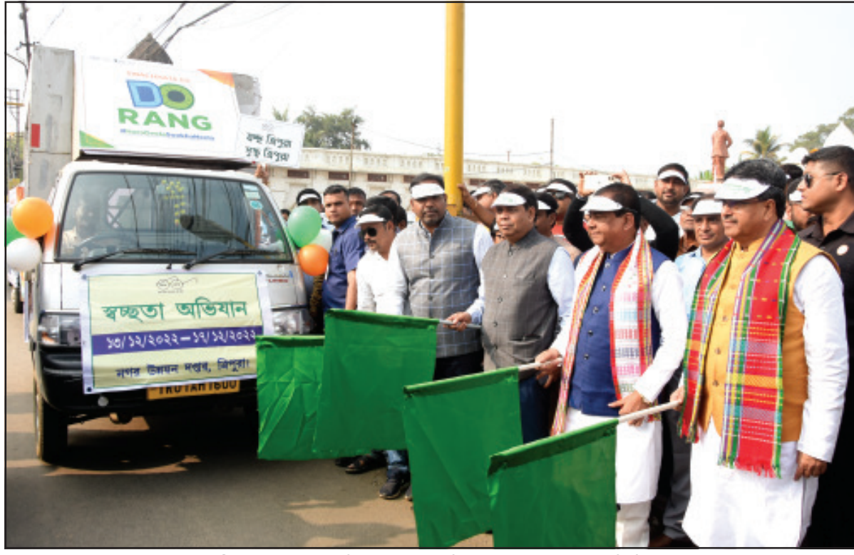
মুখ্যমন্ত্রী প্রফেসর (ডা.) মানিক সাহা স্বচ্ছ অভিযান এর সূচনা করেন।