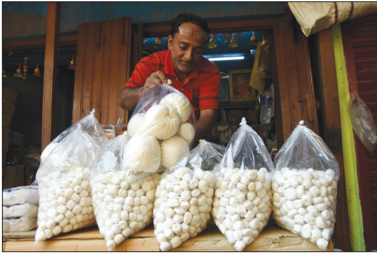
সামনেই পৌষ সংক্রান্তি। তাই বাজারে এসে গেছে তিল হরতকি।