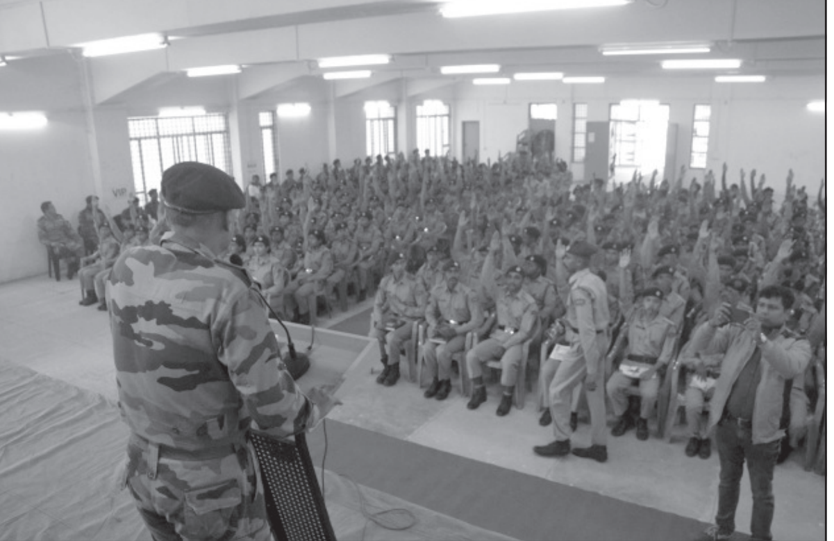
এনএসএস জওয়ানের নিয়ে মঙ্গলবার আগরতলায় একদিবসীয় কর্মশালা আয়োজিত হয়।

পর্যন্ত ভারতে মোট সূস্থ হয়েছেন ৪,৪১,৪৭,১৭৪ জন করোনা-রোগী, শতাংশের নিরিখে ৯৮.৮০ শতাংশ। ভারতে মোট করোনায় সংক্রমিত হয়েছেন ৪,৪৬,৮০,২১৫ জন। এদিকে, দেশব্যাপী টিকাকরণ অভিযানের আওতায় বিগত ২৪ ঘণ্টায় ভারতে করোনায় ভ্যাকসিন পেয়েছেন ৫৬ হাজার ৮২৯ জন প্রাপক, ফলে ভারতে মঙ্গলবার