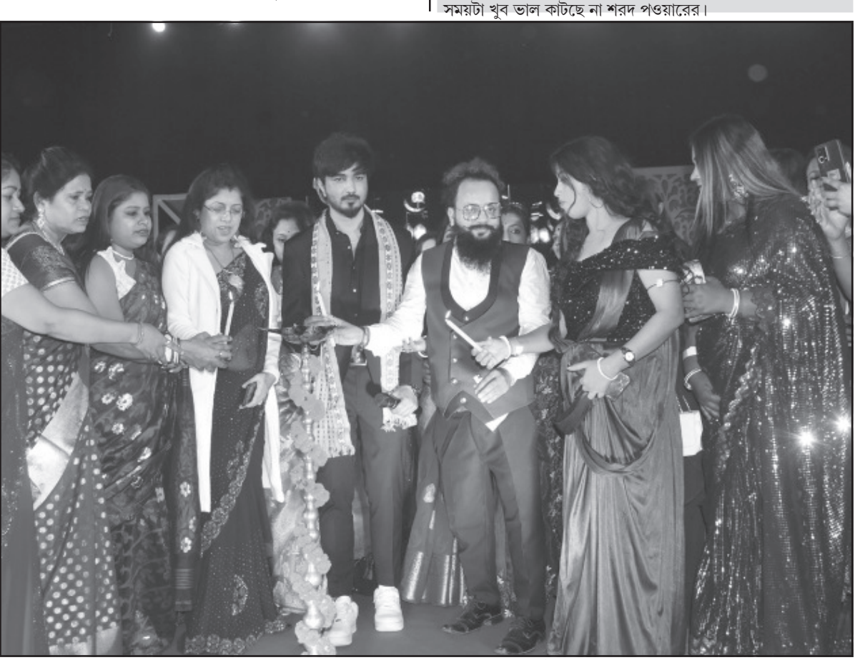
মঙ্গলবার অল ইন্ডিয়া মেকআপ আর্টিস্টরা এক দিবসীয় এক কর্মশালার আয়োজন করেন।