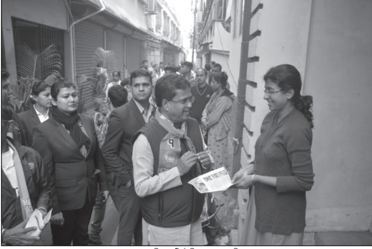
৮ বনমালীপুরে নির্বাচনী প্রচারে মুখ্যমন্ত্রী।