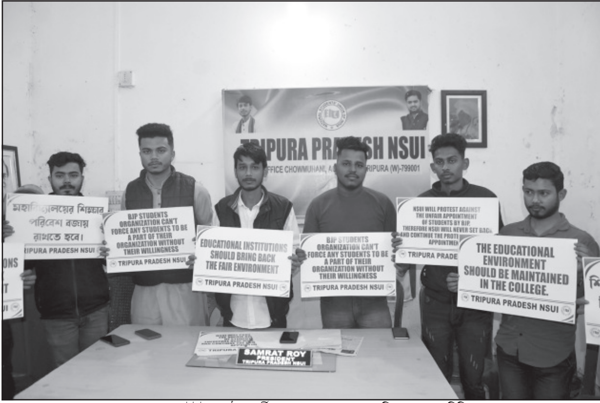
মঙ্গলবার এনএসআইইউ সংগঠনে কর্মীরা আগরতলায় এক সাংবাদিক সম্মেলনে মিলিত হন।