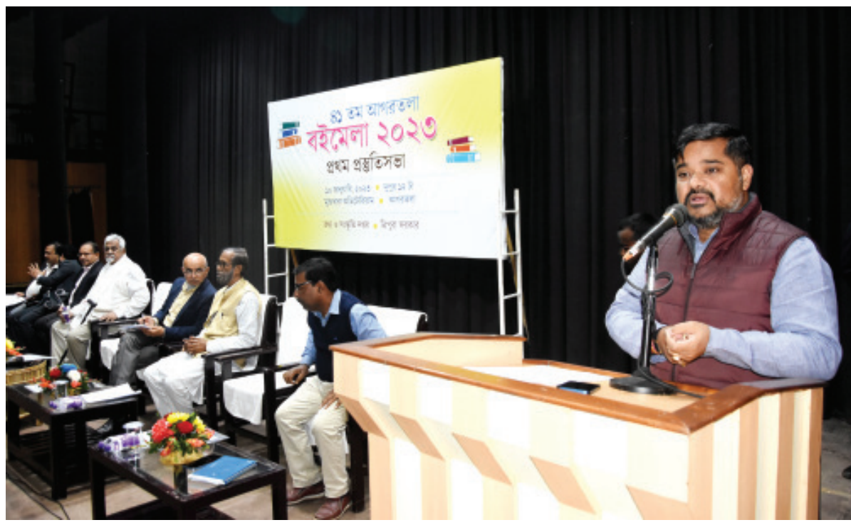
আগরতলা বইমেলা নিয়ে মঙ্গলবার রবীন্দ্র শতবার্ষিকী ভবনে এক বৈঠক অনুষ্ঠিত হয়েছে।