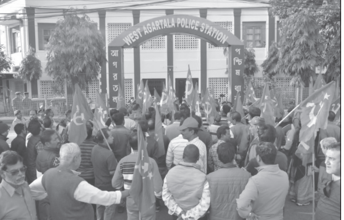
বিভিন্ন দাবি নিয়ে মঙ্গলবার পশ্চিম থানা ঘেরাও করেন সিপিএম কর্মকর্তা।