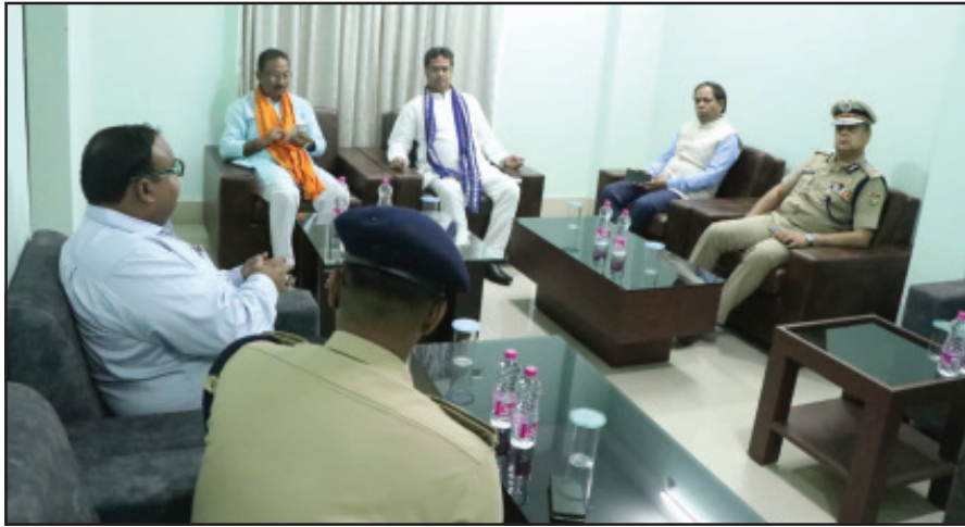
খোয়াইয়ে পুলিশ ও সাধারণ প্রশাসনের আধিকারীকদের নিয়ে বৈঠক করলেন মুখ্যমন্ত্রী প্রফেসর ডাঃ মানিক সাহা এবং পুলিশের ডি.জি.

নিজস্ব প্রতিনিধি, আগরতলা, ৪ মার্চ। রাজ্যজুড়ে নির্বাচনোত্তর সন্ত্রাস মারাত্মক রূপ নিয়েছে। বিভিন্ন জায়গায় বাড়ি ঘরে হামলা হুজুরি পাশাপাশি সম্পত্তি নষ্ট করা হচ্ছে।