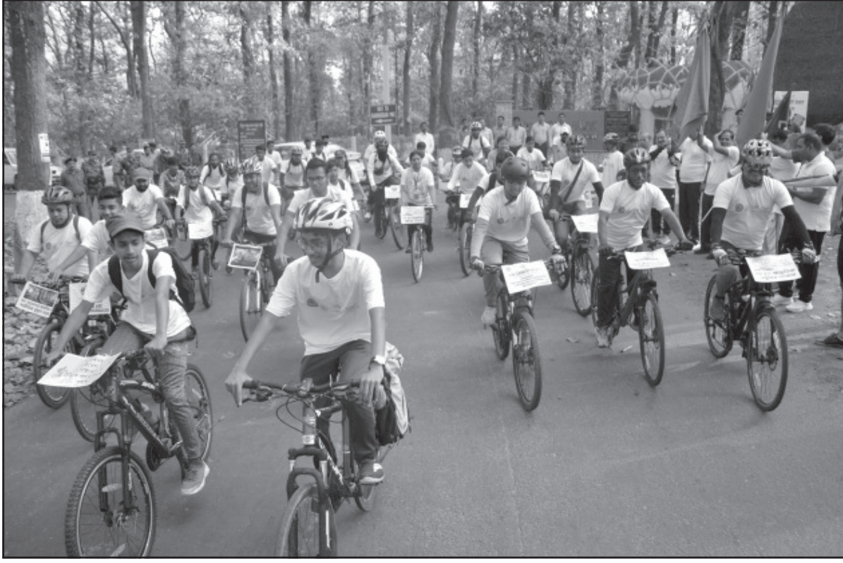
সোমবার বিশ্ব বনদিবস উপলক্ষে একটি বাইসাইকেল র্যালীর আয়োজন করা হয়।