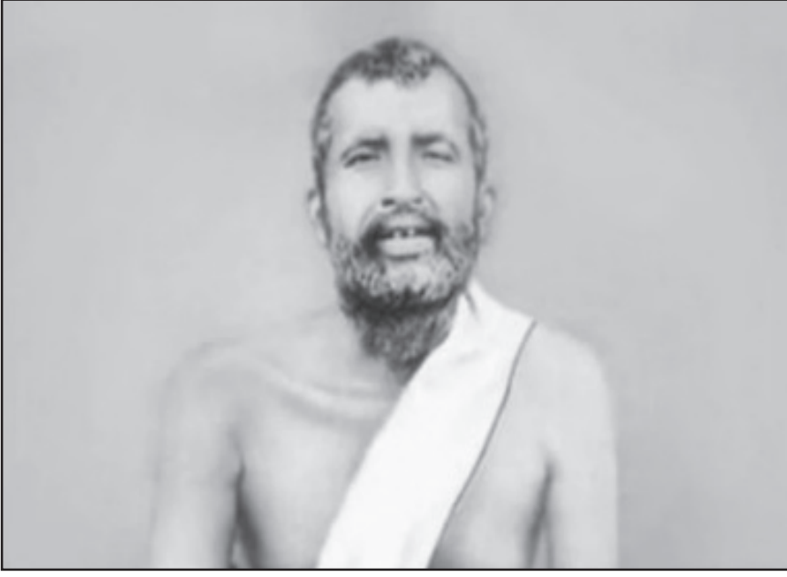
হোক, দরিদ্র হোক, পথের পাশে পাড়ে থাকা কোনও ভিখারী হোক - সে কিন্তু চায় বাঁচতে। কিন্তু বাঁচা আমরা একটু একটু করে মৃত্যুর দিকে এগিয়ে যাব। মৃত্যুর দিকে মানে কী? অস্তিত্ব থেকে

শব্দটার অর্থ আমরা কেউই জানি না। বাঁচা মানে আমরা যেটুকু ব্যাখ্যা করি বা বুঝি, সেটুকু হচ্ছে একটা অভ্যাসের চাকায় আবর্তিত হওয়া। রোজ সকাল আসবে, রাত্রি আসবে - আবার সকাল আসবে, আবার রাত্রি আসবে - এবং