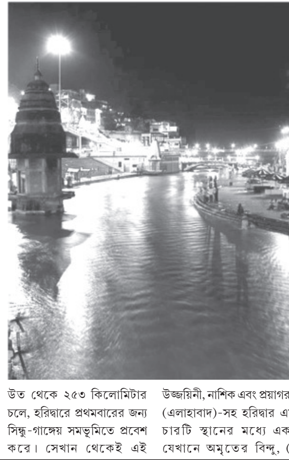
উত থেকে ২৫০ কিলোমিটার চলে, হরিদ্বারে প্রথমবারের জন্য সিন্ধু-গাঙ্গেয় সমভূমিতে প্রবেশ করে। সেখান থেকেই এই

হিন্দুদের কাছে পবিত্রভূমি হরিদ্বার। কিংবদন্তি অনুযায়ী, এখানেই দেবী গঙ্গা ভগবান শিবের চুল থেকে মুক্তি পেয়ে পৃথিবীতে নেমেছিলেন। গঙ্গোত্রী হিমবাহের প্রান্তে গোমুখ থেকে উত্থিত হয়ে,