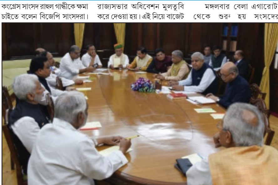
রাজ্যসভার চেয়ারম্যান জগদীপ ধনখড়ের ডাকে অনুষ্ঠিত হয়েছে সর্বদলীয় বৈঠক।

নয়া দিল্লি, ২১ মার্চ (হি.স.)। আগামী ২৩ মার্চ বেলা এগারোটাই অবধি মূলতুবি হয়ে গেল লোকসভা ও রাজ্যসভার অধিবেশন। রাজ্যসভার চেয়ারম্যান জগদীপ ধনখড় ঘোষণা করেছেন, ২২ মার্চ রাজ্যসভার কোনও অধিবেশন বসবে না, ওই দিন বিভিন্ন উৎসব সম্পর্কিত বৈশিষ্ট্যসম্পন্ন সনদের প্রস্তাব বিবেচনা করে এই সিদ্ধান্ত নিয়েছেন চেয়ারম্যান জগদীপ ধনখড়। একইভাবে আগামী ২৩ মার্চ বেলা এগারোটাই অবধি মূলতুবি হয়ে গিয়েছে লোকসভার অধিবেশনও।