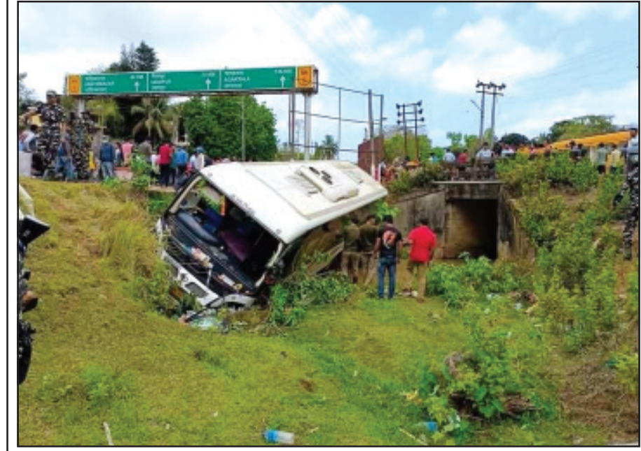
মঙ্গলবার এক বাইসাইকেল আরোহীকে বাঁচাতে সাক্ষমে যাত্রীবাহী বাস খাদে পড়ে যায়।