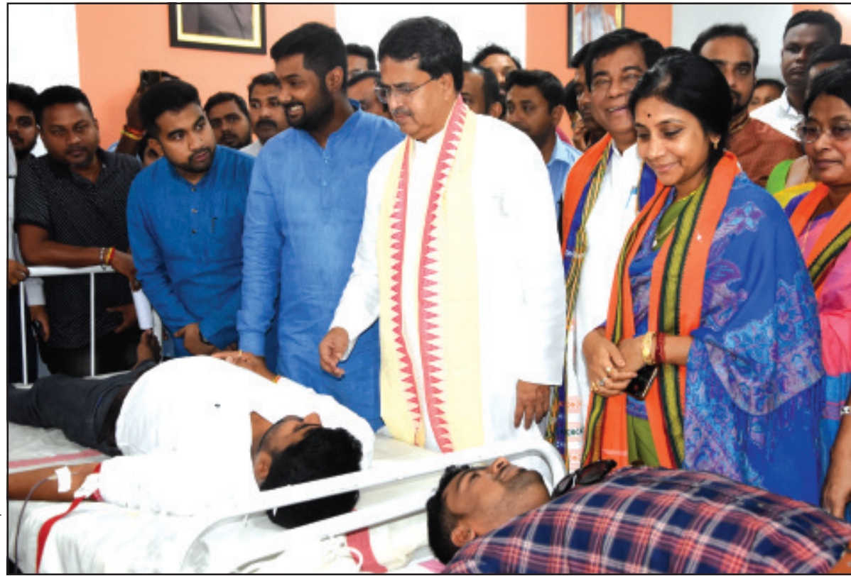
বিজেপি যুব মোর্চার উদ্যোগে আগরতলায় দলের নির্বাচনী কার্যালয়ে রক্তদান শিবির ঘুরে দেখেন মুখ্যমন্ত্রী প্রফেসর (ডাঃ) মানিক সাহা।