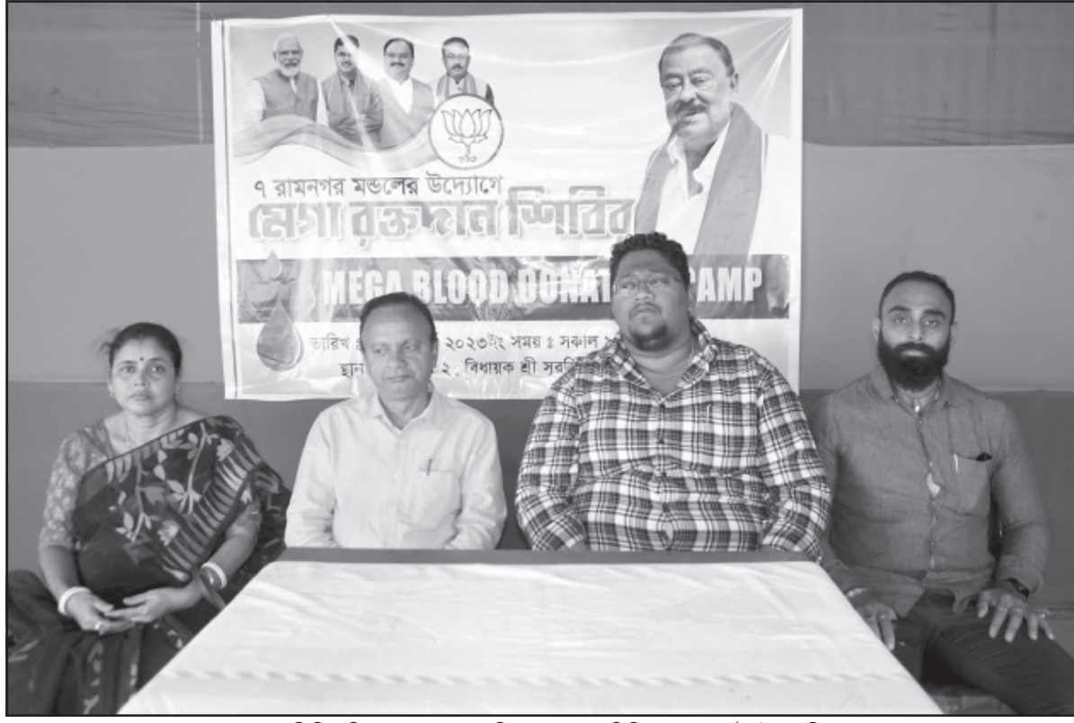
মেগা রক্তদান শিবির নিয়ে বৃহস্পতি সাংবাদিক সম্মেলনে মিলিত হন কর্পোরেশনের অভিযেক দত্ত।