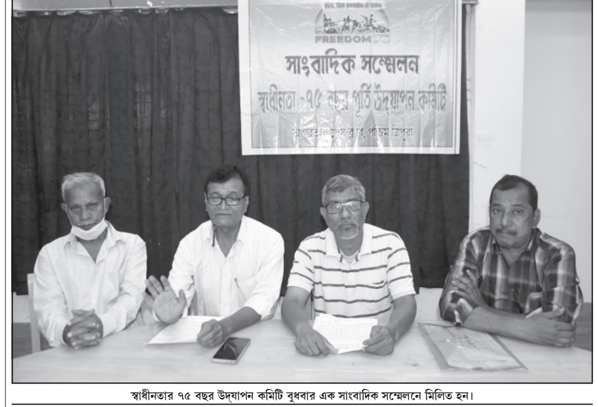
স্বাধীনতার ৭৫ বছর উদ্‌যাপন কমিটি বৃহস্পতি এক সাংবাদিক সম্মেলনে মিলিত হন।

নয়াদিল্লি, ২২ মার্চ (হি.স.): যে সমস্ত দেশ ডিজিটাল রূপান্তর করতে চাইছে, তাঁদের জন্য ভারত একটি রোল মডেল। বললেন আন্তর্জাতিক টেলিকমিউনিকেশন ইউনিয়নের সেক্রেটারি জেনারেল ডোরিন বোগদান। প্রধানমন্ত্রী নরেন্দ্র মোদী বৃহস্পতি নতুন দিল্লিতে নতুন আন্তর্জাতিক টেলি যোগাযোগ ইউনিয়ন (আইটিইউ)-এর এরিয়া অফিস এবং উদ্ভাবনী কেন্দ্রের সূচনা করেছেন। এই অনুষ্ঠানেই আন্তর্জাতিক টেলিকমিউনিকেশন ইউনিয়নের সেক্রেটারি জেনারেল ডোরিন বোগদান বলেছেন, যে সমস্ত দেশ ডিজিটাল রূপান্তর করতে চাইছে তাঁদের জন্য ভারত একটি রোল মডেল। ভারত হল বিশ্বের অন্যতম বড় স্টার্টআপ ইকোসিস্টেম, ডিজিটাল পেমেট মার্কেট এবং প্রযুক্তিগত কর্মসূচির আবাসস্থল। আন্তর্জাতিক টেলিকমিউনিকেশন ইউনিয়নের সেক্রেটারি জেনারেল ডোরিন বোগদান আরও বলেছেন, প্রধানমন্ত্রী মোদীর দুরদৃষ্টি ও নেতৃত্বে ডিজিটাল ইন্ডিয়া আধার, ইউপিআই এবং অন্যান্যের মতো গেম পরিবর্তনকারী উদ্যোগের সঙ্গে প্রযুক্তি উদ্ভাবন এবং অভিযোজনে দেশকে এগিয়ে রেখেছে। তাঁর কথায়, ভারতে উদ্ভাবন দ্রুতগতিতে এবং কম খরচে হচ্ছে, এর আগে কখনও এমনটা দেখা যায়নি। রাষ্ট্রসংঘের তথ্য ও যোগাযোগ প্রযুক্তি সংক্রান্ত বিশেষ এই সংস্থা আন্তর্জাতিক টেলিকমিউনিকেশন ইউনিয়ন (আইটিইউ)-এর সদর দফতর হল জেনিভায়। গত বছর মার্চে ভারত এই এরিয়া অফিস গড়ে তোলার জন্যে আইটিইউ-এর সঙ্গে চুক্তি বন্ধ হয়। নতুন আন্তর্জাতিক টেলিকমিউনিকেশন ইউনিয়ন এরিয়া অফিস এবং ইনোভেশন সেন্টার নতুন দিল্লি থেকে কাজ করবে এবং ভারত, নেপাল, ভুটান, বাংলাদেশ, শ্রীলঙ্কা, মালদ্বীপ, আফগানিস্তান এবং ইরানকে সেবা প্রদান করবে।