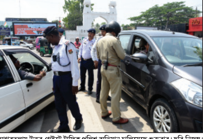
আগরতলায় উত্তর গেটে ট্রাফিক পুলিশ অভিযান চালিয়েছে গুজরার।

নিজস্ব প্রতিনিধি, আগরতলা, ৭ এপ্রিল। গাড়ির সিট বেল্ট বাধা নিয়ে রাজপথে সাড়াশি অভিযান ট্রাফিক পুলিশের। আজ থেকে শুরু হয়েছে সিট বেল্ট বাধার জন্য অভিযান। চালক ও সামনে বসে সহযাত্রীর সিট বেল্ট বাধা তামূলক বাধার জন্য অভিযানে নেমেছে ট্রাফিক পুলিশ। আইন অমান্য করার দায়ে ৫০০ টাকা করে জরিমানা আদায় করা হয়েছে। গুজরার ওই অভিযান আগরতলায় উত্তর গেট সংলগ্ন এলাকায় চলেছে। জৈনিক ট্রাফিক পুলিশ জানিয়েছে, প্রতি নিয়ত যান দুর্ঘটনার বলি হচ্ছে বহু মানুষ। তাই দুর্ঘটনা জনিত মৃত্যু রোধে বিশেষ অভিযানে নেমেছে ট্রাফিক পুলিশ। ট্রাফিক দপ্তর থেকে কিছুদিন পূর্বে বিজ্ঞপন দিয়ে গাড়ি চালকদের সতর্ক করা হয়েছিল। গাড়ি চালানোর সময় সিট বেল্ট অবশ্যই বাঁধতে হবে। কারণ দিন দিন রাজ্যে দুর্ঘটনা বেড়ে চলেছে। আগামী দিনে ৭০ শতাংশ চালক ও যাত্রী সিট বেল্ট ব্যবহার করছেন না। তাই আজ থেকে শুরু হয়েছে সিট বেল্ট বাধার জন্য অভিযান। চালক ও সামনে বসে সহযাত্রীর সিট বেল্ট বাধা তামূলক বাধার জন্য অভিযানে নেমেছে ট্রাফিক পুলিশ। আইন অমান্য করার দায়ে ৫০০ টাকা করে জরিমানা আদায় করা হয়েছে। গুজরার ওই অভিযান আগরতলায় উত্তর গেট সংলগ্ন এলাকায় চলেছে। জৈনিক ট্রাফিক পুলিশ জানিয়েছে, প্রতি নিয়ত যান দুর্ঘটনার বলি হচ্ছে বহু মানুষ। তাই দুর্ঘটনা জনিত মৃত্যু রোধে বিশেষ অভিযানে নেমেছে ট্রাফিক পুলিশ। ট্রাফিক দপ্তর থেকে কিছুদিন পূর্বে বিজ্ঞপন দিয়ে গাড়ি চালকদের সতর্ক করা হয়েছিল। গাড়ি চালানোর সময় সিট বেল্ট অবশ্যই বাঁধতে হবে। কারণ দিন দিন রাজ্যে দুর্ঘটনা বেড়ে চলেছে। আগামী দিনে ৭০ শতাংশ চালক ও যাত্রী সিট বেল্ট ব্যবহার করছেন না। তাই