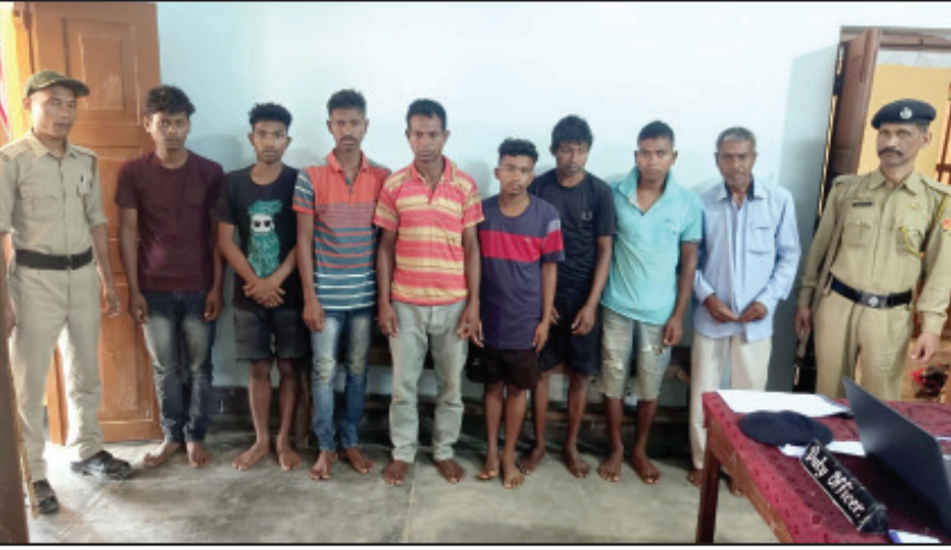
ডাইনি সন্দেহে মহিলাকে খুনের মামলায় গ্রেপ্তার করা হয়েছে আটজনকে।