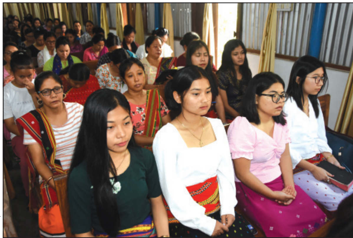
গুডফ্রাইডে উপলক্ষে কৃষকগণ চার্চে বিশেষ প্রার্থনা।