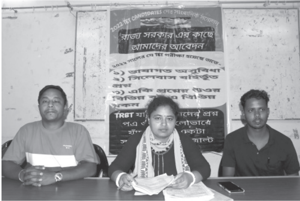
স্টেট পরীক্ষার্থী বিভিন্ন দাবী আপত্তি নিয়ে শুক্রবার সাংবাদিক সম্মেলনে বক্তব্য রাখেন।