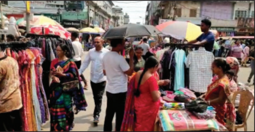
শিশু উদ্যান থেকে শুরু করে ওরিয়েন্ট চৌমুহনি ও শকুন্তলা রোডের দুপাশে কামান চৌমুহনি সূর্য, চৌমুহনি হয়ে মহারাজগঞ্জ বাজার ছাড়া ও পোস্ট অফিস চৌমুহনি পর্যন্ত রাস্তায় হরেক রকম জিনিসের পসরা সাজিয়ে বসেছেন দোকানিরা। তীব্র দাহরণে মধ্যেও ঘাম ঝরছে ক্রেতা বিক্রেতার। তবু থেমে নেই কেনাকাটার।