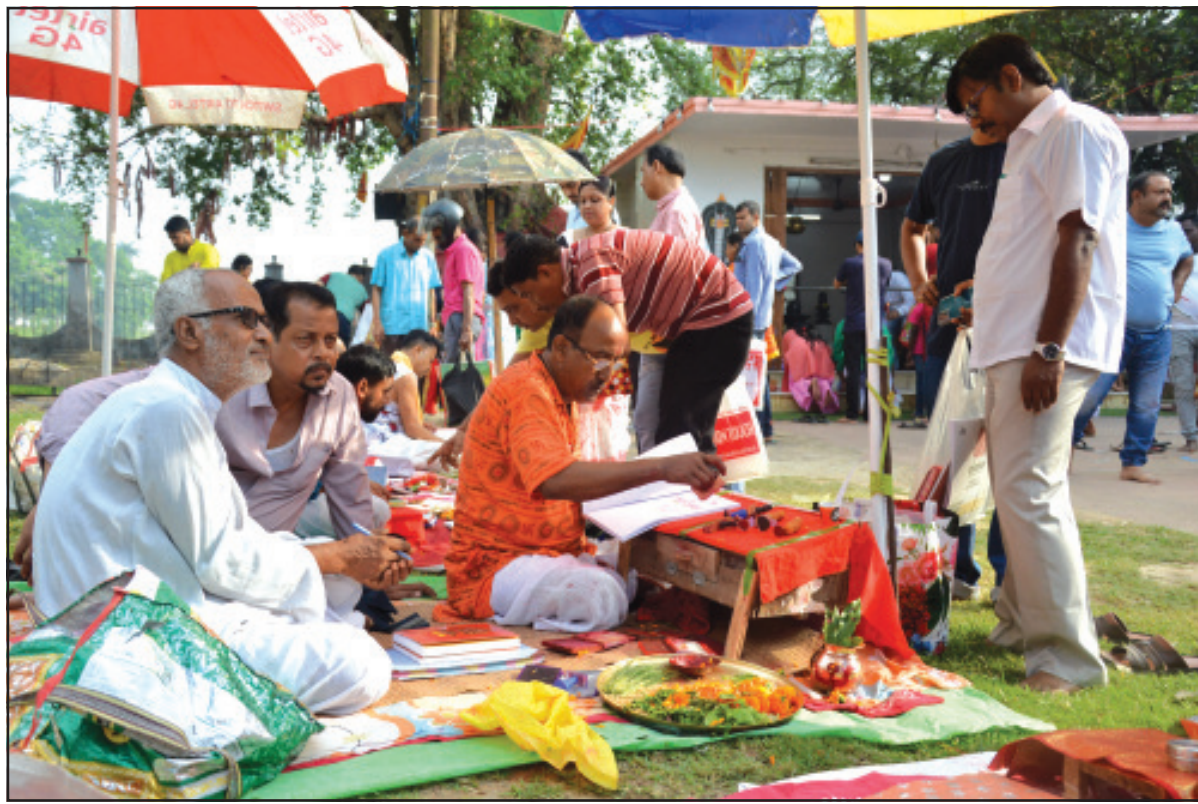
পয়লা বৈশাখের দিন লক্ষ্মীনারায়ণ মন্দিরে হালখাতা যাত্রা করান ব্যবসায়ীরা।