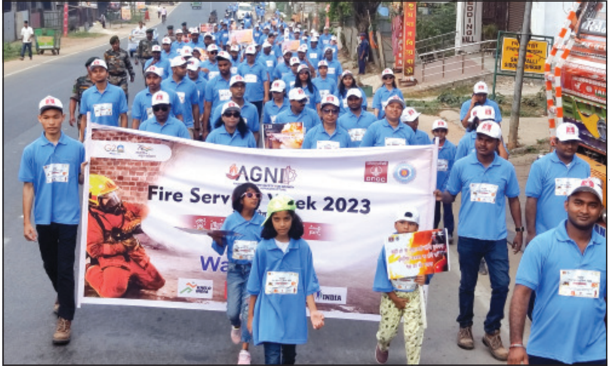
ফায়ার সার্ভিস সপ্তাহ উপলক্ষে আগরতলায় সচেতনতা র্যালি।