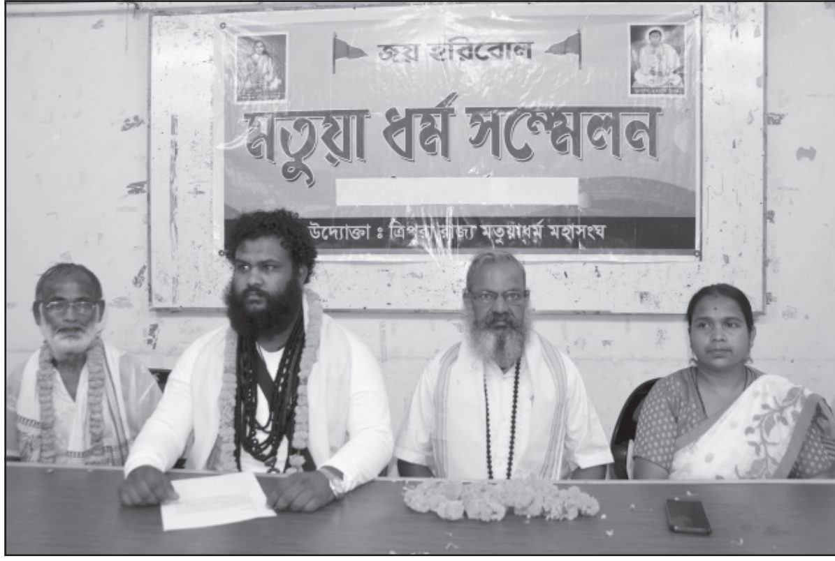
রবিবার আগরতলা প্রেস ক্লাবে আয়োজিত সাংবাদিক সম্মেলনে মতুয়া ধর্ম সম্মেলনে কর্মকর্তারা।