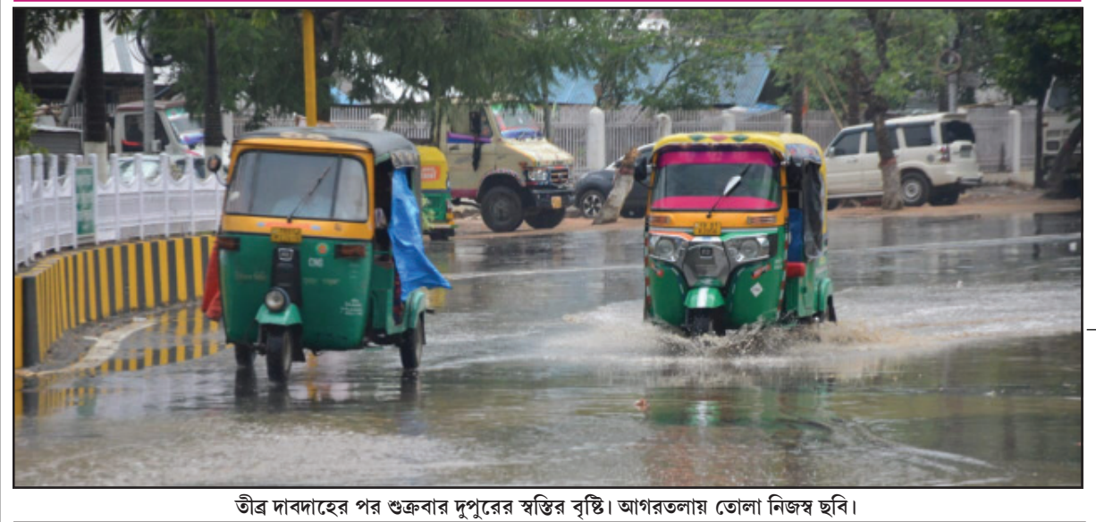
তীব্র দাবদাহের পর শুক্রবার দুপুরের স্বস্তির বৃষ্টি। আগরতলায় তোলা নিজস্ব ছবি।