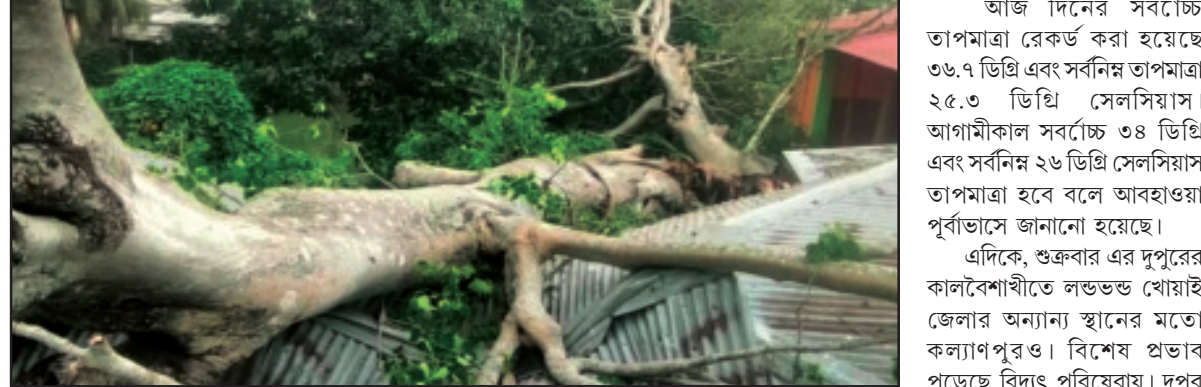
তেলিয়ামুড়াতে ভেঙ্গে পড়ল শত বর্ষ পুরনো বটগাছ।

নিজস্ব প্রতিনিধি, আগরতলা/ কল্যাণপুর/তেলিয়ামুড়া, ২১ এপ্রিল। প্রচণ্ড গরমে মানুষের নান্দিকশাস উঠে যাওয়ার পর আজ মিলিয়ে প্রাক বর্ষা আজ ত্রিপুরার আবহাওয়ায় মনোরম করে তুলেছে। তবে, কালবৈশাখীর ঝড়ে কিছু ক্ষয়ক্ষতিও হয়েছে।