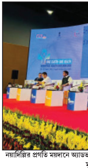
নয়াদিল্লির প্রগতি ময়দানে আয়ুর্ভাটেন্ট হেলথ কেয়ার ইন্ডিয়া ২০২৩ শীর্ষক আলোচনায় অংশ নিয়েছেন মুখ্যমন্ত্রী প্রফেসর (ডাঃ) মানিক সাহা।

থেকে বহু রোগী চিকিৎসার জন্য ত্রিপুরায় আসেন। যদি রাজ্যে বিশ্বমানের চিকিৎসা কাজে লাগিয়ে রাজ্যে একটি আয়ুর্বেদিক ঔষধ তৈরির কেন্দ্র স্থাপনের সম্ভাবনা রয়েছে। আজ নয়াদিল্লির প্রগতি ময়দানে আয়ুর্ভাটেন্ট হেলথ কেয়ার ইন্ডিয়া ২০২৩ শীর্ষক আলোচনায় অংশ নিয়ে একথা জোর গলায় দাবি করেন ত্রিপুরার মুখ্যমন্ত্রী অম্বাপক (ডাঃ) মানিক সাহা। সাথে তিনি যোগ করেন, ত্রিপুরা সরকার স্বাস্থ্য পরিষেবায় এক পরিবর্তনশীল ও প্রগতিশীল নীতি নিয়ে কাজ করছে। এদিন তিনি বলেন, প্রধানমন্ত্রী নরেন্দ্র মোদীর নেতৃত্বে ভারতের এক পৃথিবী এক স্বাস্থ্যের দৃষ্টিভঙ্গি যা সমস্ত প্রাণীর জন্য সামগ্রিক স্বাস্থ্যসেবা জড়িত, রোগ প্রতিরোধ, খরচ কমাতে, খাদ্য নিরাপত্তা উন্নত করতে এবং জীবন বাঁচাতে সাহায্য করবে। শ্রী সাহা আরও বলেন, ত্রিপুরা সরকার স্বাস্থ্য পরিষেবায় বাস্তব চালাচ্ছে। প্রতিবেশী দেশ বাংলাদেশ এক পরিবর্তনশীল ও প্রগতিশীল নীতি নিয়ে কাজ করছে।