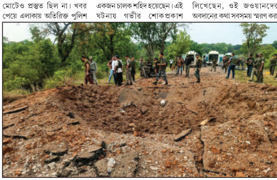
ছত্তিশগড়ের দাস্তেওয়াড়াতে মাওবাদীদের আইইডি বিস্ফোরণের পর নিরাপত্তা বাহিনী তদন্ত করছে।