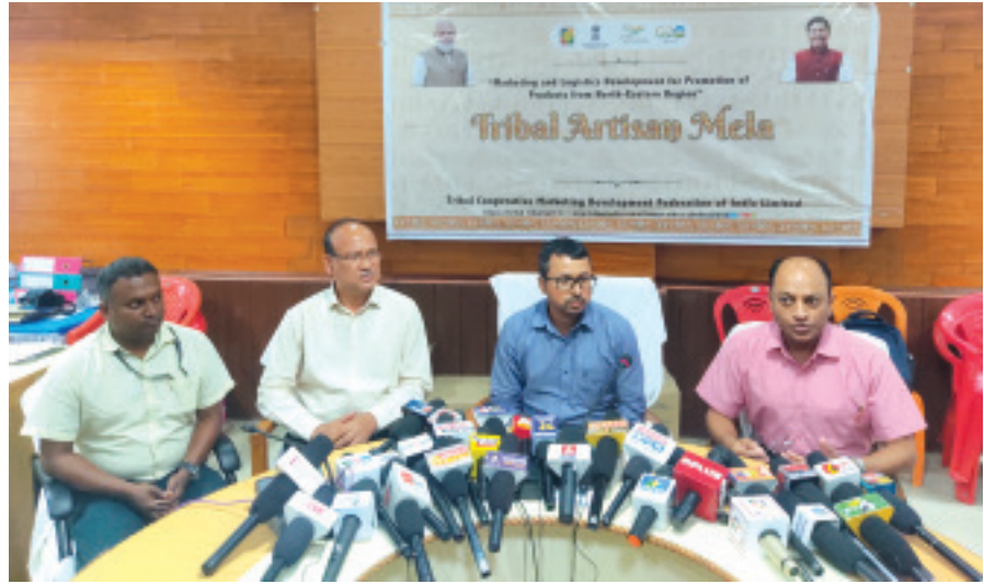
নিজস্ব প্রতিনিধি, আগরতলা, ২৬ এপ্রিল। পশ্চিম জেলায় ট্রাইবেল আর্টিসান মেলায়